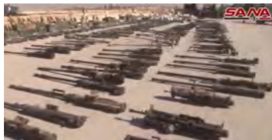
Droite : Canons anti-aériens de l'Etat islamique. Gauche : Lance-roquettes anti-char