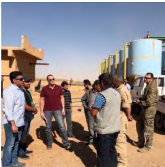
Le général américain Brett McGurk (troisième à partir de la gauche) avec le ministre saoudien Thamer Al-Sabhan (premier à gauche). La photo aurait été prise lors de leur visite à Al-Raqqah (Compte Twitter, 21 octobre 2017)

► Il semble que les Etats-Unis et les Kurdes tentent d'enrôler les Saoudiens dans la tâche de reconstruction d'Al-Raqqah , afin de contrer l'influence d'acteurs affiliés au régime syrien. Le ministre saoudien des Affaires étrangères chargé des affaires du Golfe Thamer Al-Sabhan et l'envoyé du Président américain auprès de la coalition mondiale de lutte contre l'Etat islamique Brett McGurk se sont rendus à Al-Raqqah . Le journal saoudien Ukaz a cité des sources proches de la coalition, selon lesquelles la visite d'Al-Sabhan dans la région rurale du Nord [de la Syrie] et dans la ville d'Al-Raqqah a eu lieu grâce à un accord entre l'Arabie saoudite et les États-Unis au sujet de la restauration de la sécurité et de la stabilité de la ville . En outre, il a été signalé que Riyad et Washington ont discuté de la reconstruction d'Al-Raqqah, dans laquelle l'Arabie saoudite jouera un rôle central (CNN en arabe, 20 octobre 2017).