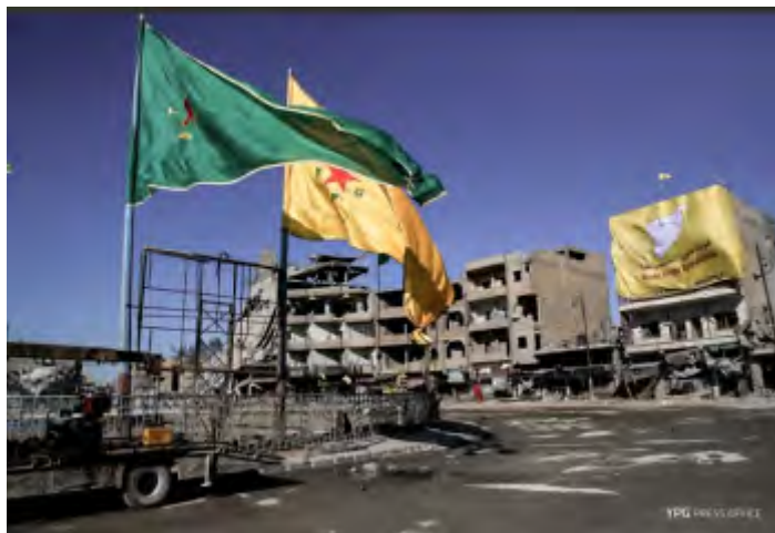
Place Al-Naim à Al-Raqqah. Droite : Drapeau géant des FDS accroché sur la façade d'un bâtiment. Gauche : Drapeaux géants des organisations kurdes en Syrie (GPJ et YPJ), principales composantes des FDS

cela, les forces des FDS ont œuvré au déminage de la ville, au dégagement des routes et à la recherche de membres de l'Etat islamique se cachant dans la ville (AP, 18 octobre 2017 ; quotidien Al-Sharq Al-Awsat, 19 octobre 2017). Talal Selo a demandé à toutes les entités et organisations internationales de participer à la réhabilitation de la ville.