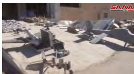
Drones de l'Etat islamique saisis par l'armée syrienne à Al-Mayadeen

► Les Syriens ont également publié une vidéo de la situation dans la ville d'Al-Mayadeen après sa reprise. La vidéo montre essentiellement des institutions publiques