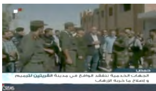
Droite : Un responsable syrien examine la situation à Al-Qaryatayn après sa reprise. Gauche : Distribution de vivres aux habitants d'Al-Qaryatayn (Télévision syrienne, 22 octobre 2017)