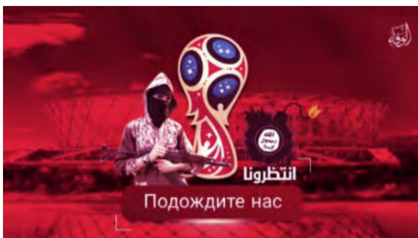
L'affiche de l'Etat islamique menaçant de mener des attaques pendant la Coupe du Monde 2018 en Russie. L'affiche indique "Attendez-nous" en arabe et russe