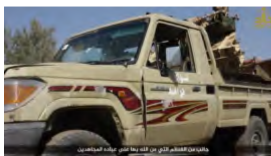
Droite : Véhicule des forces rebelles saisi par l'Armée Khaled bin Al-Walid dans la zone rurale au Nord-Ouest de Deraa. Gauche : Armes saisies par l'Armée Khaled bin Al-Walid (Al-Sawarim, 20 octobre 2017)