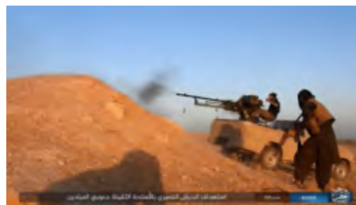
Affrontements entre membres de l'Etat islamique et soldats de l'armée syrienne au Sud d'Al-Mayadeen (Haqq, 20 octobre 2017)

► Les Syriens ont publié une vidéo montrant de grandes quantités d'armes trouvées après la reprise d'Al-Mayadeen. Les armes découvertes incluent des mitrailleuses, des canons anti-aériens, des lance-roquettes, des canons SPG-9 de 155 mm, des chars et une voiture blindée fabriquée par l'organisation. En outre, la vidéo montre des drones (Compte Youtube Sana, 19 octobre 2017). L'absence de combats contre les forces syriennes et la