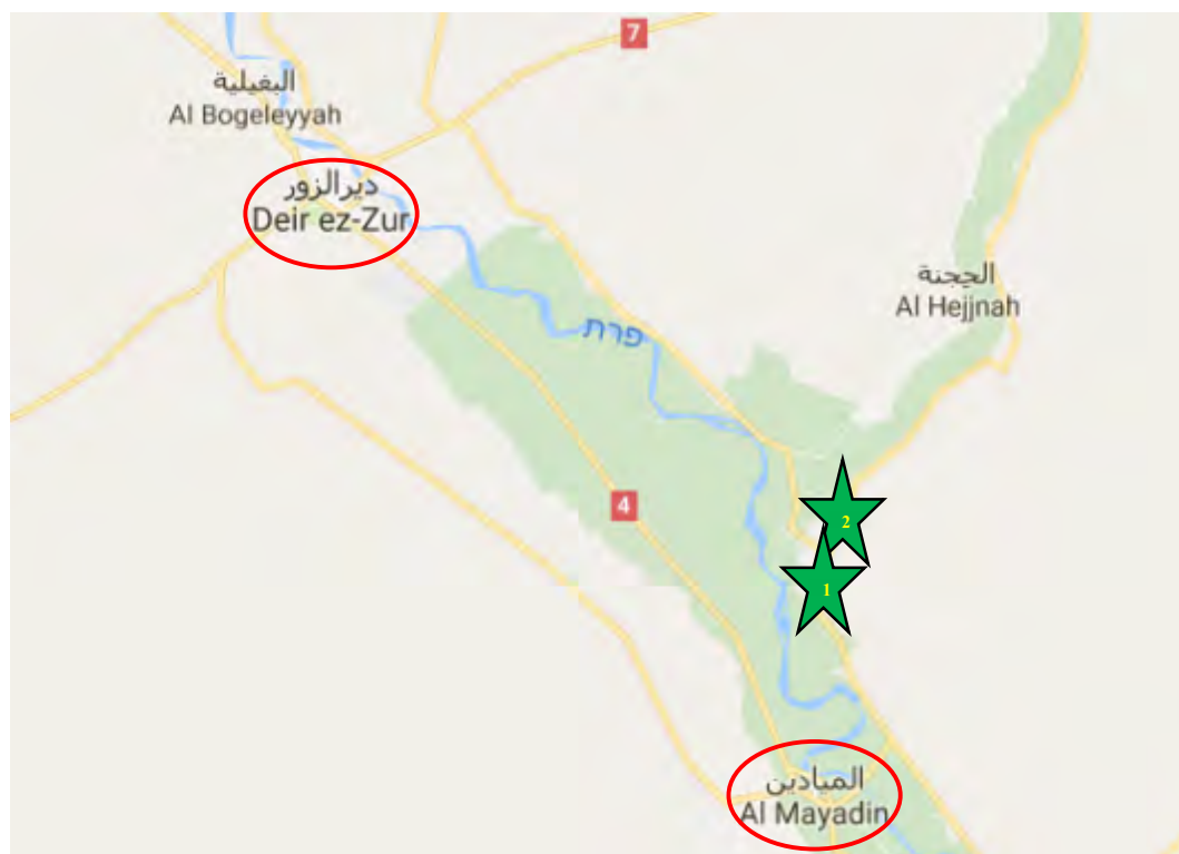
Champs de pétrole repris par les FDS sur la rive Est de l'Euphrate : le champ d'Omar au Sud (1) et le champ d'Omar au Nord (2)

fleuve Khabour. Ces champs de pétrole représentaient une importante source de revenus pour l'Etat islamique. 1