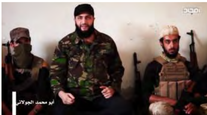
Abu Mohammad Al-Julani (centre) s'exprimant devant des membres du Siège de Libération d'Al-Shams. La date de la vidéo est inconnue (Compte Youtube Al-Sada/Vedeng News, 19 octobre 2017)

► D'après les Russes, Al-Julani a été grièvement blessé et a perdu sa main dans un bombardement russe le 3 octobre 2017. Dans les deux segments qui ont été montrés dans la vidéo, Al-Julani apparaît en bonne santé, déplaçant ses mains librement. Il semble donc que le Siège de Libération d'Al-Sham a publié la vidéo pour réfuter le rapport russe. Cependant, selon nous, la vidéo ne permet pas de réfuter le rapport russe, puisque les propos d'Al-Julani ne peuvent être datés . Nous estimons que les segments où Al-Julani parle d'affrontements avec l'armée syrienne qui auraient eu lieu le 6 octobre 2017 auraient été ajoutés pour donner l'impression que les propos d'Al-Julani sont actuels, soit trois jours après le bombardement russe.