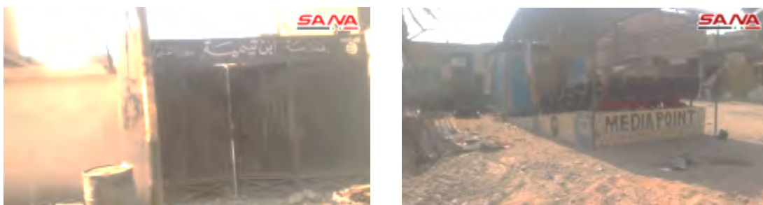
Droite : Point de presse de l'Etat islamique qui comprend des sièges et un écran où des vidéos de propagande étaient diffusées aux résidents. Gauche : Ecole Ibn Taymiyyah du bureau d'éducation de l'Etat islamique

► Les membres de l'Etat islamique continuent de s'accrocher à plusieurs quartiers de Deir ez-Zor. Cette semaine, il a été rapporté que des affrontements ont continué, principalement dans la région à l'Est de la ville. Il y avait aussi des affrontements entre les forces syriennes et l'Etat islamique sur la rive Est de l'Euphrate, près de l'aérodrome militaire de Deir Ez-zor (Observatoire syrien des droits de l'homme, 21-23 octobre 2017).