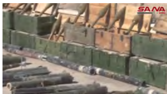
Droite : Roquettes antichars. Gauche : Canons tractés