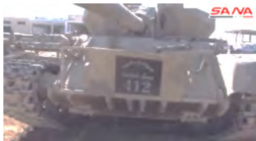
Droite : Tank de l'Etat islamique portant l'inscription "État islamique, l'Armée du califat 412". Gauche : Véhicule blindé fabriqué par l'Etat islamique