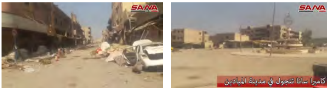
Photos de la vidéo : Droite : Place de la ville d'Al-Mayadeen. Gauche : Destruction partielle d'une des rues d'Al-Mayadeen (Compte Youtube Sana, 21 octobre 2017)

de l'Etat islamique , dont la place centrale de la ville, l'école Ibn Taymiyyah, qui opère sous l'égide du bureau international d'éducation de l'Etat islamique (Diwan Al-Ta'lim), le principal marché, un "point de presse", qui comprend des places assises et un écran où des vidéos de propagande de l'Etat islamique ont probablement été projetées au public (Compte Youtube Sana, 21 octobre 2017). La vidéo donne l'impression que, par rapport à d'autres villes de Syrie qui ont été reprises des mains de l'Etat islamique, les dommages causés à Al-Mayadeen sont relativement mineurs, ce probablement en raison de la courte durée des combats qui ont eu lieu jusqu'à ce que la ville soit reprise.