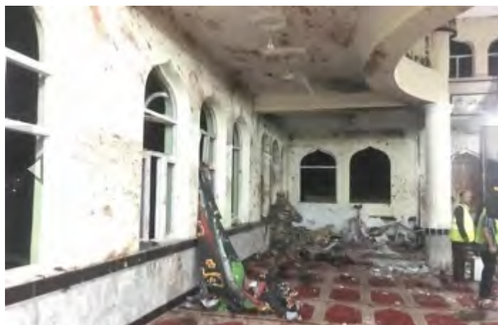
Destruction de la mosquée chiite Imam Zaman à Kaboul après l'explosion d'une ceinture piégée d'un terroriste de l'Etat islamique (Afghanistan Times, 21 octobre 2017)

réclamation de responsabilité, mais il a été rapporté dans les médias que l'attaque a été effectuée par un membre de l'Etat islamique appelé Abu Ammar al-Turkmani (Thinkprogress.org, 21 octobre 2017).