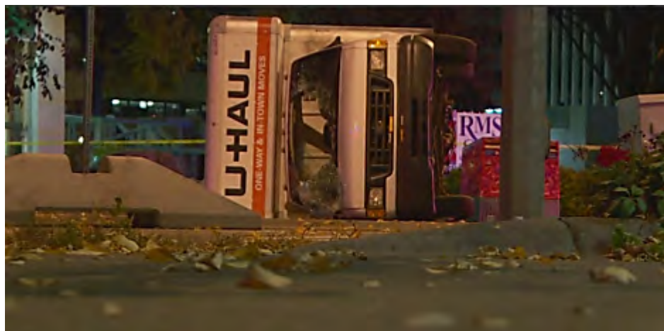
La camionnette utilisée pour effectuer l'attaque

annoncé que l'incident était considéré comme une attaque terroriste menée par un "loup solitaire". L'Etat islamique n'a jusqu'à présent pas revendiqué l'attaque.