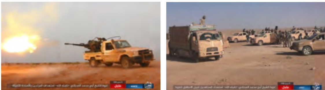
Droite : Membres de l'Etat islamique préparant le raid en mémoire du cheikh Abu Mohammad al-Adnani. Gauche : Membres de l'organisation tirant d'un canon anti-aérien monté sur un véhicule tout terrain pendant le raid (Haqq, 30 septembre 2017)

► Le commandant des forces syriennes Suheil Hassan a annoncé l'échec de l'attaque de grande envergure en mémoire d'Abu Mohammad al-Adnani :