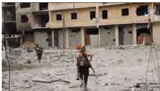
Gauche : Membres de l'Etat islamique dans le Centre d'Al-Raqqah. Droite : Membres de l'Etat islamique avec des armes légères, l'un d'entre eux transportant un RPG, dans le Centre d'Al-Raqqah (Al-Sawarim, 28 septembre 2017)