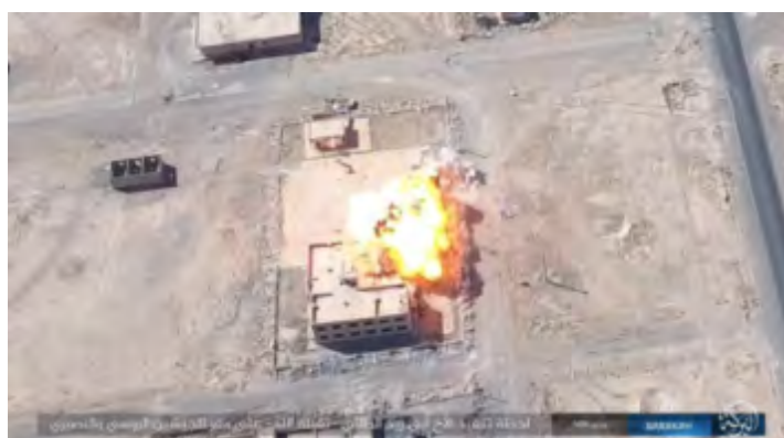
Le moment de l'explosion de la voiture piégée (Haqq, 30 septembre 2017)