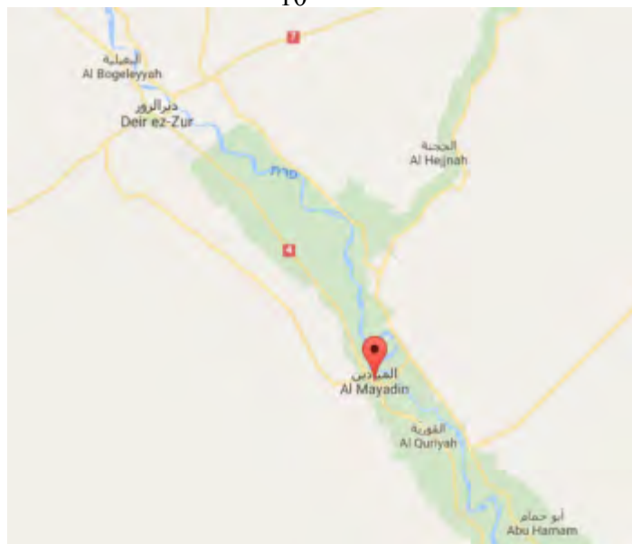
La ville d'Al-Mayadeen sur l'Euphrate, qui est dans la ligne de mire des forces syriennes