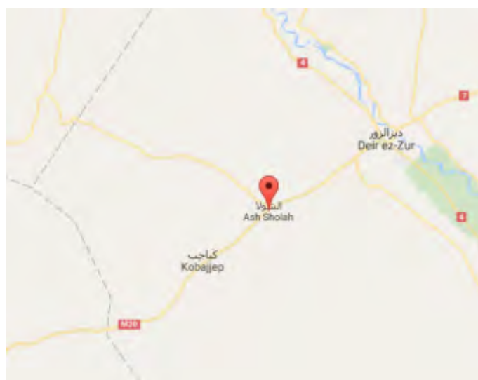
Le village d'Al-Shula, sur la route menant à Deir ez-Zor. Des affrontements entre l'Etat islamique et les forces syriennes ont eu lieu près de ce village

► Les 28 et 29 septembre 2017, des membres de l'Etat islamique ont attaqué des convois syriens sur la route entre Al-Sukhnah et Deir Ez-Zor , ainsi que des avant-postes de l'armée syrienne dans le secteur d'Al-Sukhnah afin de couper cette route logistique vitale. En conséquence, des dizaines de soldats de l'armée syrienne et des civils ont été tués (Al-Aan Dimashq, 30 septembre 2017). Les forces syriennes ont mis fin à cette tentative. Des photos prises par les forces syriennes montrent des corps de membres de l'organisation tués lors d'affrontements dans la région du village d'Al-Shula, à environ 30 km au Sud-Ouest de Deir Ez-Zor (Butulat Al-Jaysh Al-Suri, site Internet affilié à l'armée syrienne, 30 septembre 2017).