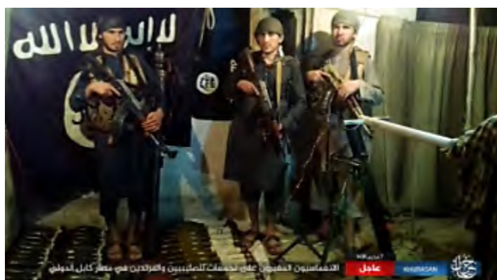
Les trois membres de l'Etat islamique et les armes utilisées dans l'attaque de l'aéroport international de Kaboul (Haqq, 28 septembre 2017)

► Le 27 septembre 2017, trois membres de l'Etat islamique ont procédé à un attentat suicide à l'aéroport international de Kaboul. L'organisation a fait valoir que l'attaque a été menée pendant la visite du secrétaire américain à la Défense, James Mattis. Les médias américains (CNN et Reuters) ont rapporté que l'attaque a été réalisée quelques heures après que le secrétaire américain à la défense Mattis a atterri à Kaboul (Reuters, 27 septembre 2017).