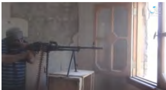
Droite : Membres de l'Etat islamique tirant sur les forces des FDS dans un quartier du Centre d'Al-Raqqah. Gauche : Avant-poste des FDS dans le Centre d'Al-Raqqah touché par des tirs de l'Etat islamique (Al-Sawarim, 28 septembre 2017)