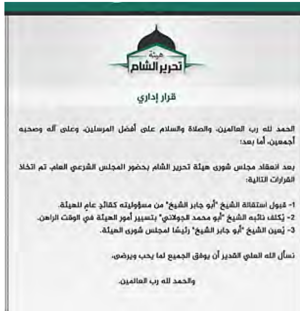
L'annonce de la restructuration du Siège de Libération d'Al-Sham (Twitter, 1 er octobre 2017)