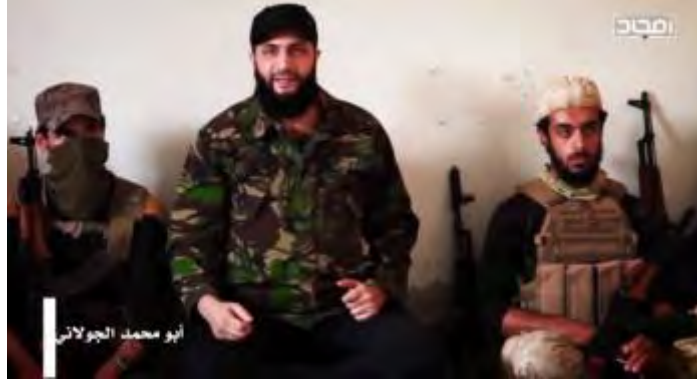
أبو محمد الجولاني (في الوسط) يلقي كلمة أمام عناصر هيئة تحرير الشام. تاريخ تصوير هذا المقطع من الشريط غير معروف (حساب يوتيوب الصدى / Vedeng News، 19 تشرين الأول/أكتوبر 2017).

◀ زعم الروس أن الجولاني قد أصيب إصابة بالغة وفقد يده جراء غارة قامت بها طائرات سورية في 3 تشرين الأول/أكتوبر 2017. وفي مقطعين تم دمجهما في الشريط يظهر الجولاني وهو معافى ويحرك يده بحرية. إذن فمن الواضح أن هيئة تحرير الشام قد نشرت هذا الشريط لدحض الأنباء الروسية وللتذكير بأن "كل شيء على ما يرام". ومع ذلك نحن نعتقد أن الشريط لا يدحض الأنباء الروسية، حيث لا يتضح لنا متى صدرت أقوال الجولاني. يبدو لنا أنه أثناء إعداد الشريط "ألصقت" مقاطع تحدث فيها الجولاني عن الاشتباكات التي تمت مع الجيش السوري في 6 تشرين الأول/أكتوبر 2017 وذلك لخلق انطباع بان أقوال الجولاني صدرت في أوقات متزامنة، أي بعد ثلاثة أيام من الغارة الروسية.