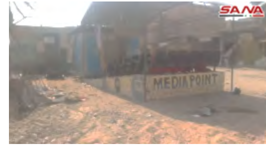
على اليمين: "موقع إعلامي" لتنظيم الدولة الإسلامية وفيه مقاعد وشاشة كانت تُعرض عليها أفلام دعائية للسكان. على اليسار: مدرسة ابن تيمية التابعة لديوان التعليم في تنظيم الدولة الإسلامية (حساب يوتيوب سانا، 21 تشرين الأول/أكتوبر 2017).

عناصر تنظيم الدولة الإسلامية يواصلون التمسك ببعض الأحياء في دير الزور. وأفادت التقارير هذا الأسبوع عن تواصل الاشتباكات وخاصة في المحيط الشرقي للمدينة. كما ودارت مواجهات بين القوات السورية وبين تنظيم الدولة الإسلامية على الضفة الشرقية لنهر الفرات مقابل مطار دير الزور العسكري (المرصد السوري لحقوق الإنسان، 21، 23 تشرين الأول/أكتوبر 2017).