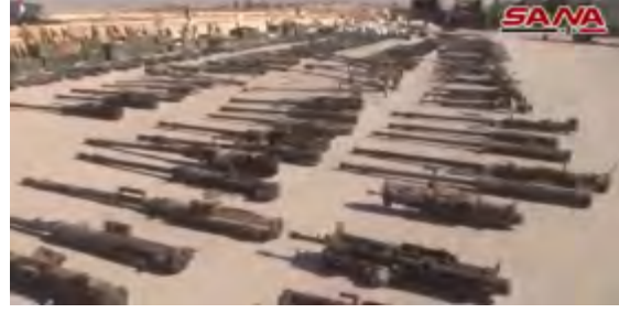
على اليمين: مدافع مضادة للطائرات في مخازن تنظيم الدولة الإسلامية. على اليسار: صواريخ مضادة للدبابات (حساب يوتيوب سانا، 19 تشرين الأول/ أكتوبر 2017).