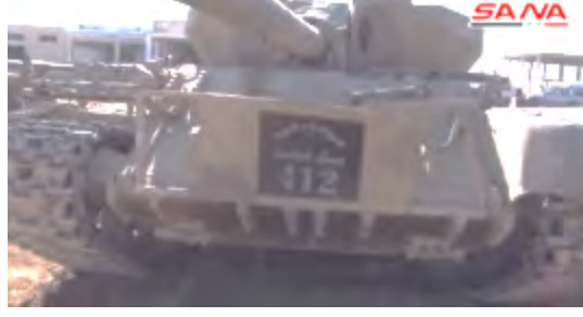
على اليمين: دبابة من دبابات تنظيم الدولة الإسلامية كُتب عليها "الدولة الإسلامية، جيش الخلافة 412". على اليسار: سيارة ملغمة ومصفحة من صناعة تنظيم الدولة الإسلامية.