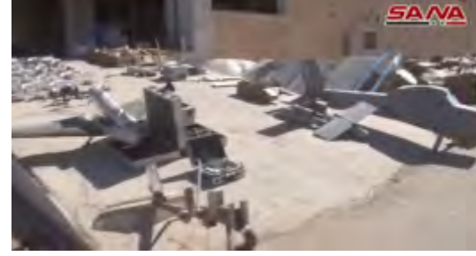
طائرات صغيرة بدون طيار وطائرات مسيرة لتنظيم الدولة الإسلامية ضبطها الجيش السوري في الميادين (حساب يوتيوب سانا، 19 تشرين الأول/ أكتوبر 2017).