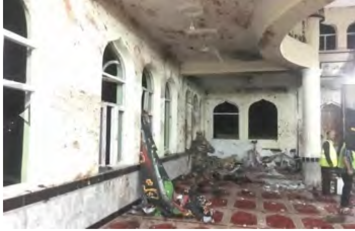
الدمار في مسجد إمام زمان الشيعي في كابل جراء تفجير الحزام الناسف الذي كان يرتديه الإرهابي الاتحاري التابع لتنظيم الدولة الإسلامية (أفغانستان تايمز ، 21 تشرين الأول/ أكتوبر 2017).