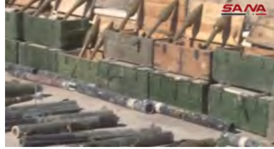
على اليمين: صواريخ مضادة للدبابات. على اليسار: مدافع مجرورة (حساب يوتيوب سانا، 19 تشرين الأول/ أكتوبر 2017).