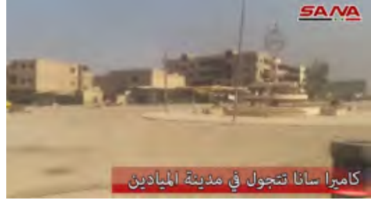
صور من الشريط. على اليمين: ميدان مدينة الميادين. على اليسار: دمار جزئي في أحد شوارع الميادين.