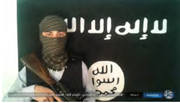
الإرهابي الانتحاري الذي نفذ العملية على مدخل الأكاديمية العسكرية في كابل (حق، 22 تشرين الأول/ أكتوبر 2017).