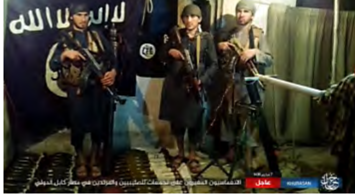
عناصر تنظيم الدولة الإسلامية الثلاثة والأسلحة التي استخدموها في هجوم المطار الدولي في كابل (حق، 28 أيلول/ سبتمبر 2017).

في 27 أيلول/ سبتمبر 2017 قام ثلاثة عناصر من تنظيم الدولة الإسلامية بعملية انتحارية في مطار كابل الدولي. وزعم تنظيم الدولة الإسلامية أن العملية تمت أثناء زيارة قام بها وزير الدفاع الأمريكي جيمس ماتيس. وأفادت وسائل الإعلام الأمريكية (CNN) ووكالة رويترز ان العملية تمت بعد ساعات من هبوط وزير الدفاع ماتيس في كابل (رويترز، 27 أيلول/ سبتمبر 2017).