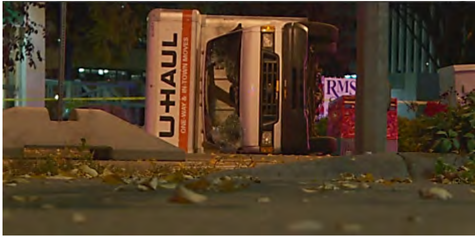
السيارة التجارية التي استخدمت لتنفيذ عملية الدهس بعد انقلابها (صفحة تويتر ZoeHTodd ، 1 تشرين أول/ أكتوبر 2017).