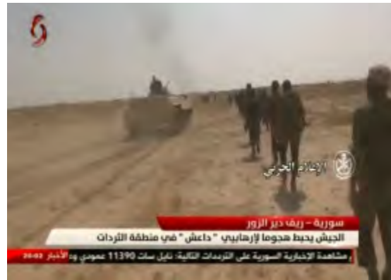
جنود وعربة مصفحة للجيش السوري أثناء الاشتباكات مع تنظيم الدولة الإسلامية في منطقة الثرثرات (حساب يوتيوب syriaalikhbaria2، 30 أيلول/ سبتمبر 2017).