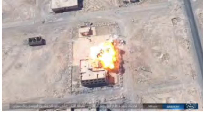
لحظة تفجير السيارة الملغمة (حق، 30 أيلول/ سبتمبر 2017).