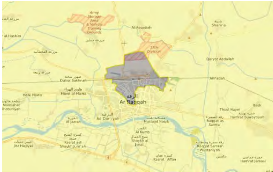
"المربع الأمني" لتنظيم الدولة الإسلامية في مركز مدينة الرقة (أورينت نيوز، 1 أيلول/ سبتمبر 2017).