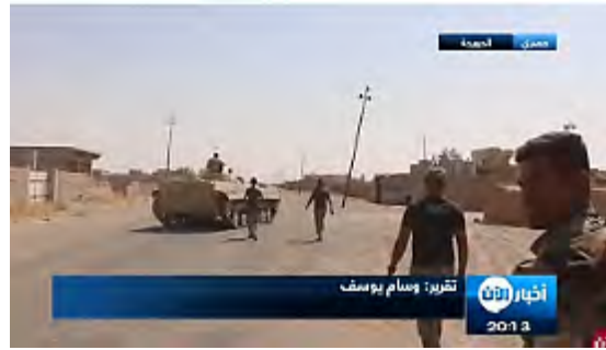
على اليمين: قوات الأمن العراقية في الحويجة (قناة الآن، 24 أيلول/ سبتمبر 2017). على اليسار: القوات العراقية تتقدم في منطقة الزوية والنمل (قناة الرافيدين، 24 أيلول/ سبتمبر 2017).