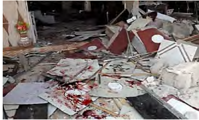
مسرح العملية في المطعم في مدينة ببجي (العراق نت، 19 أيلول/ سبتمبر 2017).