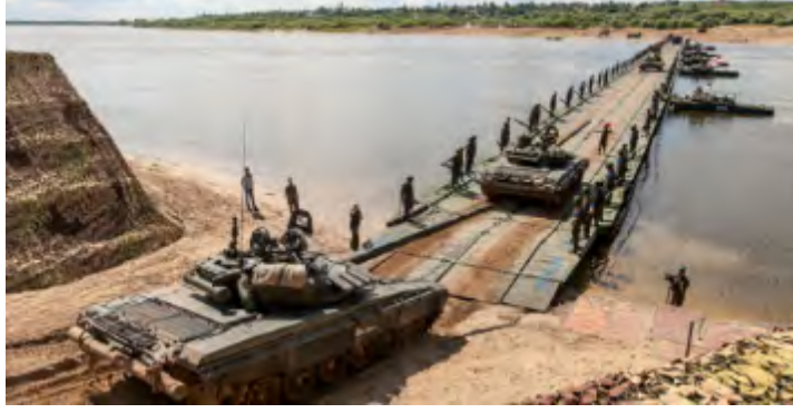
رتل من مصفحات الجيش السوري يجتاز نهر الفرات من الضفة الغربية إلى الضفة الشرقية على الجسر العائم (Syria-Victory، 24 أيلول/ سبتمبر 2017).

◀ وبالمقابل سيطرت قوات سوريا الديمقراطية (SDF) على حقل كونكو للغاز على الضفة الشرقية لنهر الفرات (انظر الخارطة) وعلى المصنع المحاذي له (الدرر الشامية، 22 أيلول/ سبتمبر 2017; سوريا نت، 24 أيلول/ سبتمبر 2017). وهذا هو أكبر حقول الغاز في سوريا والذي كان خاضعاً حتى الآن لسيطرة تنظيم الدولة الإسلامية 2 . كما وسيطرت القوات على حقل العزبة للغاز (Al 'Izbah) المحاذي له (المرصد السوري لمتابعة حقوق الإنسان، 23 أيلول/ سبتمبر 2017). وبالإضافة لذلك قامت قوات التحالف الدولي بعملية إنزال قوات في منطقة حقل كونكو للنفط، حيث تم خلال هذه العملية اعتقال قائد بارز في تنظيم الدولة الإسلامية يُدعى همام تركي الرضمان (خطوة، 20 أيلول/ سبتمبر 2017).