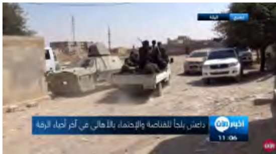
مقاتلو قوات سوريا الديمقراطية (SDF) في أحد الأحياء التي احتلها في مدينة الرقة (قناة الآن، 23 أيلول/ سبتمبر 2017)