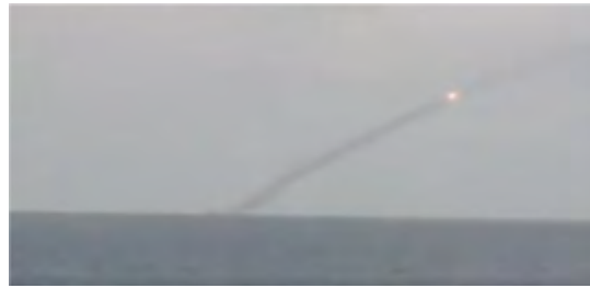
إطلاق الصواريخ المجهزة من نوع "كليب" وإصابة مواقع جبهة فتح الشام (صفحة فيسبوك وزارة الدفاع الروسية، 22 أيلول/ سبتمبر 2017).