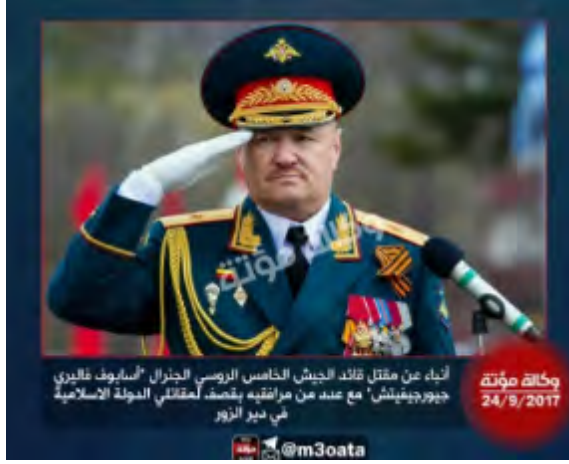
الفريق فاليري أسابوف (Valery Asapov) الذي قُتل في دير الزور حساب +Google أخبار الحرب العالمية / Wold War News 24 أيلول/ سبتمبر 2017).