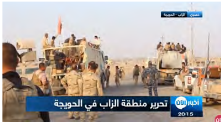
قوات الجيش العراقي في منطقة الزاب (قناة الآن، 25 أيلول/ سبتمبر 2017).