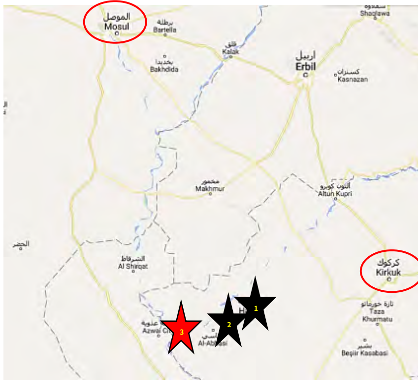
تنظيف مقاطعة تنظيم الدولة الإسلامية في محيط الحويجة؛ تظهر في الخارطة مدينة الحويجة (1)، النمل (2)، الزاب (3) (Google Maps)