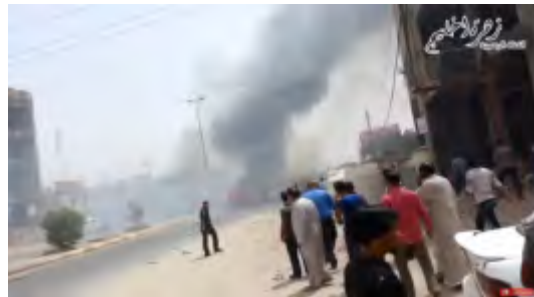
Справа: ресторан, в котором произошел теракт ("Захарат аль-Халидж, 14 сентября 2017 года). Слева: место теракта на блокпосте иракских служб безопасности ("Аль-Арабия", 14 сентября 2017 года).