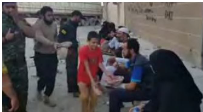
Бойцы подразделений SDF возле женщин, детей и раненых после того, как ИГ использовал их в качестве живого щита (микро-блог Twitter سوريا الجبهة من QSD_Jabha قوات 14 сентября 2017 года).