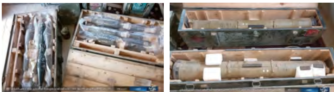
Справа: две противотанковые ракеты армии Сирии, захваченные боевиками ИГ в деревне Абу аль-Табабир. Слева: противотанковые ракеты армии Сирии, захваченные боевиками ИГ ("Ахбар аль-Мусламин", 17 сентября 2017 года).

► Сирийские войска занимались в течение последней недели зачисткой сельских районов к востоку от Хомса и Хамы. Целью зачистки было завершение выдворения боевиков "Исламского государства" из нескольких еще контролируемых ими районов . Судя по всему, сирийским войскам удалось осуществить свою задачу, несмотря на отдельные локальные очаги сопротивления боевиков ИГ. Так, например, ИГ удалось снова захватить деревню Абу аль-Табабир к востоку от Хомса, нанеся сирийским подразделениям урон в результате подрыва террористом-самоубийцей заминированного автомобиля . "Исламское государство" утверждает, что в результате теракта погибли не менее 22 сирийских военных, и что организации удалось захватить значительное количество оружия.