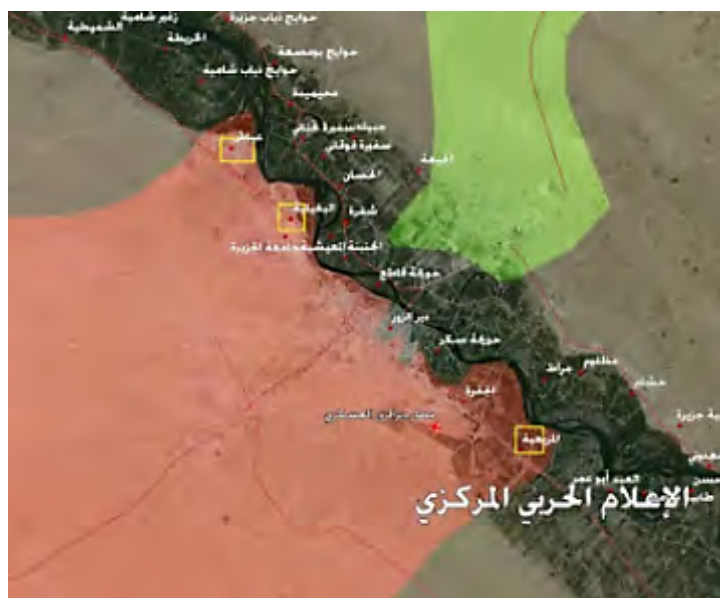
Карта района Дир аз-Зура с распределением зон контроля: зеленым обозначены территории, контролируемые силами SDF; красным обозначены территории, контролируемые сирийской армией. Желтыми квадратиками обозначены территории, которые сирийская армия захватила недавно; черным обозначены территории вдоль реки Евфрат, контролируемые ИГ (канал Youtube управления боевой пропаганды сирийской армии, 16 сентября 2017 года).