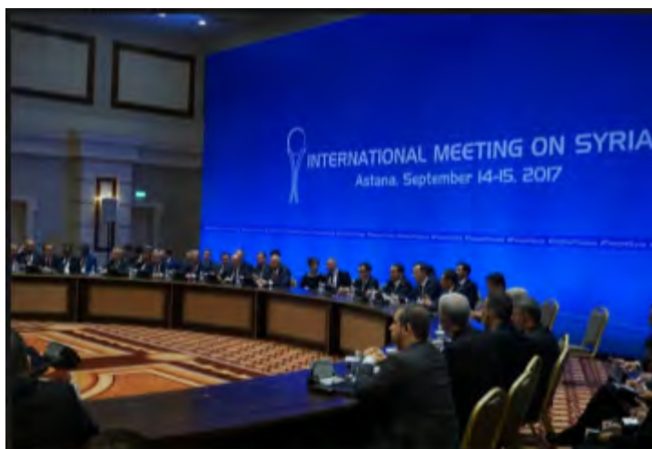
Переговоры в Астане с участием представителей России, Турции и Ирана (страница посольства России в Казахстане в социальной сети Facebook, 15 сентября 2017 года)