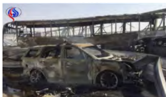
Справа: место теракта на блокпосте иракских служб безопасности ("Аль-Алам", 14 сентября 2017 года). Слева: эвакуация раненых с места теракта (Youtube, 14 сентября 2017).

► Ответственность за теракт взяло на себя "Исламское государство" В заявлении с принятием ответственности говорится, что боевики ИГ с поясами смертников атаковали три шиитских объекта в Насирии и ее окрестностях. Кроме того, согласно заявлению, днем ранее боевики "Исламского государства" устроили засаду против членов "Народного ополчения" (рамочная структура шиитских милиций, поддерживаемых Ираном) возле города Эль-Мусайиб в шиитском районе Ирака. В заявлении ИГ говорится, что в результате этих атак были убиты и ранены более 200 шиитов ("Ахбар аль-Мусламин", 14 сентября 2017 года).