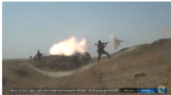
Справа: боевики ИГ во время нападения на позицию "Народного ополчения". Слева: сожжение блокпоста ("Ахбар аль-Мусламин", 12 сентября 2017 года).