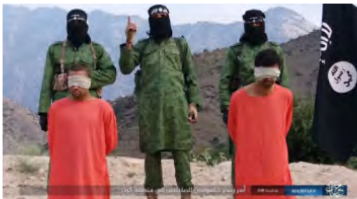
Боевики ИГ стоят за спинами двух людей, обезглавленных в афганском городе Кунар ("Ахбар аль-Мусламин", 13 сентября 2017 года).