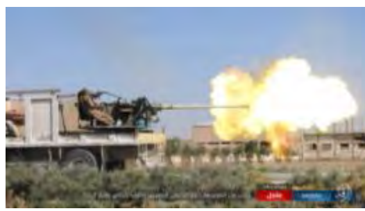
Справа: боевик организации ИГИЛ ведет огонь в направлении сил сирийской армии ("ахбар аль муслемин", 25 августа 2017 г.). Слева: боевик организации ИГИЛ поднимает флаг организации над одной из позиций, которые были отбиты у сирийской армии ("ахбар аль муслемин", 25 августа 2017 г.)