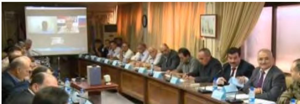
Встреча для достижения примирения, состоявшаяся в провинции Дерра (интернет-сайт газеты "Красная звезда", 26 августа 2017 г.)