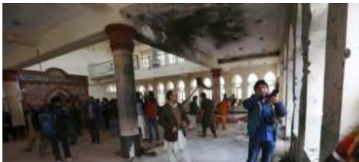
Шиитская мечеть Имам Заман в Кабуле, в которой террористами организации ИГИЛ был совершен самоубийственный теракт (газета "Афганистан Таймс", 27 августа 2017 г.)