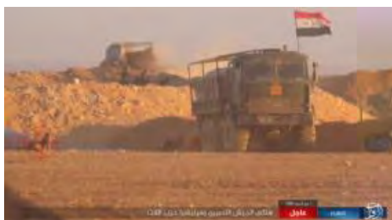
Справа: брошенный грузовик сирийской армии возле одной из позиций в Вади Аль Ваар. Слева: покинутая позиция сирийской армии в Вади Аль Ваар ("ахбар аль муслемин", 24 августа 2017 г.)