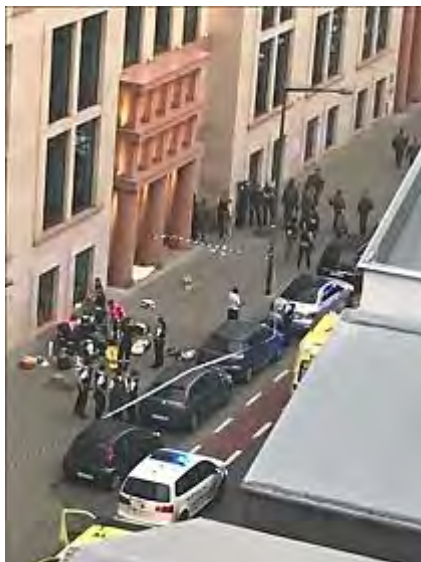
Место совершения теракта с применением холодного оружия в Брюсселе (страница Твиттер Томаса Да Сильва Розе, 25 августа 2017 г.)