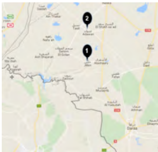
Села Джалин (1) и Адуан (2), расположенные в зоне контроля группировки "Армия Халеда Бин Аль Валида" в долине Ярмук

Валида", находящихся в селах Джалин и Адуан (см. карту). В другом заявлении, поступившем из агентства новостей "Аамак", принадлежащего организации ИГИЛ, сообщалось, что в результате столкновений силы повстанцев потеряли 19 человек убитыми, а также были повреждены 2 принадлежащих им танка (аккаунт Твиттер @7wdnnhb , 28 августа 2017 г.).