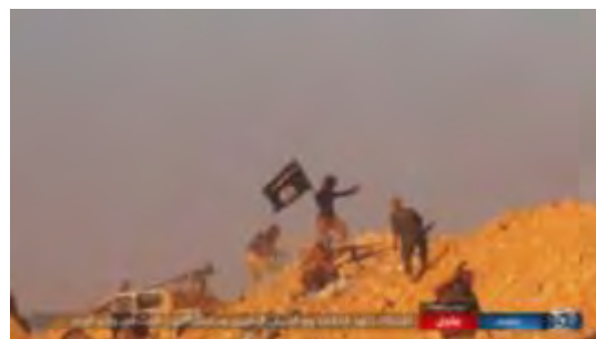
Справа: боевики организации ИГИЛ ведут огонь в направлении позиций сирийской армии и боевиков организации "Хезболлах" в Вади Аль Ваар. Слева: передвижная ракетная пусковая установка, установленная на грузовике (система БМ-21 Град) на одной из покинутых позиций сирийской армии в Вади Аль Ваар ("ахбар аль муслемин", 24 августа 2017 г.)