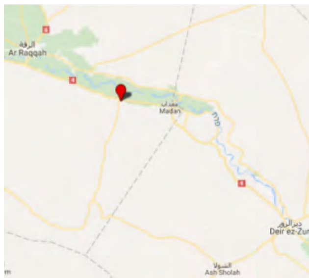
Район нападения боевиков организации ИГИЛ на подразделение сирийской армии, неподалеку от деревни Анем Аль Али (Google Maps)

которым он воспользовался для совершения теракта ("ахбар аль муслемин", 25 августа 2017 г.).