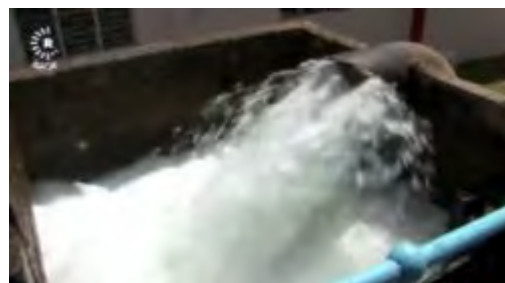
Справа: поток пресной воды на восстановленной водонапорной станции. Слева: насосы и трубы на восстановленной водонапорной станции