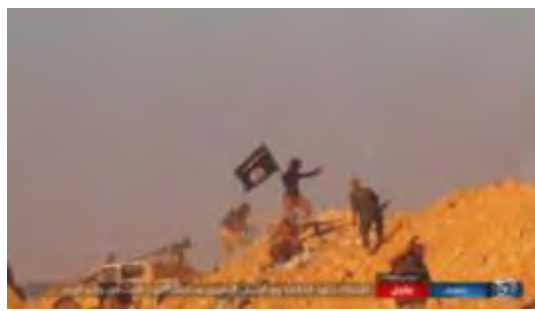
Droite : Combattants de l'Etat islamique tirant sur l'armée syrienne et les forces du Hezbollah dans la région de Wadi Al-Wa'er. Gauche : Fusée montée sur un chariot (BM-21 Grad) à l'une des positions abandonnées de l'armée syrienne à Wadi Al-Wa'er