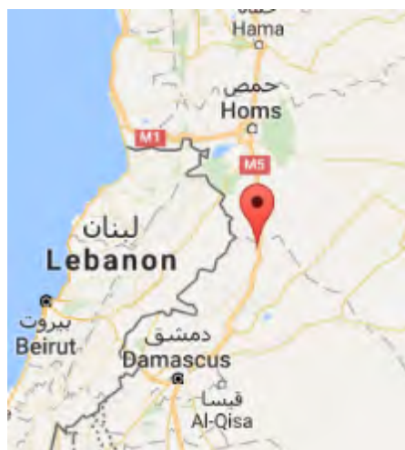
Le Mont Halima Qarah, où le Hezbollah a organisé son "défilé de victoire" après le transfert des membres de l'Etat islamique