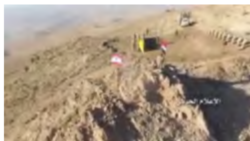
Droite : Défilé du Hezbollah sur le Mont Halima Qarah à l'Ouest de Qalamoun. Les combattants du Hezbollah arborent les drapeaux du Hezbollah, de la Syrie et du Liban (Compte Twitter, 28 août 2017). Gauche : Partie du convoi de transport des membres de l'Etat islamique et de leurs familles des monts de Qarah à l'Ouest de Qalamoun (Télévision syrienne, 28 juillet 2017)