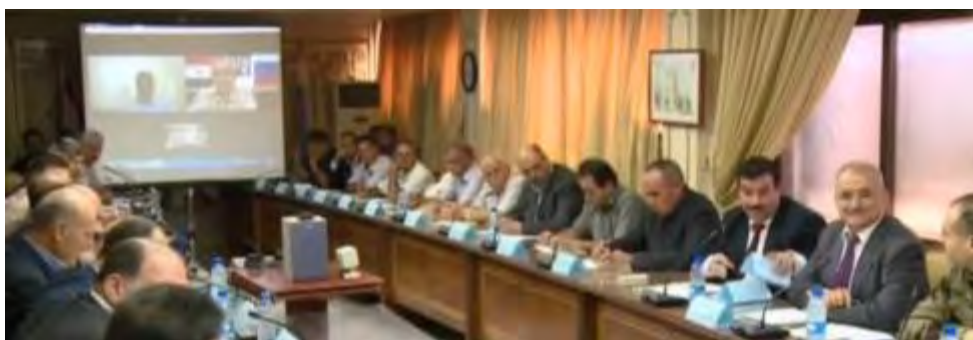
La réunion de promotion de la réconciliation qui a eu lieu à Darra (Site Internet de l'Etoile rouge, 26 août 2017).