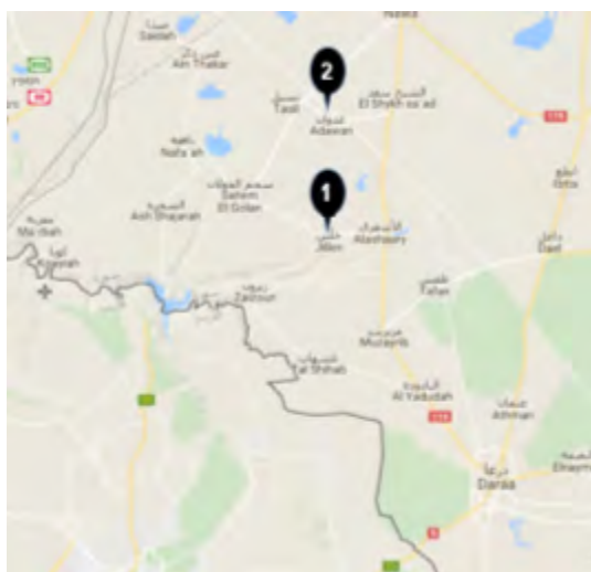
Les localités de Jillen (1) et Adawan (2) dans la zone contrôlée par l'Armée de Khalid bin Walid (Google Maps)

◀ Le 28 août 2017, l'Armée Khalid Bin Walid a annoncé que ses forces avaient été attaquées par des organisations rebelles . Selon le groupe, les forces rebelles ont tenté d'avancer vers ses positions dans les villes de Jillen et Adawan (voir carte). Dans une autre annonce, l'agence de presse Amaq de l'Etat islamique a annoncé que les forces rebelles ont subi 19 morts dans les affrontements et que deux de leurs chars ont été touchés (Twitter, 28 août 2017).