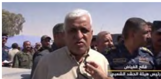
Faleh al-Fayyad, le chef de la "Mobilisation populaire" (Site Internet de la Mobilisation populaire, al-Hashed, 20 août 2017)

◀ Les médias irakiens couvrant la bataille de Tal Afar a souligné le rôle des milices chiites dans les combats ("Al Hashd Al-Shaabi", la Mobilisation populaire) exploités par l'Iran . Le 27 août 2017, Faleh Al-Fayyad, chef de la "Mobilisation populaire", a annoncé que l'Etat islamique a été défait à Tal Afar et que la Mobilisation populaire a joué un rôle majeur dans cette campagne (Site Internet de la Mobilisation populaire, al-Hashed, 20 août 2017). Selon le site de la "Mobilisation populaire", 16 divisions de l'organisation ont pris part à la bataille de Tal Afar .