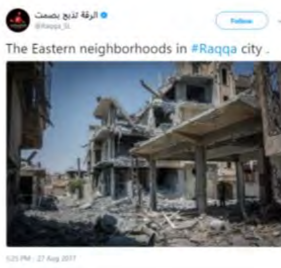
Zone habitée réduite en ruines dans l'un des quartiers de la partie orientale d'Al-Raqqah

◆ Les FDS ne prévoient pas d'avancer vers la région de Deir Ez-zor puisque l'ensemble de leurs ressources est consacrée à la lutte pour Al-Raqqah. Elle a ajouté que les FDS ont été appelés à libérer Deir Ez-zor et que ces demandes sont toujours en cours d'examen.