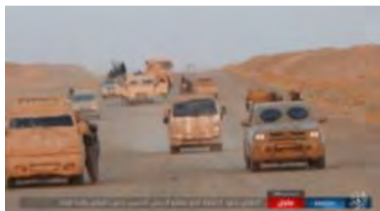
Droite : Véhicules de l'Etat islamique transportant des combattants en vue de combats contre les forces syriennes près du village de Ghanim al-A'li. Gauche : Tank de l'Etat islamique en route vers Ghanim al-A'li (Akhbar Al-Muslimeen, 25 août 2017)