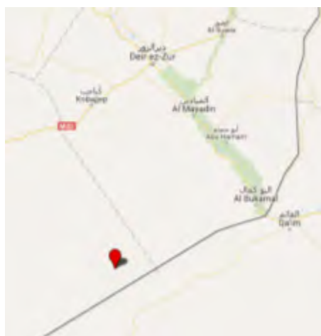
Droite : Le barrage d'Al-Wa'er (Google Maps). Gauche : L'Etat islamique prépare une attaque contre les positions de l'armée syrienne et le Hezbollah à Wadi Al-Wa'er (Akhbar Al-Muslimeen, 24 août 2017)