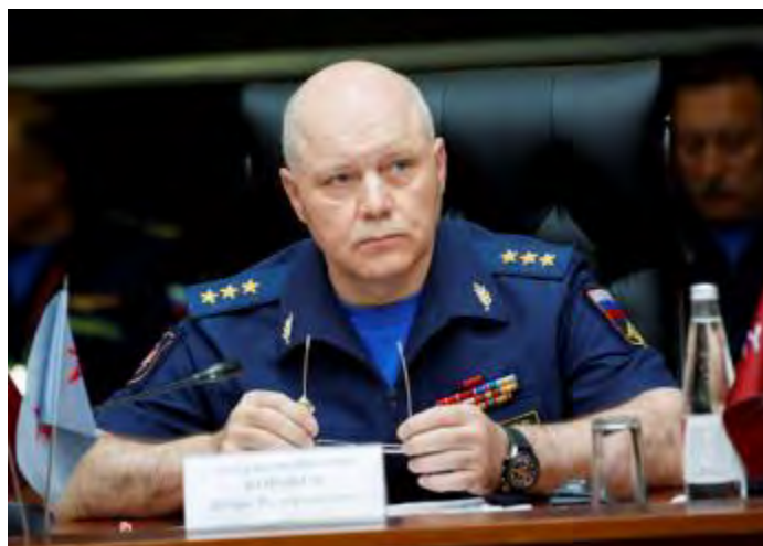
Igor Korobov, chef du renseignement de l'armée russe et vice chef d'état-major au "Forum militaire et technique 2017"