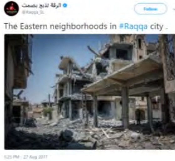
منطقة سكنية مدمرة في أحد أحياء شرق مدينة الرقة (حساب تويتر الرقة تذبج بصمت@Raqqqa_SL-27 Verified account).