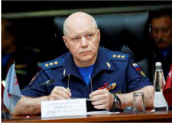
إيغور كوروبوف، رئيس هيئة الاستخبارات في الجيش الروسي ونائب رئيس هيئة الأركان العامة في "المنتدى الدولي العسكري والتقني 2017".

منهم". وعلى حد قوله فإن التنظيمات الإرهابية قادرة على تغيير تكتيك القتال بسرعة والانتقال من هجوم عصابات إلى هجوم مباشر والعكس" (تاس، 25 آب/ أغسطس 2017). ♦ وقال إيغور كوروبوف في تعليق آخر: "يبلغ عدد مقاتلي تنظيم الدولة الإسلامية في سوريا بتقديرنا أكثر من 9000 مقاتل. ويتواجدون حالياً بمعظمهم في وسط سوريا وفي المناطق الشرقية من العراق، وخاصة على امتداد نهر الفرات". وعلى حد قوله فإن زعماء الدولة الإسلامية يتخذون من سوريا منصة انطلاق للتغلغل في أنحاء الشرق الأوسط وفي مناطق أخرى في العالم (تاس، موقع وزارة الدفاع الروسية، 25 آب/ أغسطس 2017). وعلى حد قوله ينشط في سوريا حوالي 15000 إرهابي في صفوف جبهة النصرة، وبخلاف تنظيم الدولة الإسلامية فإن جبهة النصرة تسعى إلى قلب نظام الحكم وتأسيس دولة إسلامية في سوريا (موقع وزارة الدفاع الروسية، 25 آب/ أغسطس 2017).