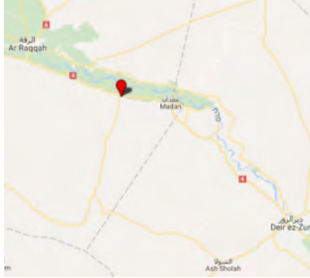
موقع الهجوم الذي شنه مقاتلو تنظيم الدولة الإسلامية على القوات السورية في محيط قرية غانم العلي (Google Maps).