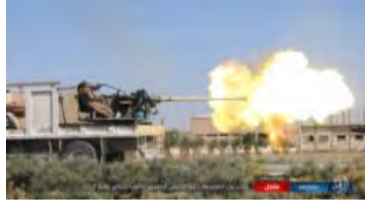
على اليمين: مقاتل من تنظيم الدولة الإسلامية يطلق النار على قوات الجيش السوري (أخبار المسلمين، 25 آب/ أغسطس 2017). على اليسار: مقاتل من تنظيم الدولة الإسلامية يرفع علم التنظيم على أحد المواقع التي تم احتلالها من الجيش السوري (أخبار المسلمين، 25 آب/ أغسطس 2017).