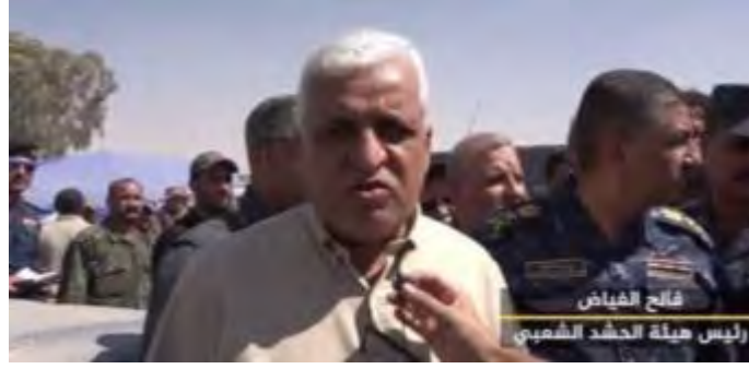
فالح الفياض (Faleh Al Fayyad)، رئيس هيئة "الحشد الشعبي" (موقع الحشد الشعبي al-hashed 20٠٠ آب/ أغسطس 2017).

◀ في 29 آب/ أغسطس 2017 أعلنت القيادة العامة لقوات البيشمركة (قوات كردستان العراق) أن مقاتليها قد قتلوا 130 من عناصر تنظيم الدولة الإسلامية في منطقة إلى الشمال من تلعفر. وقد هرب هؤلاء العناصر من قضاء تلعفر بعد سقوط المدينة وحاولوا الوصول على سوريا. واستمرت الاشتباكات بين الطرفين (البيشمركة وتنظيم الدولة الإسلامية) ثلاثة أيام (السومرية، 29 آب/ أغسطس 2017).