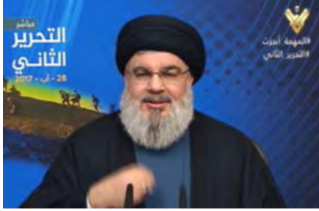
الأمين العام لحزب الله، حسن نصرالله، يلقي خطاب "التحرير الثاني" (المنار، 29 آب/ أغسطس 2017).