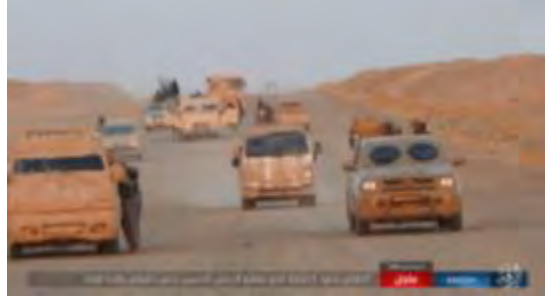
على اليمين: سيارات تنظيم الدولة الإسلامية وعليها مقاتلي التنظيم في طريقها إلى الهجوم على القوة السورية في محيط قرية غانم العلي. على اليسار: دبابة لتنظيم الدولة الإسلامية في طريقها إلى قرية غانم العلي (أخبار المسلمين، 25 آب/ أغسطس 2017).