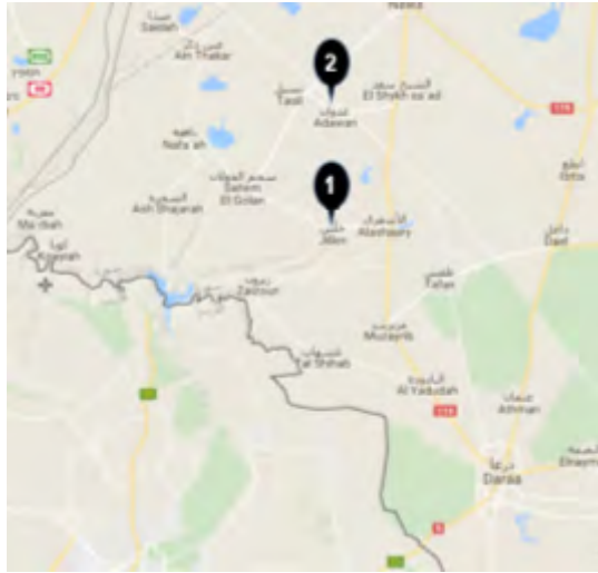
البلدتين جلين (1) وعدوان (2)، في المنطقة التي يسيطر عليها جيش خالد بن الوليد في حوض اليرموك.