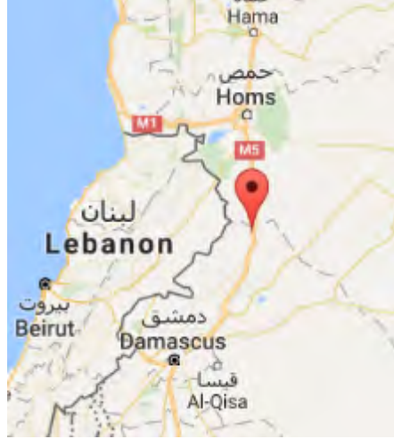
جبل حليمة قاره الذي أقام عليه حزب الله "موكب النصر" بعد طرد مقاتلي تنظيم الدولة الإسلامية.

قوات الأمن اللبنانية المخطوفين.