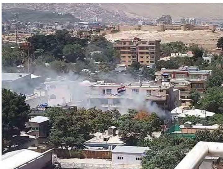
Взрыв в посольстве Ирака в Кабуле (интернет-сайт министерства внутренних дел Афганистана, 31 июля 2017 г.)

► 31-го июля 2017 г. был совершен теракт в посольстве Ирака, расположенном в центральном районе Кабула, столицы Афганистана, в квартале, в котором находится большинство иностранных посольств в Афганистане. Из министерства внутренних дел Афганистана сообщили, что в совершении теракта принимали участие 4 террориста. В начале один из них взорвал себя на входе в посольство, и таким образом проложил дорогу для остальных нападающих, которые ворвались на территорию комплекса посольства и открыли беспорядочный огонь во все стороны. Как следует из сообщения министерства внутренних дел, силы полиции окружили место совершения теракта и эвакуировали сотрудников посольства, которые не пострадали (интернет-сайт министерства внутренних дел Афганистана, 31 июля 2017 г.). Не ясно, сколько человек было убито и ранено в результате нападения.