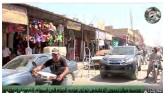
Возобновление функционирования рынков в квартале Мосул Аль Джадида (центр "Нинуа Аль Аалами", 6 августа 2017 г.)