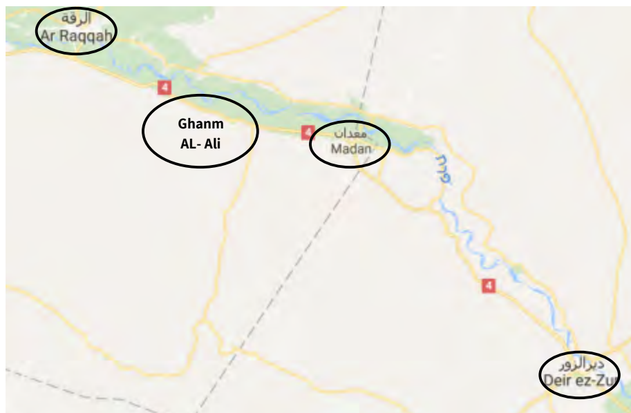
Села Анем Аль Аали и Мадан, находящиеся поблизости от шоссе № 4, проходящего по долине реки Евфрат и соединяющего города Эр Ракка и Дир Аль Зур

направлении восточной части села Анем Аль Аали, расположенного приблизительно в 37 км к юго-востоку от г. Эр Ракка (сирийский наблюдательный центр по защите прав человека, 5 августа 2017 г.). Значение села Анем Аль Аали заключается в его расположении на шоссе № 4, соединяющем города Эр Ракка и Дир Аль Зур.