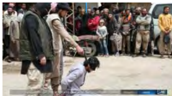
Справа: казнь "человека, отказавшегося от ислама". Слева: отсечение руки у человека, обвиняемого в краже ("ахбар аль муслемин", 5 августа 2017 г.)