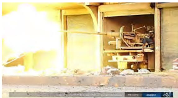
Боевые действия организации ИГИЛ против сил группировки SDF в г. Эр Ракка ("ахбар аль муслемин", 4 августа 2017 г.)