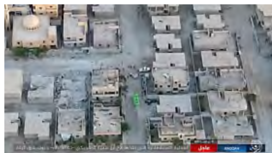
Взрыв заминированного грузовика организации ИГИЛ (обозначен зеленым цветом), за рулем которого сидел террорист-смертник, известный под прозвищем Абу Самия Таджик. Взрыв был произведен поблизости от скопления сил группировки SDF в юго-восточной части г. Эр Ракка ("ахбар аль муслемин", 3 августа 2017 г.)