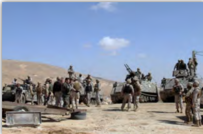
Силы ливанской армии готовятся к проведению операции по зачистке районов Рас Бааль Бек и Аль Каа (аккаунт Твиттер Almanarnews English@AlmanarEnglish , 6 августа 2017 г.)