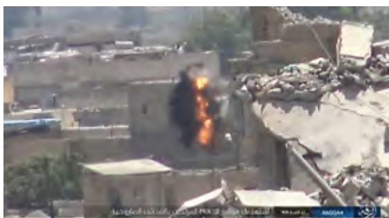
Попадания ракетных снарядов организации ИГИЛ, выпущенных в направлении позиций сил группировки SDF ("ахбар аль муслемин", 4 августа 2017 г.)