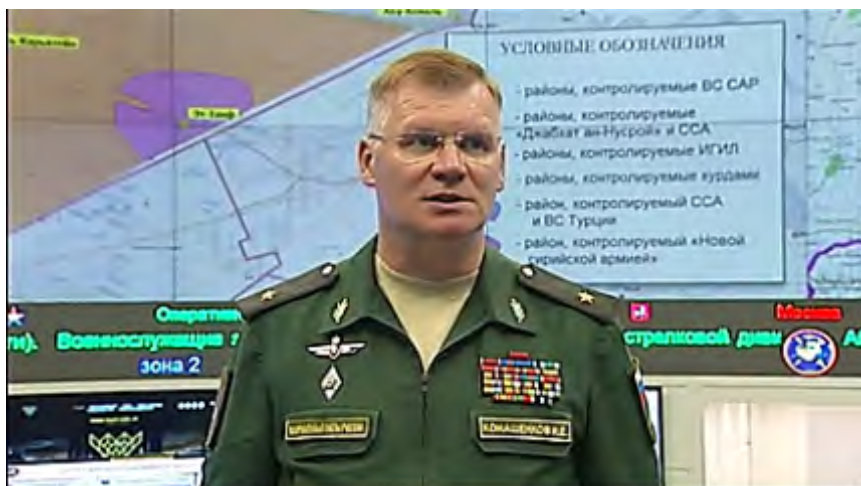
Официальный представитель министерства обороны России, Игорь Кошенков, в ходе пресс-конференции, на фоне карты, на которой размечены зоны контроля в Сирии (интернет-сайт министерства обороны России, 3 августа 2017 г.)

► В рамках выполнения соглашения силы российской военной полиции уже были развернуты вдоль линии соприкосновения, для того, чтобы создать зону отчуждения между сторонами. Были созданы 2 контрольных пункта на трассе между городами Хомс и Хама, а также 3 наблюдательных пункта. Этим силам поручено контролировать отсутствие контакта между сторонами, наблюдать за выполнением соглашения и обеспечивать регулярную доставку гуманитарной помощи для жителей этого района (интернет-сайт министерства обороны России, 3 августа 2017 г.). Поступило сообщение о том, что 15 представителей от повстанческих организаций, действующих в районе, расположенном к северу от г. Хомс, вскоре проведут встречу с представителями сил российской военной полиции, для того, чтобы обозначить на картах точные границы района, свободного от эскалации, который будет создан на основе принятого решения (газета "Заман Аль Васаль", 7 августа 2017 г.).