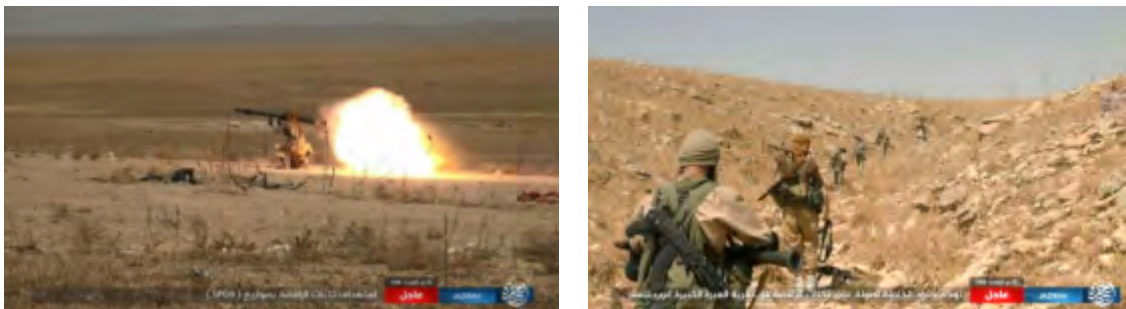
Съемки боевых действий организации ИГИЛ в районе г. Тель Афар (агентство новостей "Хек", 4 августа 2017 г.)