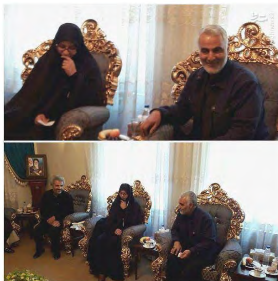
קאסם סלימאני נפגש עם משפחת מחסן חג'ג'י, שהוצא להורג ע"י דאעש (טוויטר, 20 באוגוסט 2017).

◀ בנאום לרגל "יום המסגד העולמי" בטהראן הגן קאסם סלימאני (Qasem Soleimani), מפקד כוח קדס של משמרות המהפכה, על מעורבותה האזורית של איראן. הוא ציין, כי נוכחות איראן בעיראק נועדה לסייע למערכה נגד דאעש ולא להשתלטות על שדות נפט או כיבוש ערים, כגון מוצול או כרכוכ. עוד אמר סלימאני, כי איראן אינה מסייעת לפלסטין בשל "אינטרסים שיעים" ולא תתמוך בפלסטינים, שיצהירו על עצמם שהם שיעים, מכיוון ש-99.99% מהפלסטינים הם סונים. הוא דחה את הביקורת מבית ומחוץ ביחס למעורבות איראן בסוריה ובעיראק ואמר, כי מעורבות זו, עליה החליט המנהיג העליון, נועדה להגן על אינטרסים איראנים (פארס, 20 באוגוסט 2017).