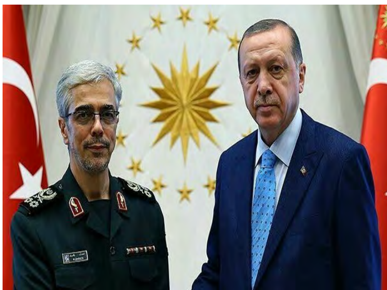
פגישת באקרי-ארדואן (פרדא ניוז, 16 באוגוסט 2017).

◀ מחמד באקרי (Mohammad Bagheri), ראש המטה הכללי של הכוחות המזוינים האיראנים, קיים במחצית אוגוסט ביקור חסר תקדים בן שלושה ימים בתורכיה. באקרי עמד בראש משלחת רמת דרג בה השתתפו, בין היתר, מפקד זרוע היבשה של משמרות המהפכה, מחמד פאכפור (Mohammad Pakpour), סגן הרמטכ"ל לענייני מודיעין, ע'לאם-רזא מחראבי (Gholam-Reza Mehrabi), מפקד משמר הגבול, קאסם רזא'י (Qasem Rezaei), וסגן שר החוץ אברההים רחים-פור (Ebrahim Rahimpour). במהלך הביקור נפגש באקרי עם בכירים מדיניים וצבאיים תורכיים, ובראשם הנשיא ארדואן, ודן עימם בהתפתחויות באזור, ובכלל זה בכוונת הכורדים בצפון עיראק לקיים משאל עם בנוגע לעצמאות החבל הכורדי, בשיתוף הפעולה הצבאי והביטחוני בין שתי המדינות ובהגברת התיאום בין המדינות בסוריה ובעיראק (אירנ"א, 15 באוגוסט 2017). בשיחה עם כתב סוכנות הידיעות אירנא (16 באוגוסט 2017) אמר באקרי, כי איראן ותורכיה שותפות בהתנגדותן למשאל העם בחבל כורדיסטאן. הוא ציין, כי משאל העם יוביל למתיחות ולעימותים בתוך עיראק, שישיעו גם על שכנותיה, ולפיכך איראן ותורכיה סבורות שאסור לקיימו.