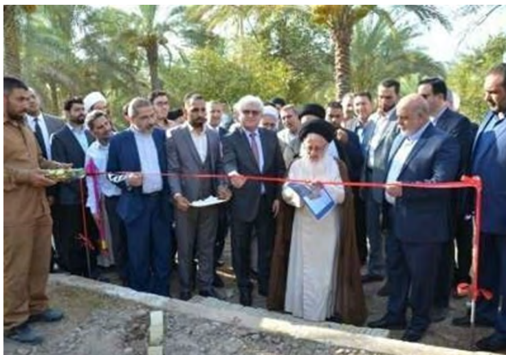
טקס הנחת אבן הפינה לאוניברסיטה האיראנית הראשונה בעיראק ( אירנ"א, 15 באוגוסט 2017).

◀ איראן החלה בהקמת אוניברסיטה איראנית ראשונה בעיראק. במחצית אוגוסט 2017 הונחה אבן הפינה לאוניברסיטת אלמצטפא אלמיין (al-Mustafa al-Amin) באזור כאט'מיין שמצפונית לבגדאד. טקס הנחת אבן הפינה נערך בהשתתפות נציג המנהיג העליון בעיראק, שגריר איראן בבגדאד וסגן שר המדעים והטכנולוגיה של עיראק. האוניברסיטה צפויה לכלול חמש פקולטות וילמדו בה כ-3,000 סטודנטים (אירנ"א, 15 באוגוסט 2017).