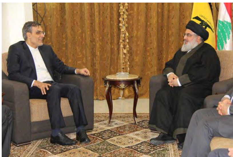
פגישת אנצארי-נצראללה (ח'בר אונליין, 22 באוגוסט 2017).