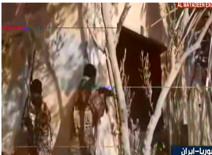
לוחמי משמרות המהפכה בקרב נגד דאעש (אל-מיאדין, 16 באוגוסט 2017).