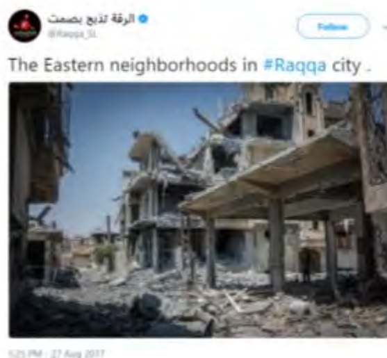
שטח בנוי שנהרס ברובו באחת השכונות, שבמזרח העיר אלרקה.