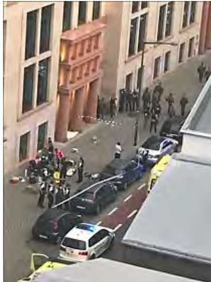
זירת פיגוע הדקירה בבריסל (עמוד הטוויטר של תומס דה סילבה רוזה, 25 באוגוסט 2017).

◀ דאעש קיבל אחריות על הפיגוע. ב-26 באוגוסט 2017 הודיע דאעש כי "מבצע פיגוע הדקירה בבריסל הינו חייל של המדינה האסלאמית , שביצע את הפיגוע מתוך היענות לקריאות לפגוע במדינות הקואליציה הבינלאומית" (חשבון הטוויטר @PieterNanninga , 26 באוגוסט 2017). נוסח הודעה זה מאפיין פיגועים שבוצעו בהשראת דאעש 6 .