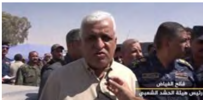
פאלח אלפיאצ' (Faleh Al Fayyad), ראש מטה "הגיוס העממי" (אתר הגיוס העממי 20, al-hashed, באוגוסט 2017).

◀ ב-29 באוגוסט 2017 הודיעה המפקדה הכללית של כוחות הפשמרגה (הכוחות של כורדיסטאן העיראקית), כי לוחמיהם הרגו 130 פעילי דאעש באזור שמצפון לתלעפר . פעילים אלו נמלטו מנפת תלעפר לאחר נפילת העיר וניסו להגיע לסוריה. ההתנגשויות בין הצדדים (הפשמרגה ודאעש) התנהלו במשך שלושה ימים (אלסומריה, 29 באוגוסט 2017).