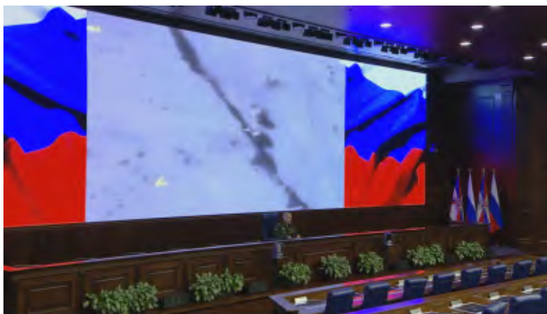
סרגיי רודסקוי במסיבת העיתונאים על רקע צילום של תקיפת שיירת דאעש ע"י מטוסים רוסיים (אתר משרד ההגנה הרוסי, 21 באוגוסט 2017)