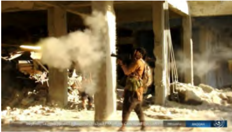
פעיל דאעש משגר רקטת R.P.G לעבר כוחות SDF בקרבת רחוב אלמנזור, שבמערב העיר העתיקה (אח'באר אלמסלמין, 19 באוגוסט 2017).