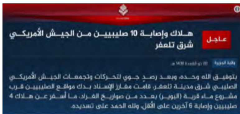
הודעת קבלת האחריות של דאעש (SITE, 13 באוגוסט 2017).

◀ כוחות הקואליציה הבינלאומית דיווחו, כי שני אמריקאים נהרגו וחמישה נפצעו בפעולות לחימה בצפון עיראק . דיווחים ראשוניים מצביעים על כך שמותם לא נגרם בעקבות מגע ישיר עם האויב. רוב מנינג, דובר הפנטגון , אמר, כי החיילים שנפגעו היו חלק מיחידת ארטילריה, שביצעה משימה נגד אתר מרגמות של דאעש. הוא מסר, שמותם נגרם כתוצאה מתאונה , ואין ממצאים המצביעים על כך שהיה לדאעש קשר לתקרית. הוא הוסיף, כי המקרה נמצא בחקירה (אתר משרד ההגנה האמריקאי, 13, 14 באוגוסט 2017). ◀ דאעש קיבל אחריות על האירוע . בהודעה שפרסם, טען, הארגון כי הרג ופצע עשרה חיילים אמריקאים באמצעות ירי רקטות מסוג גראד סמוך לכפר אלבוואר (al-Buwayr) מזרחית לתלעפר (site, 13 באוגוסט 2017).