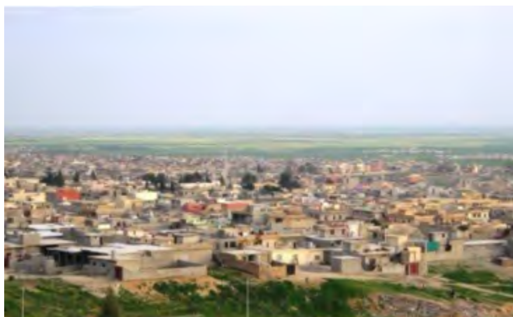
צילום של העיר תלעפר (אלע'ד, תמונת ארכיון, 31 באוקטובר 2016).

◀ העיר תלעפר נמצאת במחוז נינא שבצפון עיראק, כ-48 ק"מ ממערב למוצול. אוכלוסייתה היא ברובה מוסלמית-סונית, ממוצא תורכמני (דוברי תורכית, בעלי תרבות תורכיה, שתורכיה רואה בהם בני חסותה). בשנת 2003 מנתה אוכלוסיית העיר מלמעלה מ-200,000 נפש אולם עימותים בינעדתיים ואירועים אלימים הביאו לירידת מספר התושבים ל-80,000 (2007). ביוני 2014 נכבשה העיר ע"י דאעש. בעקבות זאת נמלטו ממנה רבים מתושביה, בעיקר התורכמנים. כיום מספר התושבים אינו ידוע אך הוא אינו עולה על 50,000 אנשים (ויקיפדיה).