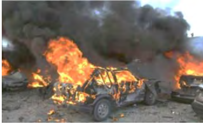
זירת האירוע מערבית לכרבלא (אלואקע און ליין, 13 באוגוסט 2017).

◆ בגדאד - דאעש קיבל אחריות על פיצוץ מכונית תופת ברחוב פלסטין במרכז בגדאד , שבו מתגוררת אוכלוסייה שיעית . על פי דאעש, 27 שיעים נפגעו, חלקם נהרגו וחלקם נפצעו (חק, 13 באוגוסט 2017). משרד הפנים העיראקי הודיע כי כוחות הביטחון העיראקים עצרו במרכז בגדאד שני מחבלים מתאבדים והשתלטו על מכונית תופת . המכונית פוצצה בצורה מבוקרת (אלסומריה, 13 באוגוסט 2017).