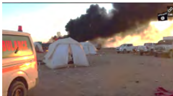
פעילי דאעש תוקפים את עמדת גדודי סיד אלשהדאא'. משמאל: שבוי איראני שהוצא להורג ע"י דאעש (חק, 11 באוגוסט 2017).

ערוץ אלעאלם האיראני דיווח, כי ארגון דאעש הוציא להורג את מחסן אלחגי', לוחם משמרות המהפכה אשר נשבה ב-8 באוגוסט 2017 באזור אלתנף בגבול סוריה עיראק (סוריה.נט, 9 באוגוסט 2017). על רקע הוצאתו להורג הדגיש מפקד כוח קדס, כי האומה האיראנית תנקום את מותו (תסנים, 10 באוגוסט 2017).