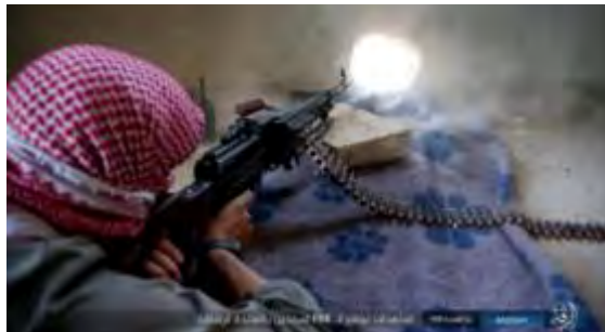
פעילי דאעש נלחמים נגד כוחות ה-SDF באלרקה (אח'באר אלמסלמין, 10 באוגוסט 2017).