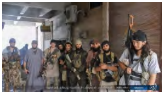
פעילי דאעש נערכים להתקפה נגד כוחות ה-SDF באלרקה (אח'באר אלמסלמין, 10 באוגוסט 2017).