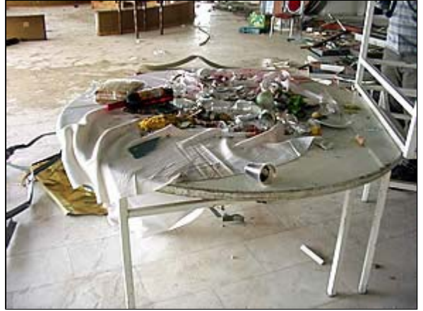
תוצאות "הצלחת הפיגוע": חורבן והרס שנותרו בחדר האוכל של מלון "פארק" לאחר פינוי ההרוגים והפצועים