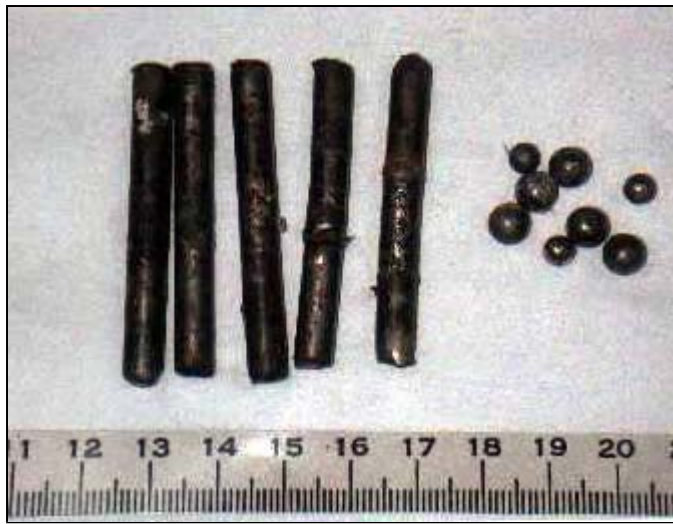
כדוריות מתכת ופיסות מתכת שהוספו לחומר הנפץ על מנת להרבות בנפגעים

21. בבוקר ה-27 במרס, יום ביצוע הפיגוע, הובא הנהג פתחי ח'טיב לדירה. אלסיד החליט כי אם יעצרו השניים בישראל יפעיל עודה את חגורת הנפץ שעל גופו גם אם הדבר יגרום למותו של פתחי ח'טיב. במסגרת ההערכות לתסריט זה צולם גם פתחי ח'טיב במטרה להפיץ את תמונתו במידה וייהרג במהלך הביצוע.