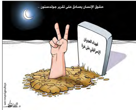
ההרוגים בעזה במהלך מבצע "עופרת יצוקה" מסמנים תנועת ניצחון מקברם תחת הכותרת "[ארגון] זכויות האדם מאשר את דוח גולדסטון" (עיתון פלסטין, של חמאס, 18 באוקטובר 2009)

8. ראשי חמאס ברכו על ההצבעה והמשיכו לנגח את אבו מאזן. דוברי חמאס טענו, כי דוח גולדסטון אינו מתייחס כלל לחמאס , שכן, הדוח מתייחס לכלל ארגוני הטרור 2 . כמו כן מכחישים בחמאס את האשמות ישראל בדבר שימוש באוכלוסייה כ"במגנים אנושיים". עוד מבטיחים ראשי התנועה, כי יקימו וועדת חקירה , כמתבקש בדוח, על מנת לבדוק את התנהלותה של חמאס.