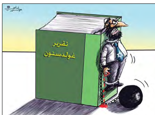
דוח גולדסטון מענה את ישראל וכובל את ידיה (אלביאן, 18 באוקטובר 2009)