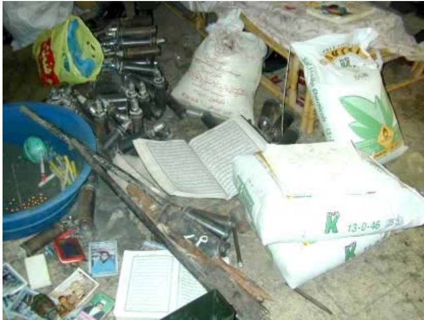
מעבדת חבלה שנתגלתה במחנה הפליטים בג'נין לייצור מטעני חנ"מ לא תקני. בצילום נראים מטעני צינור, חומרים כימיים לייצור המטענים וכדוריות להגברת עוצמת הפגיעה.