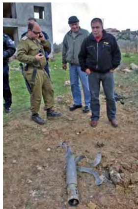
La roquette qui a frappé Mailia