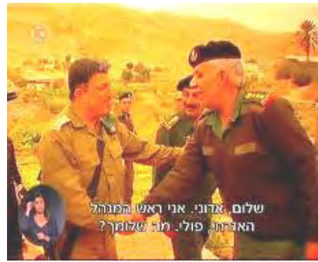
Rencontre entre des officiers de l'autorité civile israélienne et des officiers palestiniens (Dixième chaîne israélienne, 19 février 2009)