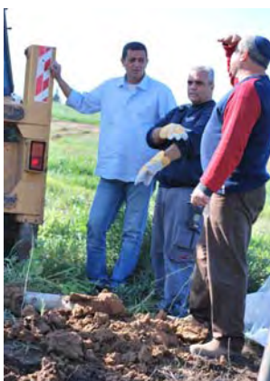
Extraction de la roquette tombée près de Sderot le 23 février (Zeev Trachtman, 23 février 2009)

■ Dans la plupart des cas, les organisations terroristes palestiniennes se sont abstenues de revendiquer ouvertement les attaques. A plusieurs occasions, un groupe inconnu appelé "les Bataillons du Hezbollah en Palestine" a revendiqué la responsabilité des tirs (Site Internet QudsNews, 18, 19 et 22 février 2009). Dans un cas, les cellules Ayman Jauda des Brigades des Martyrs d'Al-Aqsa du Fatah ont revendiqué le tir d'obus de mortier (Site Internet Ayman Jauda, 21 février 2009).