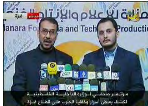
Conférence de presse du Hamas au cours de laquelle les "confessions" du Fatah ont été diffusées (Télévision Al-Aqsa, 23 février 2009)