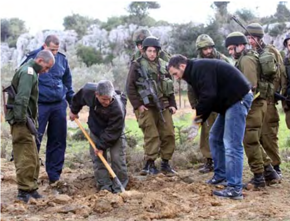
Roquette tombée dans le village de Mailia en Galilée (Shai Vaknin, 21 février 2009)