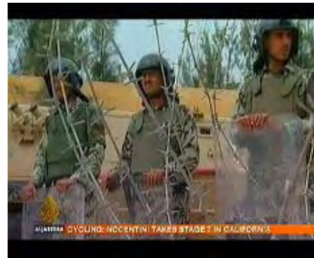
Gauche : Palestiniens quittant la bande de Gaza en autobus. Droite : La police égyptienne sécurise le terminal de Rafah ainsi que la frontière entre l'Égypte et Gaza