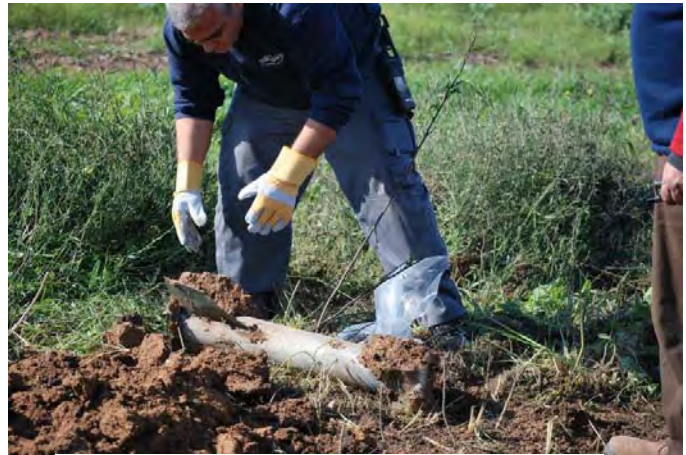
Roquette tombée près de Sderot dans le Néguev occidental (Zeev Trachtman, 23 février 2009)