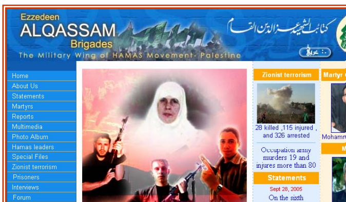
Пример главной страницы интернет-сайта на английском языке