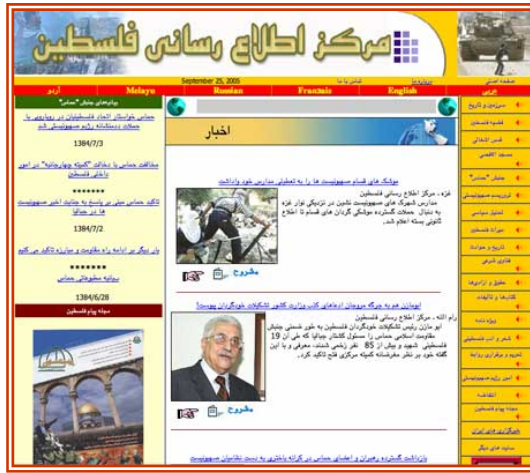
Пример главной страницы интернет-сайта на языке фарси