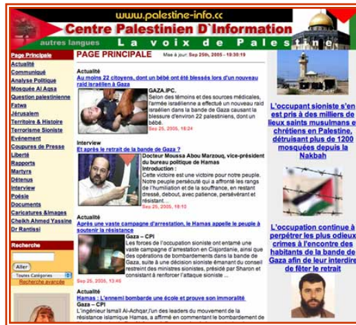
Пример главной страницы интернет-сайта на французском языке