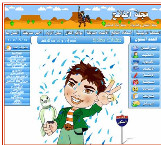
Главная страница детского сайта (меняется каждый месяц): рисунки и комиксы совместно с идеями террора, направленными на молодое поколение...