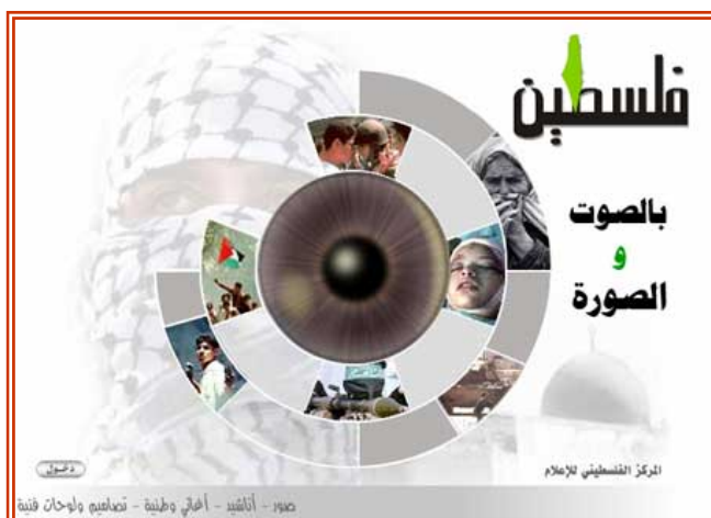
Пример главной страницы интернет-сайта