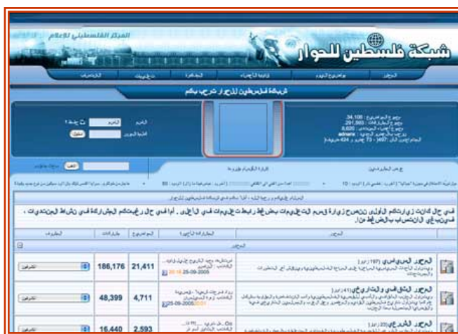
Главная страница форума ХАМАСа