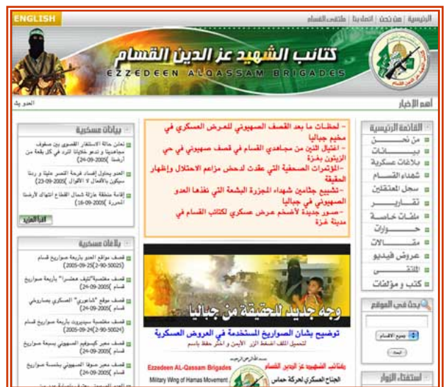
Пример главной страницы интернет-сайта на арабском языке