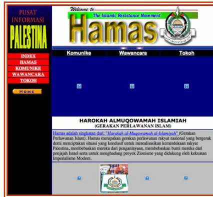
Пример главной страницы интернет-сайта