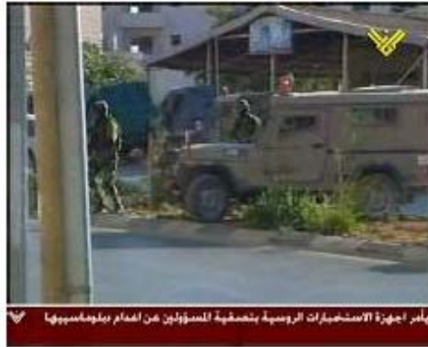
Arrestations à El-Bireh (Télévision Al-Manar, 29 juin)

terroristes 2 , dont des personnalités du gouvernement du Hamas et du Parlement palestinien. Tous les individus appréhendés ont subi un interrogatoire et seront présentés prochainement à un juge en vue de la prolongation de leur détention (bureau du porte-parole de Tsahal, 29 juin). Ces arrestations ont été effectuées en conformité avec la législation israélienne et internationale.