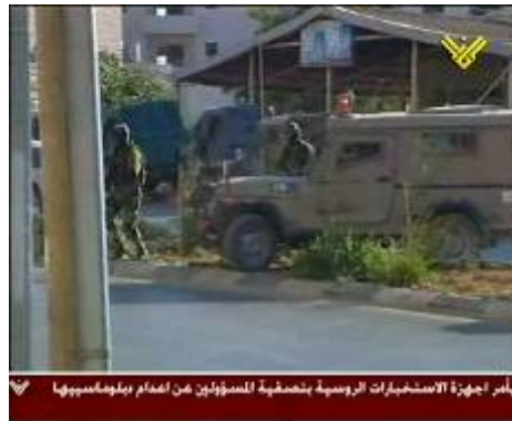
פעילות המעצרים באלביריה (טלוויזית "אלמנאר", 29 ביוני)

11. בבוקר ה-29 ביוני ביצעו כוחות צה"ל מעצרים נרחבים בערי הגדה המערבית (ראמאללה, שכם, ג'נין, קלקיליה) ובירושלים. במסגרת זאת נעצרו כ-80 פעילי "חמא"ס" , ובכללם נושאי משרות בכירות בממשלה וב"מועצה המחוקקת" , בגין פעילות טרור ועברות על חוקי מניעת טרור 2 . כל העצורים הועברו לחקירה ויובאו בזמן הקרוב בפני שופט לשם הארכת מעצרים (דובר צה"ל, 29 ביוני). המעצרים הללו התבצעו בהתאם לכללי החוק הישראלי והבינלאומי והם כפופים לביקורת שיפוטית.