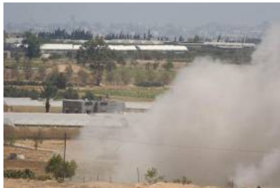
פיצוץ המנהרה דרכה חדרו המחבלים לישראל

1. בבוקר ה- 26 ביוני פוצצו כוחות צה"ל את המנהרה אשר שימשה לחדירת קבוצת המחבלים לשטח ישראל. צה"ל חשף את פיר המנהרה בתוך בית פלסטיני המרוחק כ- 350 מטרים מגדר המערכת.