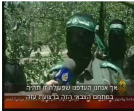
דובר "גדודי עז אלדין אלקסאם" משתבח בביצוע הפיגוע (טלוויזית "אלג'זירה", 25 ביוני)