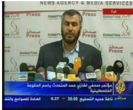
דר' ע'אזי חמד פונה בקריאה בשפה העברית שלא להיגרר להסלמה (טלוויזית "אלג'זירה", 25 ביוני)

ב. דובר ממשלת ה"חמא"ס , דר' ע'אזי חמד, הפנה קריאה לממשלת ישראל שלא להיגרר להסלמה 6 . ע'אזי חמד פנה לארגונים השונים וביקש מהם לשמור על חיי החייל החטוף (טלוויזית "אלג'זירה", 25 ביוני).