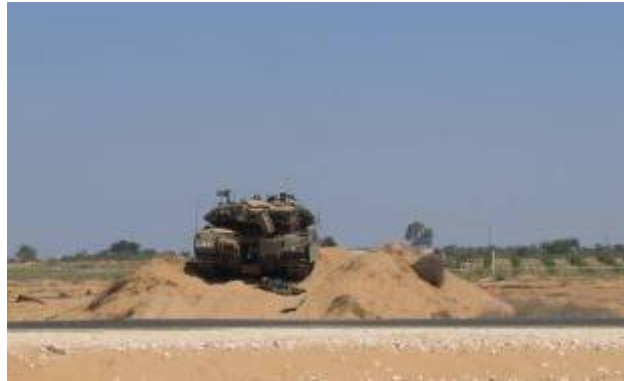
טנק צה"ל שנפגע בתקיפה

2. קבוצת המחבלים הגיעה לשטח ישראל, אל עורפו של כח צה"ל, באמצעות מנהרה שנחפרה מפאתי רפיח באורך של כ-700-800 מ', מהם כ-300 מ' בשטח ישראל. קבוצת התוקפים, בחסות ירי פצצות מרגמה וטילי נ"ט, התפצלה לשלוש חוליות. החוליות תקפו במקביל, באמצעות ירי נ"ט, השלכת מטענים וידוי רימונים, טנק, נגמ"ש (ריק) ועמדת תצפית. אחת החוליות הצליחה לפגוע בטנק ובאנשי הצוות שבו באמצעות ירי נ"ט.