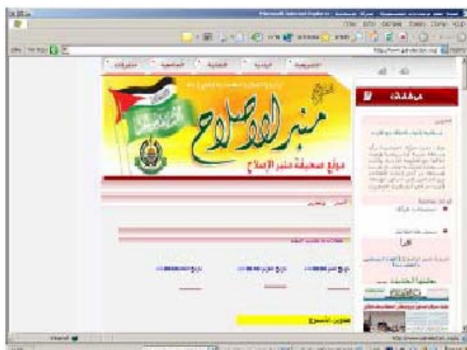
Главная страница сайта

38. Относительно новый сайт, созданный перед выборами в Законодательный совет и с тех пор является постоянным сайтом ХАМАСа.