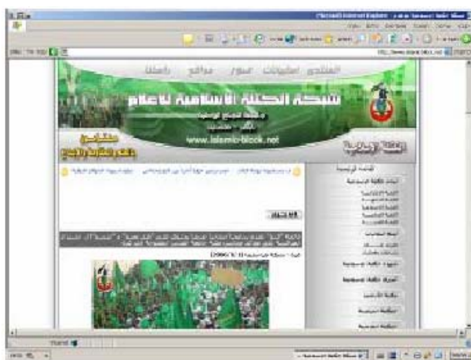
Главная страница сайта "Исламского Блока"

47. Этот сайт принадлежит "Исламскому Блоку", студенческой организации ХАМАСа в университете "Аль-Наджах". Сайт призывает к насилию и террору против Израиля. Следует отметить, что студенты "Исламского Блока" участвовали в террористической деятельности ХАМАСа против Израиля 10 .