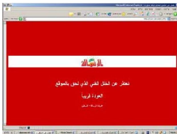
Главная страница сайта "Аль-Ресала"