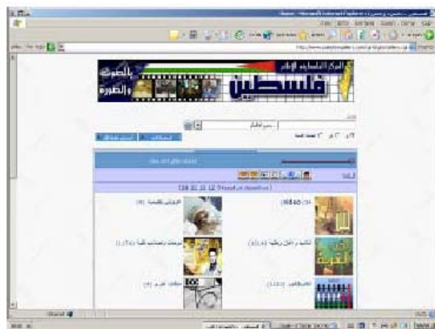
Главная страница сайта

33. Сайт предоставляет визуальную информацию в основном о палестино-израильском конфликте: фотографии, видео-фильмы, плакаты, карикатуры, лекции и "завещания" шахидов ХАМАСа.