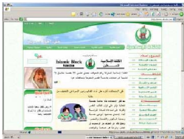
Главная страница сайта

51. На главной странице сайта указано, что это официальный сайт "Исламского Блока" (студенческой организации ХАМАСа) для увековечивания "шахидов", которые состояли в рядах оперативно-террористического крыла ХАМАСа "Батальоны Изатдин Аль-Кассам" .