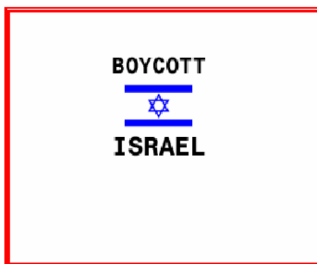
Анимационная картинка, опубликованная на сайте на английском языке

20. Интернет-сайт ХАМАСа на английском языке отличается от сайтов на арабском языке по содержанию и по внешнему виду. На сайте публикуются в основном новостные материалы, демонстрирующие точку зрения ХАМАСа на события, хотя идеи пропаганды и подстрекательства более сдержанны.