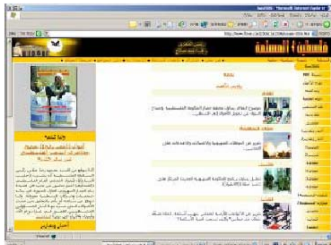
Главная страница сайта "Филистин Аль-Муслима"