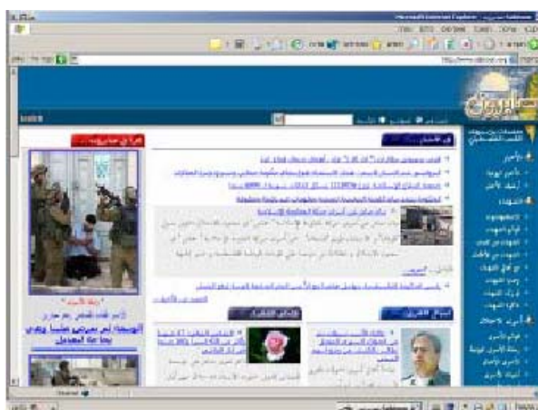
Главная страница сайта "Аль-Сабирун" 13

Сайт, связанный с организацией ХАМАС www.sabiroon.com/sabiroon.net/sabiroon.org