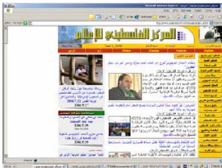
Главная страница сайта на арабском языке