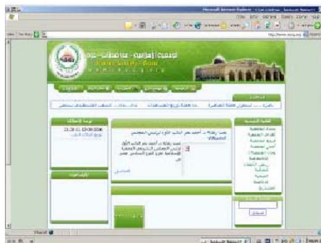
Главная страница сайта