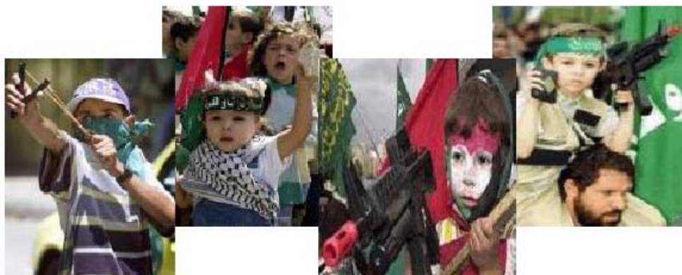
Индоктринация детей в духе радикальной исламской идеологии ХАМАСа – раздел "Дети Палестины" газеты "Аль-Фатех"

45. Это сайт детской интернет-газеты ХАМАСа "Аль-Фатех". Каждый месяц выходит новый выпуск газеты и публикуется в интернете. На сайт газеты ведет банер с главной страницы основного сайта ХАМАСа на арабском языке. Газета предназначена для детей, в ней публикуются песни, истории, рисунки, восхваляющие героизм "шахидов". Таким образом сайт производит индоктринацию молодого поколения, воспитывая детей в духе радикальной исламской идеологии ХАМАСа. Сайт восхваляет "шахидов", призывает к террору и насилию против Израиля среди детей.