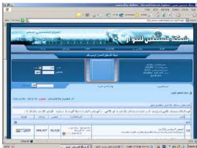
Главная страница сайта