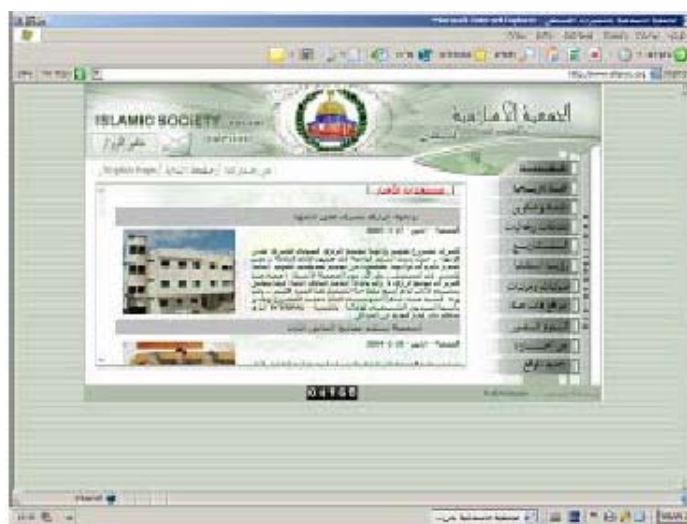
Главная страница сайта отделения Исламского благотворительного общества в лагере беженцев Аль-Нусират в секторе Газа