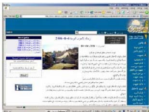
Ежедневная новостная страница сайта, на которой появилось сообщение боевиков ХАМАСа, заключенных в израильских тюрьмах, связанное с "документом заключенных".

59. Сайт служит платформой для боевиков ХАМАСа, заключенных в израильских тюрьмах, и публикует ежедневную новостную ленту. Например, 6 июня заключенные ХАМАСа опубликовали официальное сообщение, согласно которому они противятся проведению референдума по "документу заключенных".