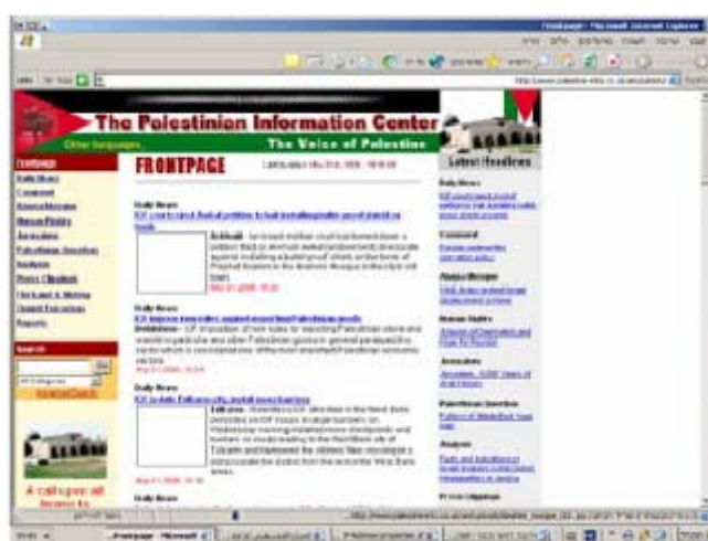
Главная страница сайта на английском языке

20. Интернет-сайт ХАМАСа на английском языке отличается от сайтов на арабском языке по содержанию и по внешнему виду. На сайте публикуются в основном новостные материалы, демонстрирующие точку зрения ХАМАСа на события, хотя идеи пропаганды и подстрекательства более сдержанны.