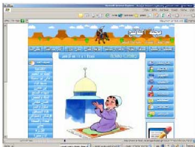
Главная страница сайта детской газеты ХАМАСа "Аль-Фатех"

45. Это сайт детской интернет-газеты ХАМАСа "Аль-Фатех". Каждый месяц выходит новый выпуск газеты и публикуется в интернете. На сайт газеты ведет банер с главной страницы основного сайта ХАМАСа на арабском языке. Газета предназначена для детей, в ней публикуются песни, истории, рисунки, восхваляющие героизм "шахидов". Таким образом сайт производит индоктринацию молодого поколения, воспитывая детей в духе радикальной исламской идеологии ХАМАСа. Сайт восхваляет "шахидов", призывает к террору и насилию против Израиля среди детей.