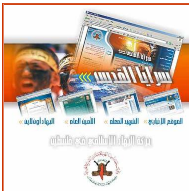
Главная страница сайта