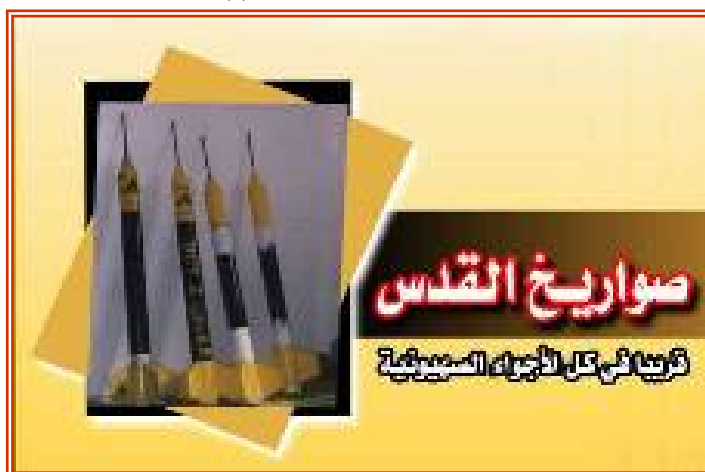
"Иерусалимские ракеты" – фотография, опубликованная на сайте (19 декабря 2005г)