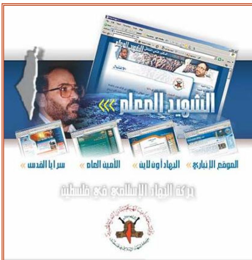
Главная страница сайта