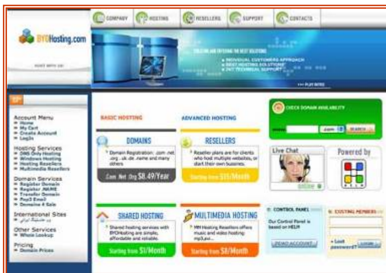
Главная страница интернет-сайта румынской компании, предоставляющей услуги хостинга