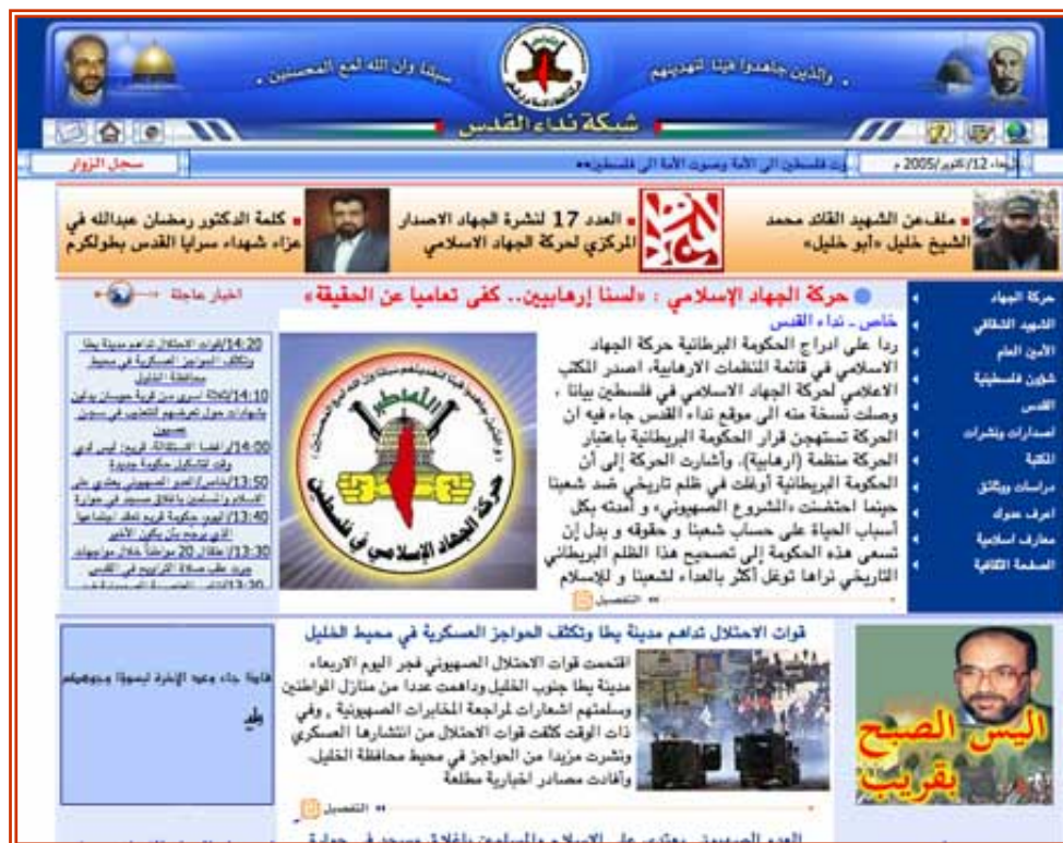
Главная страница сайта

(данный сайт существует также с окончанием .com)