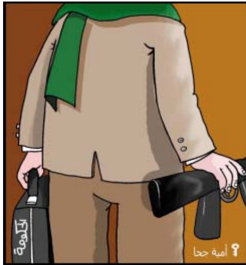
Le nouveau gouvernement du Hamas : une mallette dans une main, un fusil dans l’autre. Dessin d’Omayya Joha, connue pour ses positions pro-Hamas (Al-Hayat Al-Jadeeda, 1 er février 2006).

✿ Légitimer la “résistance” [cf. le recours au terrorisme et à la violence] (Article 4): Le Hamas a décrété que la “résistance sous toutes ses formes” était le “droit légitime” du peuple palestinien comme moyen de “mettre un terme à l’occupation et à garantir les droits nationaux palestiniens” [Note : Selon la terminologie du Hamas, les attentats suicides s’inscrivent dans le cadre de la “résistance.”]