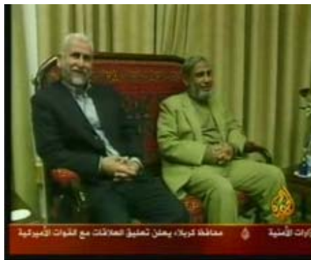
A gauche : Dr. Muhammad al-Zahar, Ministre des Affaires étrangères ; Droite : Sayid Siyam, Ministre de l'Intérieur.

■ De plus, les personnalités les plus influentes du Hamas ne sont pas membres du gouvernement mais résident à l'“extérieur” des territoires administrés par l'AP. Ainsi Khaled Mashal , dirigeant du Hamas, responsable du “bureau politique” du mouvement, qui opère depuis Damas, et Muhammad Deif , responsable de la branche armée, qui se cache dans la bande de Gaza.