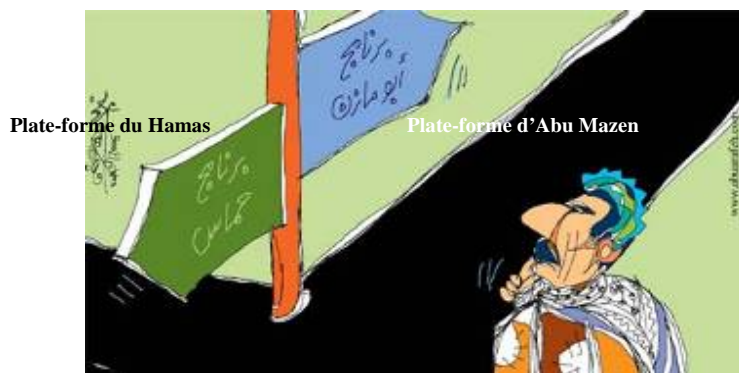
Deux plates-formes politiques diamétralement opposées aux yeux d'un caricaturiste palestinien (Al-Quds, 9 février 2006)