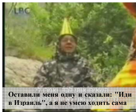
Оставили меня одну и сказали: "Иди в Израиль", а я не умею ходить сама Выпущенная по направлению Израиля "беспризорная" ракета, за которую ни одна организация не взяла ответственность.