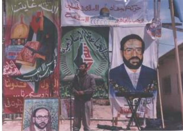
Posters du JIP affichés sur un stand d'Al-Jama'ah al-Islamiyyah. En haut on peut lire "Jihad Islamique Palestinien." A gauche figurent des slogans islamiques sur fond d'une carte de Palestine, du Coran, du Dôme du Rocher et d'un fusil. Au centre se trouve l'emblème d'Al-Jama'ah al-Islamiyyah. A droite (et en bas à gauche), on aperçoit un portrait du fondateur de l'organisation, Fathi Shqaqi (tué à Malte en 1995).