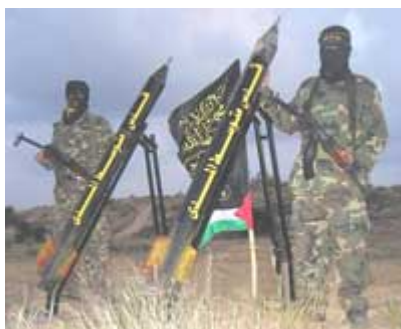
Готовые к запуску ракеты "Кассам" (иллюстрация, www.qudsway.com )