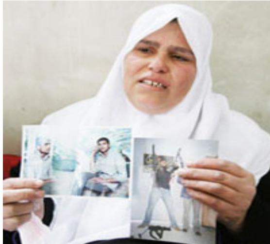
La mère du terroriste suicide arbore le portrait de son fils