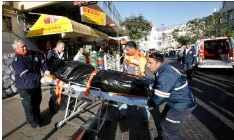
Corps de l'une des victimes sur les lieux de l'attentat (Gil Cohen Magen, Reuters, 29 janvier 2007)

Le Jihad Islamique Palestinien, en collaboration avec le Fatah, a commis pour la première fois un attentat suicide à Eilat. Le terroriste suicide, parti de la bande de Gaza, est entré en Israël par la frontière égypto-israélienne. Les porte-parole du JIP ont déclaré que l'organisation prévoyait de commettre d'autres attentats et ont appelé les différents groupes palestiniens à cesser leurs luttes intestines afin de pointer leurs armes vers Israël