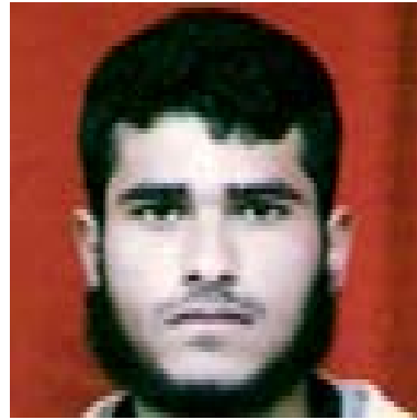
Le terroriste suicide Muhammad Feisal al-Siqsiq (Site Internet Paltoday du JIP, 30 janvier)