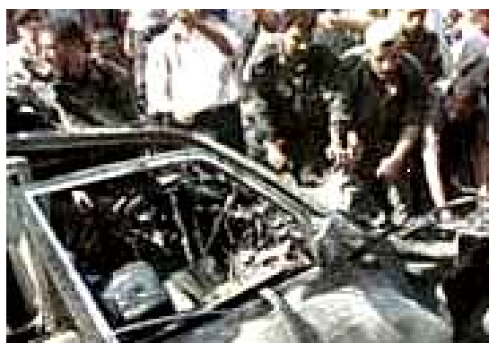
Остатки автомобиля, в котором ехали боевики "Исламского джихада" (сайт qudsway, 21 мая)