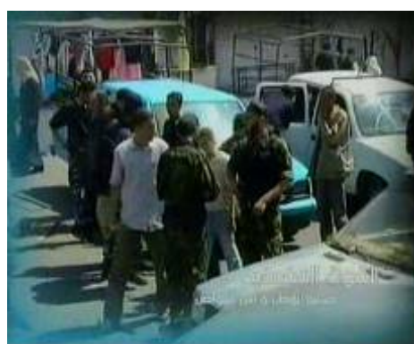
Слева: один из импровизированных КПШ сил безопасности ФАТХа. Справа: оперативные силы в действии