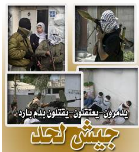
Несмотря на прекращение огня продолжается пропагандистская война. На фото: плакат, на котором подчиняющиеся Абу Мазену силы безопасности названы "Армия Лахада". Надпись на плакате: "Армия Лахада хладнокровно разрушает, арестовывает и убивает" ("Филистин Аль-Ан", 20 мая).