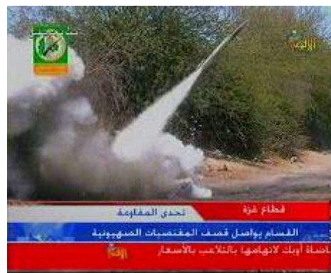
Организация ХАМАС запускает ракеты по Израилу (телевидение "Эль-Акса", 24 мая)