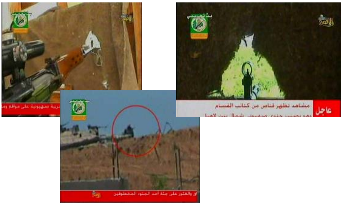
Отрывки из фильма ХАМАСа о снайпере, пытающемся атаковать силы ЦАХАЛа (телевидение "Эль-Акса", 23 мая)