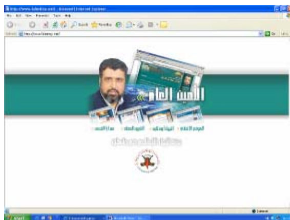
Page d'accueil du site.