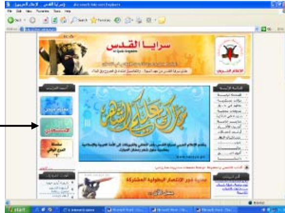
Page d'accueil du site (16 septembre 2007).

vidéo sur les activités terroristes du JIP.