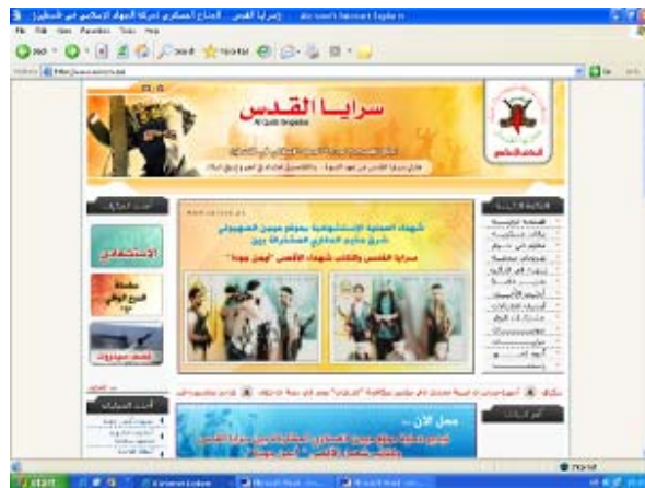
Page d'accueil du site (10 septembre 2007): Les "dernières volontés" des terroristes qui ont essayé de s'infiltrer en territoire israélien pour attaquer un poste ou une patrouille de Tsahal au Nord de Kissufim. 9