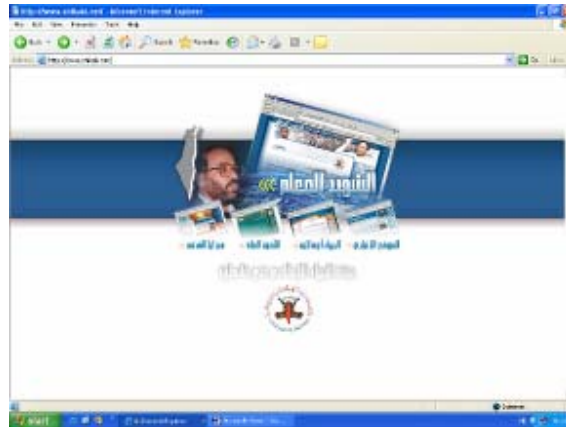
Page d'accueil du site

[pour Allah] la voie vers l'étape suivante. Commettre des attaques suicide sur le sol du Liban et le long de la frontière du Nord de la Palestine [du côté du Hezbollah] est une réaction islamique excellente, face à laquelle la technologie de l'impérialiste [c'est-à-dire, Israël] et son équipement monstrueux sont impuissants. "