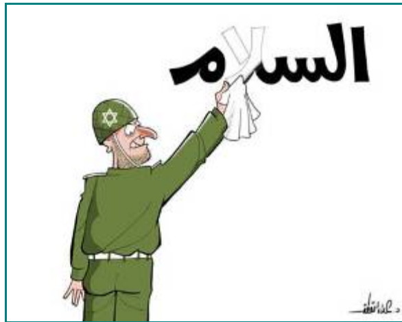
9. September 2007, "Falestin": israelischer Soldat, der als stereotyper Jude mit grausamen Blick dargestellt wird, radert das Wort "Frieden" [al-salam] weg.