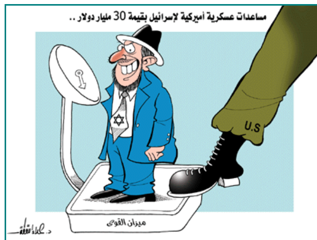
Die amerikanische Hilfe an Israel: Unter dem Titel "die amerikanische Hilfe an Israel wird auf 30 Milliarden $ geschätzt". Der amerikanische Fuß tritt auf die Waage, auf der ein stereotyp dargestellter Jude steht. Auf der Waage steht "Gleichgewicht der Kräfte" [zwischen Israel und den arabischen Staaten], September 2007, "Falestin".