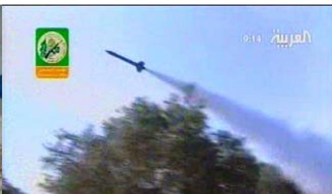
Die Hamas / Al-Qassam Brigaden veröffentlichen eine Videoaufzeichnung über den Abschuss einer Kassam-Rakete auf Israel (Al-Arabiya TV, 18. Januar)