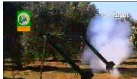
Die Izz ad-Din al-Qassam Brigaden der Hamas veröffentlichen ein Videoaufnahme mit einem Kassam-Raketen Abschuss auf Israel (Al-Arabiya TV, 18. Januar)