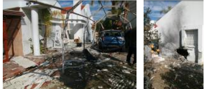
■ Direkter Einschlag in die Häuser von Sderot am 17. Januar

■ Sechs israelische Zivilisten wurden durch den massiven Raketenschuss verletzt, darunter ein fünf-jähriges Mädchen und einige Dutzend erlitten Schock- und Angsttraumata. Der Großteil der Verletzten ist aus Sderot. Des Weiteren kam es zu vielen Sachschäden an Häusern in der Stadt.