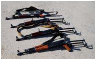
Diese Kalaschnikows trugen die vier Terroristen bei sich, die von der IDF verhaftet wurden (IDF-Sprecher, 19. Januar)