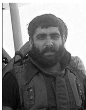
Хадж Имад Фаиз Мугние : полевой командир и международный террорист (фото : агентство "Аль Нахар", 17 февраля 2002 года).