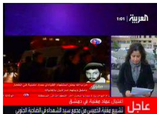
Справа : кадры, снятые на месте взрыва машины. Слева : телевизионный репортаж с места событий в районе "Суца" в Дамаске (телеканал "Аль Арабия", 13 февраля).