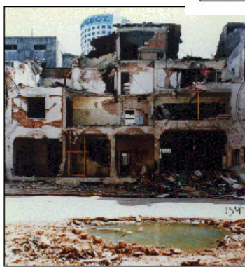
Террор против израильских и еврейских объектов в Аргентине : снимки с мест терактов в посольстве Израиля и в здании еврейской общины (АМІА) в Буэнос-Айресе