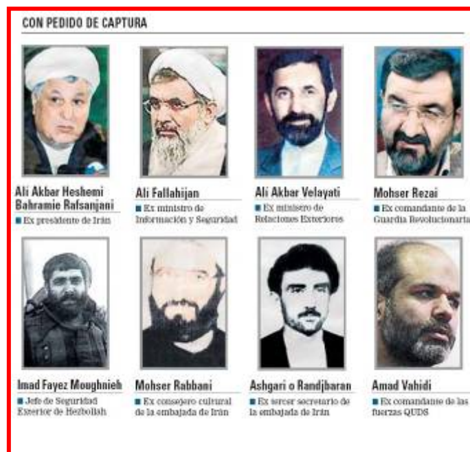
Список разыскиваемых, опубликованный властями Аргентины. Слева в нижнем ряду : Имад Мугние, единственный в списке разыскиваемых граждан Ливана