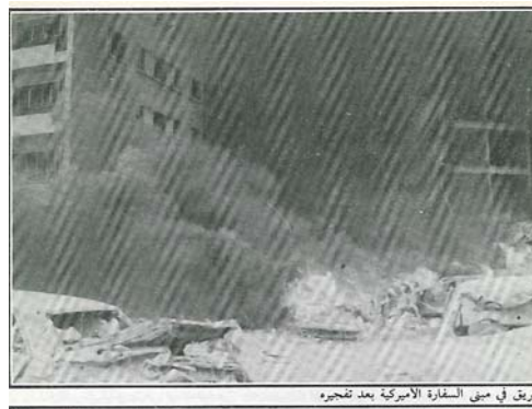
Кадры с места теракта в посольстве США в Бейруте в 1982 году, из книги "Аль Амалият Аль Истахдаиа" (акции самоубийства), вышедшей в свет в Бейруте (ноябрь 1985 года)