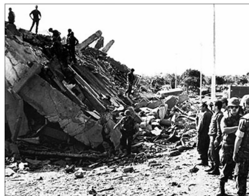
Кадры с места теракта в штабе морской пехоты США в Бейруте в 1982 году. Снимки здания штаба до и после теракта