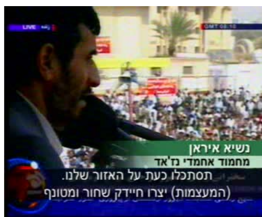
Ahmadinejad à Bandar Abbas, une ville au Sud de l'Iran: "Regardez notre région. [Les puissances occidentales] ont créé un sale microbe noir appelé le régime sioniste afin d'exciter les pays de la région comme une bête de proie" (ANB News, 20 février 2008).

1. La mort du terroriste du Hezbollah Imad Moughnieh a été exploitée par le régime iranien pour publier des déclarations antisémites éhontées appelant à la destruction de l'Etat Israël . Les propos les plus vifs ont été tenus par le Président iranien Ahmadinejad dans un discours prononcé dans la ville portuaire de Bandar Abbas au Sud de l'Iran. Il y a attaqué les puissances occidentales, qui, a-t-il affirmé, provoquent des guerres afin d'exporter des armes. Au sujet du