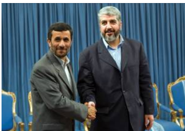
Khaled Mashal rencontre le Président iranien Ahmadinejad (Reuters, 26 mai 2008)