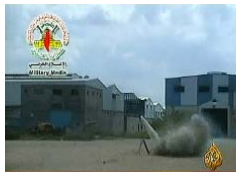
Tir de roquettes en territoire israélien, d'une vidéo de Bataillons de Jérusalem revendiquant une attaque. On peut voir que le tir a été réalisé depuis des bâtiments résidentiels (Télévision Al-Jazeera, 25 mai 2008)

■ Au cours de la semaine écoulée, le nombre de roquettes tirées depuis la bande de Gaza a diminué, avec un total de 13 tirs identifiés en territoire israélien contre 37 la semaine précédente. Deux des roquettes étaient des engins de type Grad de 122mm, tirés le 24 mai sur la ville de Netivot , ville méridionale qui représente depuis peu une nouvelle cible des organisations terroristes. De plus, 23 obus de mortier ont été tirés sur les forces de Tsahal opérant dans la bande de Gaza et dans les localités israéliennes situées près de la barrière de sécurité, contre 17 la semaine d'avant.