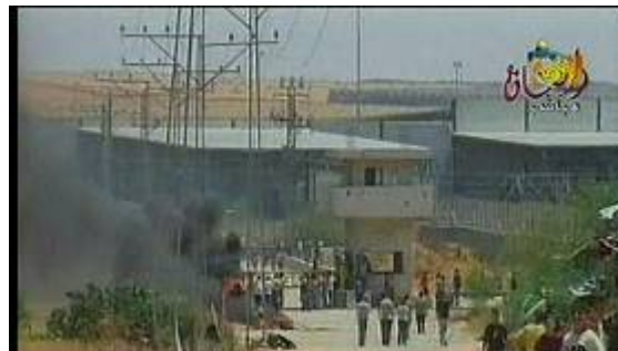
Demonstration at the Karni Crossing on May 22, organized by Hamas (Al-Aqsa TV, May 22).

■ Le Hamas a récemment organisé des "activités populaires" pour forcer le blocus de la bande de Gaza tout en maintenant des contacts avec l'Egypte quant à la trêve. Le 22 mai, le Hamas a organisé une manifestation au terminal de Karni en présence de plusieurs centaines des civils. Le cortège s'est approché du terminal comme prévu, et des pierres ont été lancées sur les forces de Tsahal. Dans un premier temps, les soldats ont tenté de disperser les manifestants avec leur équipement anti-émeute. Lorsque des individus armés ont été identifiés dans la foule, les soldats ont tiré en direction de leurs jambes et des échanges de tirs s'en sont suivis (Ynet, 22 mai 2008). Le Hamas a publié un communiqué déclarant que l'un des manifestants, un homme de 22 ans, a été tué et que des douzaines de participants ont été blessés (Site Internet Palestine-info, 22 mai 2008).