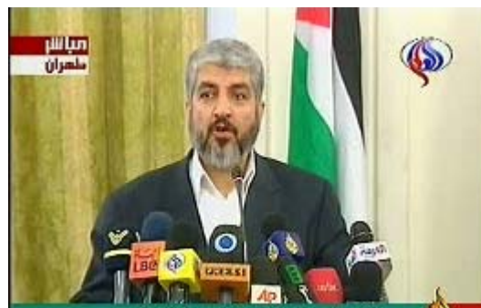
Khaled Mashal au cours d'une conférence de presse en Iran après un entretien avec le ministre iranien des Affaires étrangères (Télévision Al-Jazeera, 24 mai 2008).