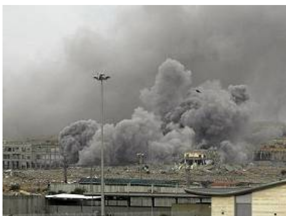
Explosion d'un camion piégé au terminal d'Erez (Forum du Hamas PALDF, 22 mai 2008)