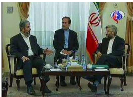
Khaled Mashal rencontre Sayid Jalili, le secrétaire du Conseil Supérieur de Sécurité Nationale d'Iran (Télévision Al-Alam, 24 mai 2008).

■ Khaled Mashal , le chef du bureau politique du Hamas à Damas, est arrivé en Iran le 24 mai, à la tête d'une délégation du bureau politique. La visite a été motivée par l'initiative égyptienne pour une trêve des combats dans la bande de Gaza, et par les contacts indirects pour une initiative de paix entre Israël et la Syrie. Khaled Mashal a rencontré des fonctionnaires iraniens de haut rang: le dirigeant Khamenei ; le Président Ahmadinejad ; Rafsandjani , le Président du