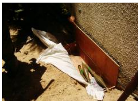
Lanceur de roquettes et missiles antichars découverts à l'occasion d'une opération de Tsahal au Nord de la bande de Gaza le 22 mai. Les armes étaient dissimulées sous une école à la périphérie de la ville de Saja'iya (Bureau du porte-parole de Tsahal, 22 mai 2008).