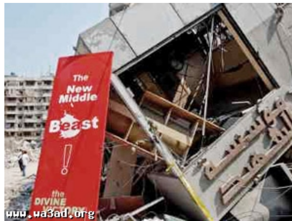
Ruines de l'Institut du Martyr après une attaque de l'armée de l'air israélienne pendant la seconde guerre du Liban 6

3. L'Institut du Martyr a été déclaré illégal par Israël en raison de sa relation avec le Hezbollah. En 2007, le ministère des Finances américain a déclaré la Fondation iranienne Shahid ainsi que ses filiales au Liban et aux Etats-Unis (où elle est appelée Goodwill Charitable Organization) illégale en raison de son soutien au Hezbollah.