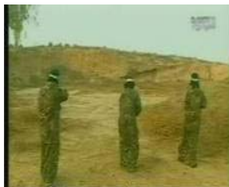
Стрельба из легкого стрелкового оружия