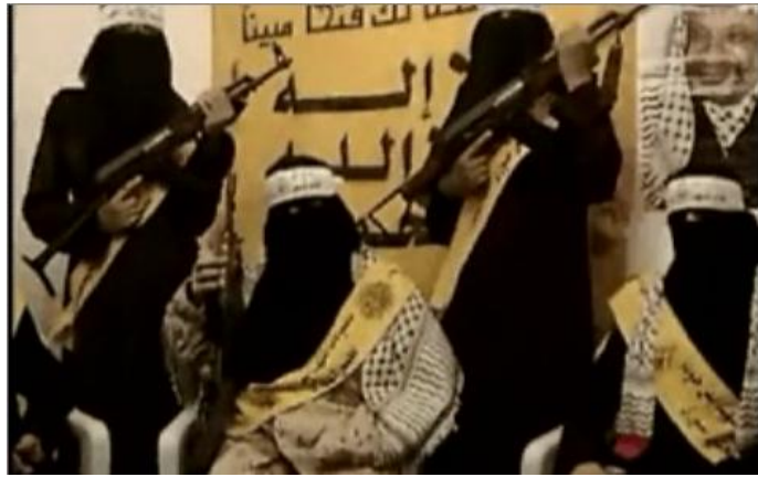
Женщины-боевики, состоящие в "Бригадах мучеников Аль-Аксы"