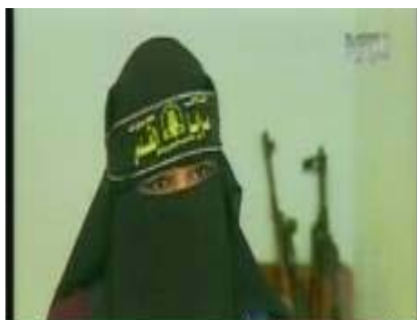
Так называемая "женщина, мечтой которой является Аль-Кудс (Иерусалим)", боевик "Бригад Аль-Кудс" (NTV, 19 августа)

7. В передаче, транслировавшейся 19 августа 2008 года по ливанскому телеканалу NTV, были показаны женщины-боевики "Бригад Аль-Кудс" Палестинского исламского джихада. Называющая себя " Ашикат аль-Кудс ", то есть, "женщина, мечтой которой является Аль-Кудс (Иерусалим)", она показывает готовый к использованию пояс со взрывчаткой и выражает свою готовность взорвать себя среди солдат АОИ в случае израильской военной операции в секторе Газы.