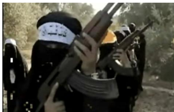
Женщины-боевики, состоящие в "Бригадах мучеников Аль-Аксы", проходят военную подготовку в секторе Газы.