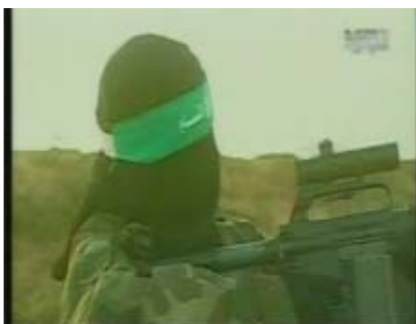
Стрельба из винтовки с оптическим прицелом