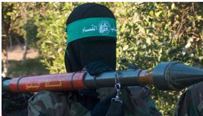
Женщина-боевик Хамаса держит ручной противотанковый гранатомет (РПГ)

6. Ниже приведены фотографии, снятые до перемирия. На них изображены женщины, состоящие в движении Хамас, во время военной подготовки и выполнения боевых заданий. Эти фотографии появились на интернет-форуме популярного телеканала "Аль-Джазира" (31 января 2008 года).