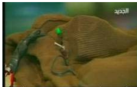
Пояс с взрывчаткой, принадлежащий "женщине, мечтой которой является Аль-Кудс" (NTV, 19 августа)

8. Эта женщина-боевик рассказала репортеру ливанского телевидения о том, что она уже принимала участие в боевых операциях и полна решимости продолжать борьбу. Также она рассказала о том, что помолвлена, но предупредила своего жениха о том, что если долг призовет ее, она без колебаний пойдет на выполнение любого задания. Затем она сказала: "Даже если евреи придут в день моей свадьбы, я все брошу и пойду с ними сражаться. Ничто не сможет остановить меня от принятия мученической смерти..."