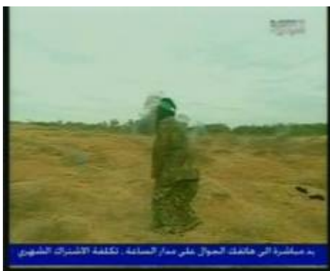
Метание гранаты с криком "Аллах акбар!"

5. 19 августа 2008 года ливанский телеканал NTV ("Аль-Джадид") транслировал передачу о военной подготовке женщин, состоящих в "Бригадах Аз аль-Дин аль-Кассам" и проживающих в секторе Газы. В программе было показано, как женщин обучали стрелять из легкого стрелкового оружия, метать гранаты, устраивать засады и нападать на солдат АОИ. Корреспондент отметил: "Ежегодно десятки женщин из сектора Газы проходят курс военной подготовки . Среди них студентки, молодые матери и работающие женщины. Они знают, что их участие в конфликте не ограничивается заботой о раненых и детях. Они понимают, что то, что они делают, может изменить баланс сил между палестинцами и Израилем". Ниже приведены несколько кадров из этой программы NTV.