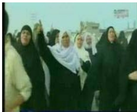
Слева: террористка-самоубийца Фатима Наджар зачитывает свою "последнюю волю" перед тем, как отправиться на совершение террористического акта (телевидение "Аль-Акса", 23 ноября 2006 года); справа: Фатима Наджар возглавляет демонстрацию женщин на въезде в Бейт Ханун зимой 2006 года (NTV, 19 августа 2008 года)