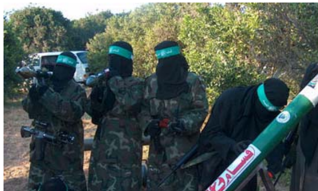
Женщины-боевики Хамаса, одетые в длинные юбки и чадру, готовят к запуску ракету "Кассам". Две из них держат гранатометы РПГ.