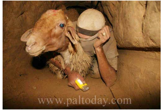
Контрабанда овец и телят через туннели

8. Существование сети туннелей обеспечивает постоянный приток больших сумм денег и продуктов питания на территорию сектора Газы. В результате, в противоположность тому, что вещает хамасовская пропаганда, в секторе Газы не только нет недостатка продуктов, но по некоторым их видам имеется даже излишек. Газета Хамаса "Аль-Рисала" опубликовала статью об улучшении экономической ситуации в Газе за счет появления широкого ассортимента дешевых продуктов, доставленных контрабандой через туннели. Теперь жители Газы могут даже запастись продуктами, которые раньше было тяжело достать. В статье утверждается, что благодаря туннелям решена проблема нехватки топлива. В некоторых из туннелей проложены трубопроводы, по которым горючее перекачивается из Египта в сектор Газы ("Аль-Рисала", 16 октября). Таким образом, в последнее время на рынках сектора Газы в изобилии имеется топливо из Египта (включая бытовой газ), что снижает его стоимость ниже официальной цены.