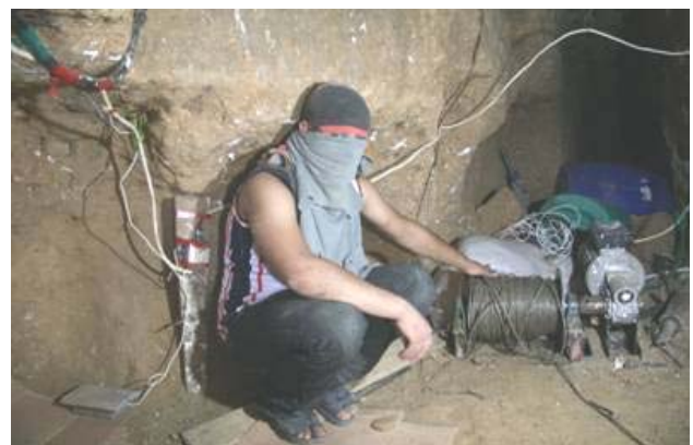
Прокладка телефонных линий в туннеле (Хамасовский форум PALDF, 23 октября).