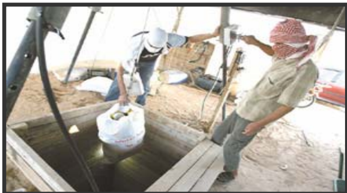
Вход в туннель под навесом

11. Благодаря мерам по упорядочиванию индустрии "туннелестроения" ее масштабы становятся более очевидными. По информации "Гардиан", на палестинской стороне Рафияха над входами в туннели появились сотни навесов. Прокладываемые в настоящее время туннели имеют достаточно большие размеры, позволяющие транспортировку домашнего скота и промышленных кондиционеров воздуха. По данным "Индепендент", навесы защищают входы в туннели от непогоды. Однако, по нашей оценке, некоторые из входов в туннели все еще расположены внутри капитальных сооружений (жилых домов и заброшенных зданий), чтобы скрыть их от глаз израильских и египетских спецслужб.