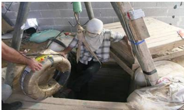
Доставка контрабанды через туннели (Хамасовский форум PALDF, 23 октября).