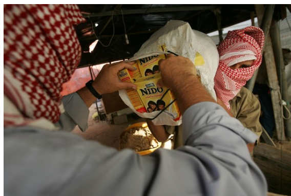
Контрабанда продуктов питания через туннели (Хамасовский форум PALDF, 23 октября 23).

8. Существование сети туннелей обеспечивает постоянный приток больших сумм денег и продуктов питания на территорию сектора Газы. В результате, в противоположность тому, что вещает хамасовская пропаганда, в секторе Газы не только нет недостатка продуктов, но по некоторым их видам имеется даже излишек. Газета Хамаса "Аль-Рисала" опубликовала статью об улучшении экономической ситуации в Газе за счет появления широкого ассортимента дешевых продуктов, доставленных контрабандой через туннели. Теперь жители Газы могут даже запастись продуктами, которые раньше было тяжело достать. В статье утверждается, что благодаря туннелям решена проблема нехватки топлива. В некоторых из туннелей проложены трубопроводы, по которым горючее перекачивается из Египта в сектор Газы ("Аль-Рисала", 16 октября). Таким образом, в последнее время на рынках сектора Газы в изобилии имеется топливо из Египта (включая бытовой газ), что снижает его стоимость ниже официальной цены.