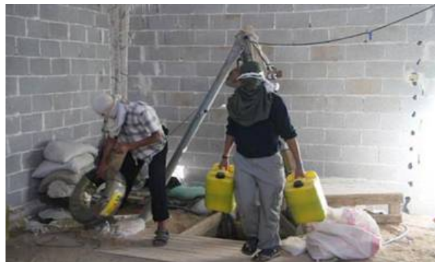
Вход в туннель внутри сооружения из шлакоблоков