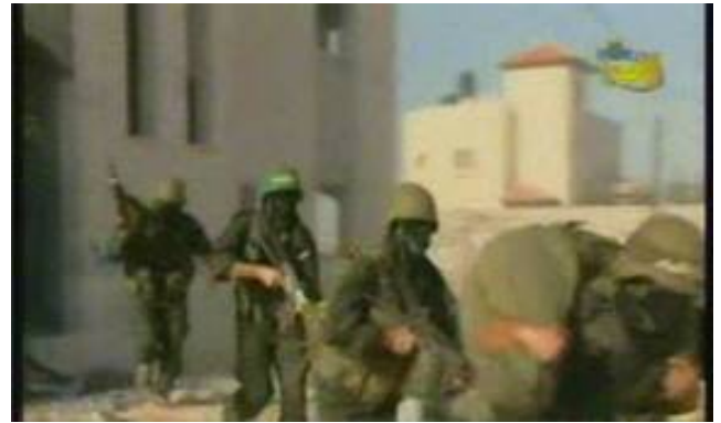
Entraînements d'agents des Brigades Izzedine el-Qassam au camp de réfugiés de Nuseirat (chaîne Al-Aqsa, 30 octobre)