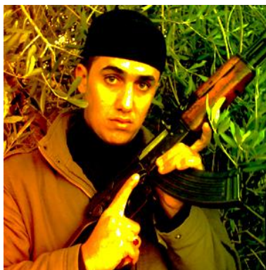
Mazen Sa'adeh, commandant des Brigades Izzedine el Qassam tué pendant l'opération de Tsahal (Forum PALDF du Hamas, 4 novembre 2008)

6. Le Hamas a annoncé la mort de six [sept, selon une autre version] agents des Brigades Izzedine el-Qassam au cours de cet incident qui a également fait plusieurs blessés. Les terroristes abattus appartenaient à l'unité d'artillerie des Brigades, comme c'est le cas de Mazen Sa'adeh, un des commandants des Brigades Izzedine el-Qassam (chaîne Al-Aqsa, 4 novembre) et de Mazen Nazimi Abbas, un des chefs de l'"unité spéciale" du Hamas (site internet Palestine-info et autres médias palestiniens, 5 novembre).