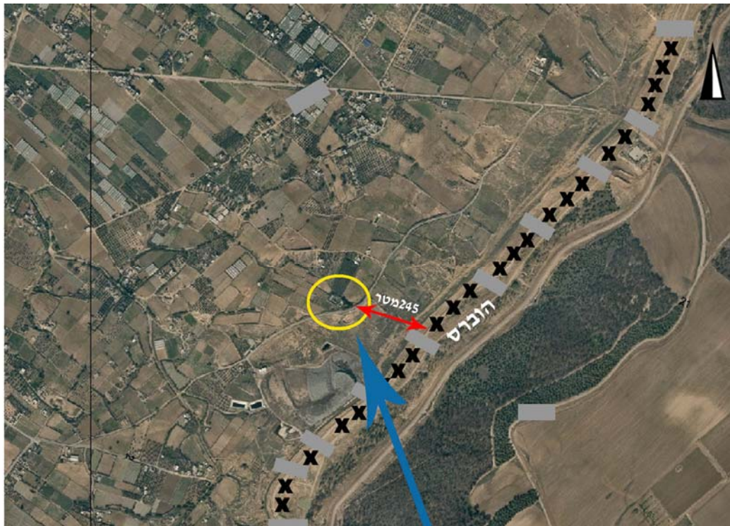
Photo aérienne de la zone d'opération des forces de Tsahal montrant la distance de 24,5 mètres séparant de la frontière israélienne l'issue d'un tunnel censé être exploité en cas d'enlèvement de soldats israéliens

Escalade dans la bande de Gaza : pour éviter l'enlèvement de soldats, Tsahal est engagé dans des opérations dans la bande de Gaza, près de la barrière de sécurité. En réaction : lancer de plusieurs dizaines de roquettes et d'obus de mortier. Les porte-parole du Hamas condamnent Israël sans toutefois proclamer la fin de la trêve en vigueur.