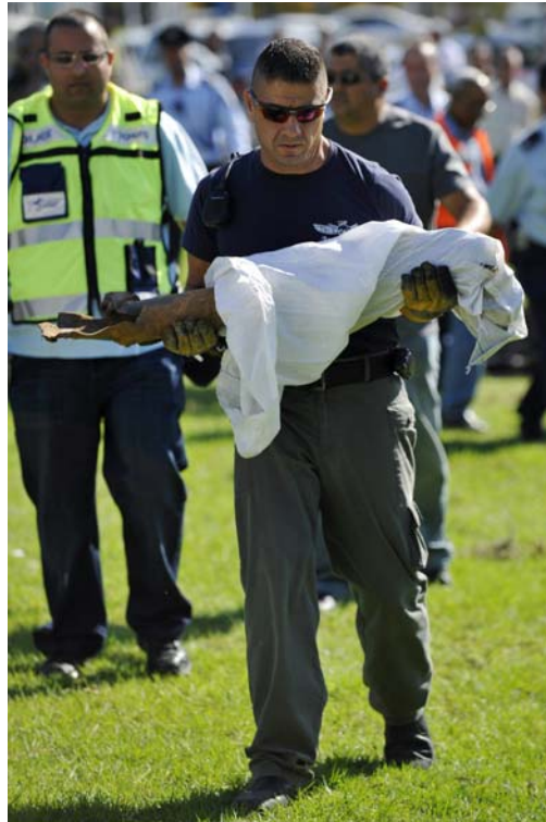
Expert en explosifs de la police israélienne transportant les débris d'une roquette lancée sur Ashkelon (Amir Cohen pour Reuters, 5 novembre)

8. En représailles à cette opération préventive de Tsahal, plusieurs dizaines de roquettes et d'obus de mortier ont été tirés – essentiellement par le Hamas – sur les villes et localités du Neguev occidental. Un total de 46 roquettes (dont deux sont tombées sur la bande de Gaza) et de 16 obus de mortier ont été lancés, certains en direction des forces israéliennes. Trois roquettes sont tombées dans les environs d'Ashkelon et au centre d'un quartier résidentiel de la ville. Trois femmes ont été transportées en état de choc. Une roquette tombée sur les serres d'une localité israélienne a causé des dégâts matériels. Un raid de l'armée de l'air a ciblé plusieurs escouades de lancement de roquettes et de mortiers opérant dans la région de Khan Yunis. Les tirs de roquettes et de mortiers ont cessé le 5 novembre vers midi.