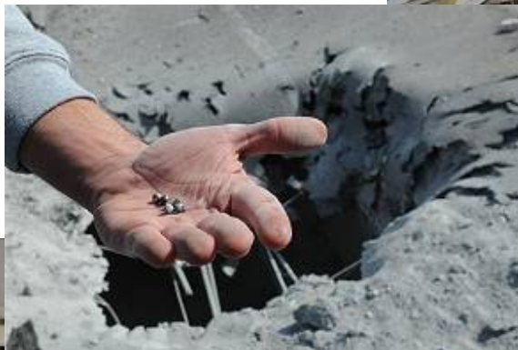
Débris de la roquette Grad qui a frappé une école de Beersheba