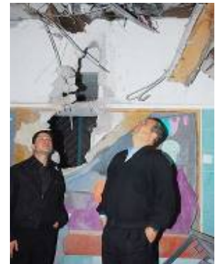
Le ministre de la Défense Ehud Barak examine les dégâts causés à l'école (Herzl Yosef, Ynet, 30 décembre 2008)

18. Le Premier ministre Ehud Olmert (1 er janvier) et le ministre de la Défense Ehud Barak (31 décembre) ont visité l'école qui a été endommagée. Lors de sa visite, Ehud Barak a déclaré qu'Israël continuera à intensifier l'opération jusqu'à ce qu'il atteigne les objectifs prévus (Ynet, 31 décembre 2008).