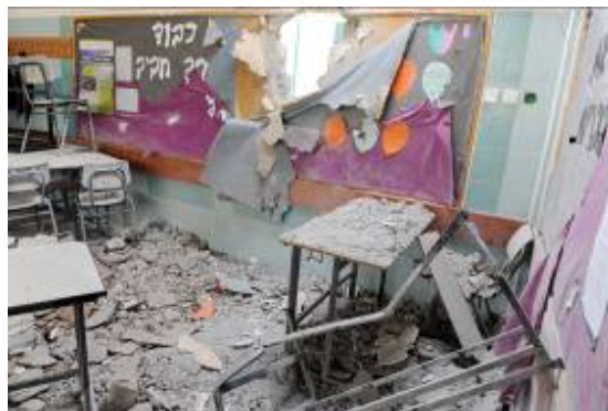
La salle de classe touchée à Beersheba (Ministère des Affaires étrangères, 31 décembre 2008)