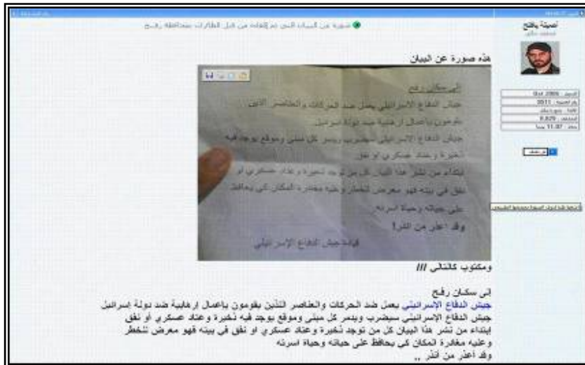
Exemple de prospectus destiné aux résidents de Rafah