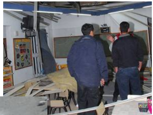
Frappe directe sur un jardin d'enfants à Beersheba, le 30 décembre