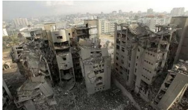
A droite : l'Université Islamique de Gaza, où se trouvait un centre de développement d'armes (Forum en ligne des Brigades Izz al-din al-Qassam, 31 décembre 2008). A gauche : siège des bureaux de l'administration du Hamas à Gaza (Paltoday, site internet du Jihad Islamique Palestinien (JIP), 1 er janvier 2009)

7. Selon la presse palestinienne, d'autres sites ont été frappés, y compris: