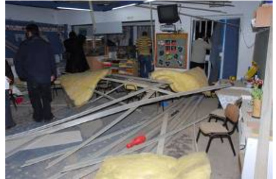
Les dégâts occasionnés à l'école maternelle de Beersheba (Herzl Yosef, Ynet, 30 décembre 2008)

16. Le 30 décembre vers 21h, une roquette s'est abattue dans une école maternelle d'un quartier de Beersheba, causant des dégâts matériels. Aucun enfant n'était sur les lieux en raison de l'heure tardive. Un civil qui se trouvait à proximité a été légèrement blessé et d'autres personnes ont été choquées.