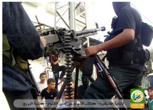
Armes visant l'aviation israélienne (Forum du site Internet des Brigades Izz-Din al-Qassam, 31 décembre 2008)