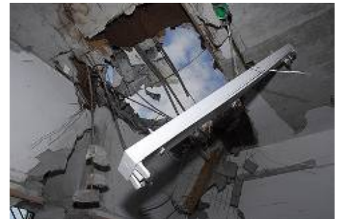
Trou dans le toit d'une salle de classe

17. Le 31 décembre, à 8h45, une roquette s'est abattue sur une école dans un des quartiers de la ville. En conséquence, un trou d'un diamètre d'environ un mètre et demi a déchiré le plafond d'une des salles de classe. Le bâtiment a subi de sérieux dégâts. Les cours n'avaient pas lieu à l'école en raison d'une interdiction émanant de la Défense civile et du maire de Beersheba. D'autres roquettes se sont abattues sur la ville et sa banlieue sans faire ni blessés ni dégâts.