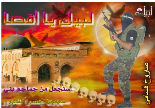
Affiche du forum des Brigades Izz-Din al-Qassam le 27 décembre : le titre précise : "A vos ordres, Al Aqsa." En-dessous il est écrit "Nous construirons un pont [à Al Aqsa] avec les crânes des fils de Sion."