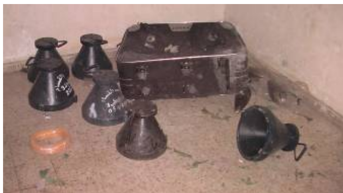
Взрывные устройства Шаваз , найденные во время операции «Литой свинец» Армией Оборона Израиля у боевиков бригад «из аль-дин аль-кассам» при обысках в секторе Газа.