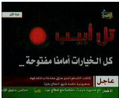
Телевидение Аль-Акса угрожает обстрелять Тель-Авив Надпись гласит: «Тель-Авив, все возможности открыты» (Телевидение Аль-Акса, 10 января 2009 года).

большим разрушениям. Ракеты, поставляемые Ираном, являются штатными ракетами 122 мм радиуса действия от 20 до 40 км. В течение 2008 года это позволило Хамасу подвергнуть опасности около миллиона израильтян , живущих в Беер-Шеве, Ашдоде и Ашкелоне, где находятся жизненно важные стратегические объекты. 5 Ракеты 122 мм радиуса действия 40 км внешне идентичны тем, которыми пользовалась организация Хезболла во время Второй войны в Ливане. В настоящее время Хамас стремится увеличить радиус действия своих ракет, так чтобы поставить под угрозу Тель-Авив, о чем было заявлено во время телевизионных передач: