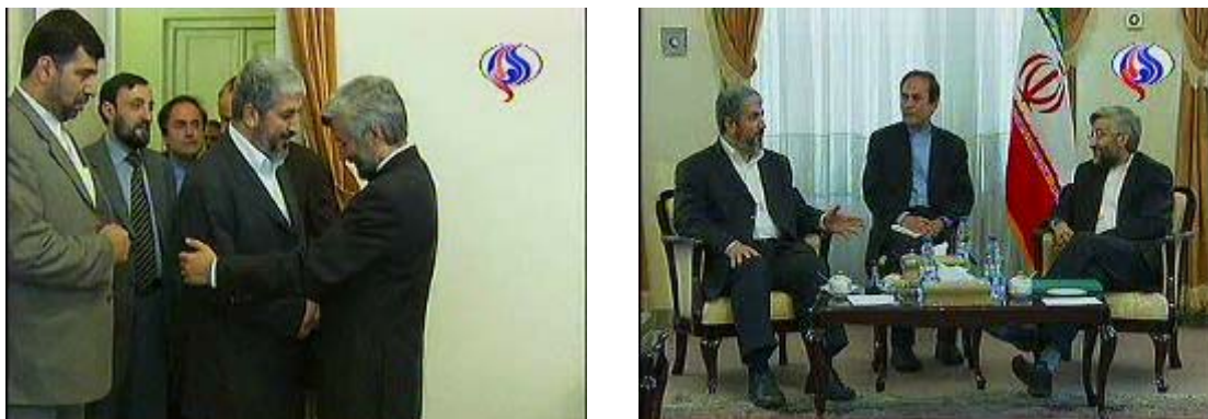
Встреча Халед Машаля с Саидом Джаили, возглавляющим Иракский национальный совет по безопасности (Телевидение Аль-Алам, 24 мая 2008 года)

48. Руководители Ирана, с которыми он встречался, выразили свою поддержку Хамасу и стратегии террора («сопротивления»), которую он представляет. Ахмадинежад сказал, что палестинская и ливанская победы (т.е. победы Хамаса и Хезболлы) стали результатом «сопротивления и настойчивости», и что они будут продолжаться и в будущем (Агентство новостей Мехр, 26 мая 2008 года). Рафсанджани сказал, что «сопротивление» (т.е. терроризм) является главным путем, с помощью которого палестинцы смогут добиться своих прав (агентство новостей ISNA, 26 мая 2008 года).