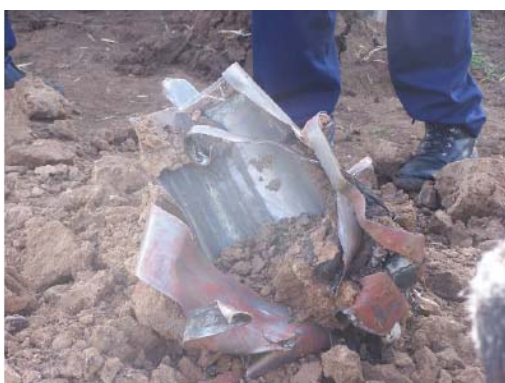
Тело ракеты после падения