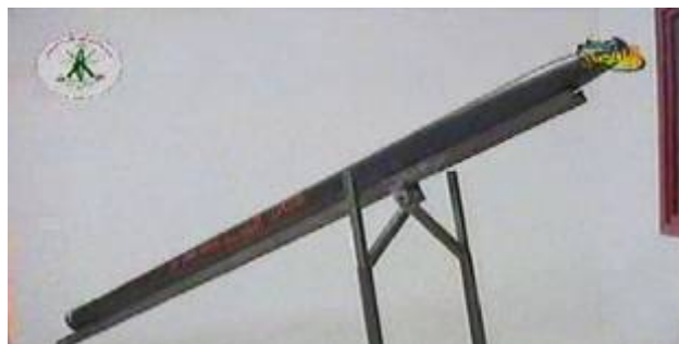
Модульная ракета 122 мм, максимальный радиус действия 20 км.