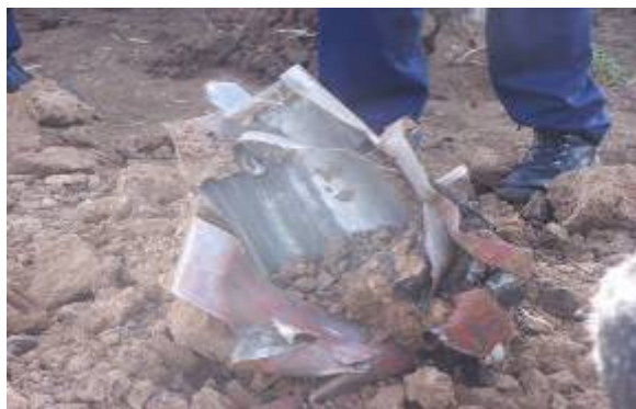
Часть хвоста китайской ракеты 122 мм, максимальный радиус действия 40 км.