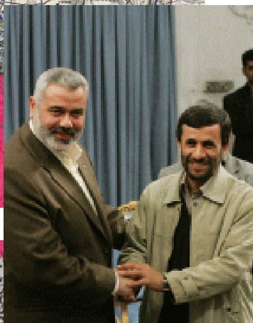
Исмаил Хания и президент Ирана Ахмадмеджад (Агентство новостей Исламской республики, 10 декабря 2006 г.).