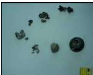
Обломки минометного снаряда, выпущенного из сектора Газа