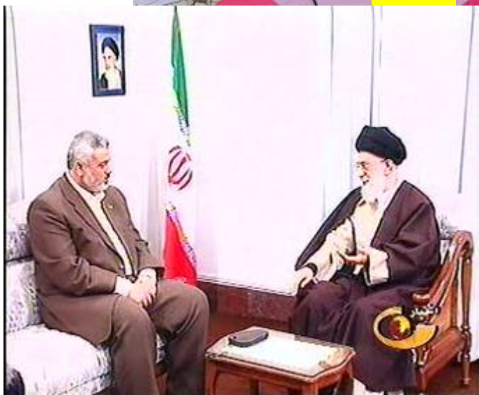
Премьер-министр администрации Хамаса Исмаил Хания с лидером Иран Хаменеи в секторе Газа (10 декабря 2006 года).