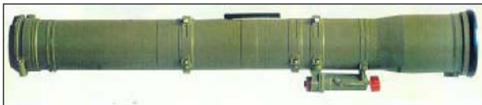
Готовая к запуску ракета «конкурс» в контейнере