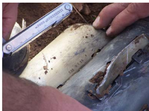
Надпись на крыле ракеты: E23 0210