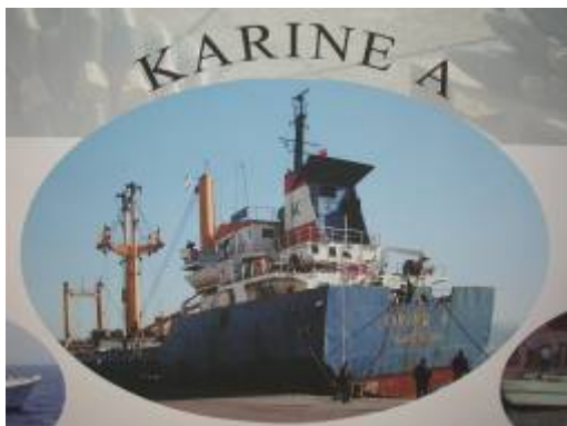
Судно Карин А: На борту судна было обнаружено большое количество оружия, которое было конфисковано израильскими ВМС