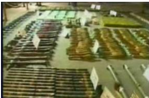
Часть оружия, найденного на борту судна Карин А. Если бы это оружие попало по назначению, боеспособность террористических организаций могла бы существенно возрасти