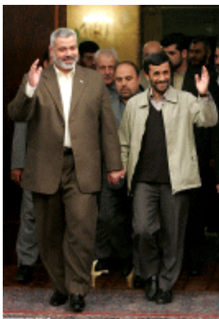
Исмаил Хания и Ахмадинежад (Исламское республиканское агентство новостей, 10 декабря 2006 года).

46. Когда Исмаил Хания возвращался в сектор Газа, министр обороны Израиля Амир Перец попросил закрыть КПП Рафиях, чтобы не допустить приезда в Газу Хания, который пытался незаконно ввезти туда десятки миллионов долларов. На КПП Рафиях произошла перестрелка между конвоем Махмуда Аббаса и боевиками Хамаса, пытавшимися прорваться через КПП. В связи с происшедшим европейские наблюдатели объявили, что они закрывают КПП. Поступили сообщения о том, что египетские власти конфисковали деньги, которые вез Исмаил Хания. Однако из Ирана в сектор Газа продолжали поступать большие суммы денег через туннели под границей между Египтом и сектором Газа и другими путями.