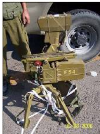
Устройство для запуска ракеты «конкурс» (захвачено в Ливане)