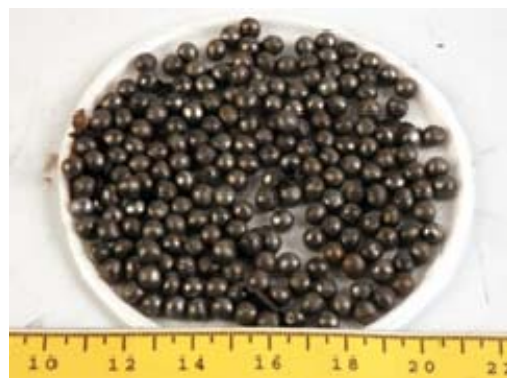
Шарики для шарикоподшипников из боеголовки ракеты 122 мм, радиус действия 40 км.

20. Во время операции «Литой свинец» Хамас и другие террористические организации ответили на действия Армии Оборона Израиля массивным ракетным обстрелом, впервые используя ракеты большого радиуса действия. Во время операции ракеты падали в населенных пунктах, которые прежде были вне радиуса действия, таких как Беер-Шева, Ашдод, Гедера, Явне, Кирьят-Гат, Кирьят-Малахи и Нетивот, что поставило под угрозу почти миллион людей. Ракеты такого радиуса действия