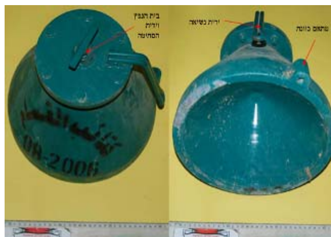
Взрывное устройство Шаваз (по-арабски «пламя»), обладающее более высокой пробивной способностью (предположительно 200 мм стальной брони), чем взрывные устройства, которыми обычно пользуются палестинские террористические организации

29. 9 марта 2008 года газета British Sunday Times поместила интервью, взятое в секторе Газа ее корреспондентом Мари Кольвин у лидера боевиков бригад «из аль-дин аль-кассам», принадлежащих военно-террористическому крылу Хамаса. Затем к нему присоединился боевик из отделения Хамаса по производству оружия. Оба террориста говорили о технологическом «ноу-хау», которое они получили из Ирана и которое Хамас считает чрезвычайно важным , принимая во внимание успехи Хезболлы в борьбе против Израиля в 2006 году [Вторая война в Ливане]. Боевик сказал, что они использовали ноу-хау Ирана в области технологии для разработки взрывных устройств и ракет с применением простого доступного сырья, которое можно найти в секторе Газа. Лидер боевиков сказал, что при помощи иранской технологии Хамас разработал взрывное устройство нового поколения Шаваз4 . Боевик, занимающийся производством оружия, сказал, что «все, что они [иранцы] считают важным [для нас], наши ребята немедленно посылают нам по электронной почте ». (Другие части интервью можно найти ниже в разделе 40).