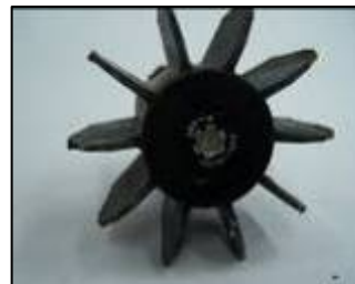
Хвост минометного снаряда 120мм, выпущенный во время Второй войны в Ливане

24. С тех пор продолжались атаки на населенные пункты, находящиеся вблизи сектора Газа. Во время операции «Литой свинец» (на 10 января) были выпущены по Израилю десятки доставленных из Ирана минометных снарядов 120 мм.