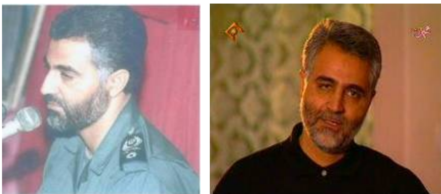
слева: Бригадный генерал Кассем Сулеймани, командующий вооруженных отрядов "аль-кудс" с 1998 года, в униформе. Справа: Одно из немногочисленных интервью Кассема Сулеймани, в котором он рассказывает о своем друге, погибшем в войне между Ираном и Ираком

7. Совпадение интересов Хамаса, Ирана и Сирии привело в последние два года к массивной поддержке Ираном Хамаса (и Сирии, где установлено «внешнее» руководство Хамаса). Лидер Ирана Али Хаменеи лично занимается координацией стратегической помощи Хамасу со стороны Ирана. На практике эта помощь поступает от Иранской революционной гвардии «аль-кудс», возглавляет которую Кассем Сулеймани , 4 а также от иранского министерства безопасности и разведки во главе с министром Мухсенем Хусейном Эчехи.