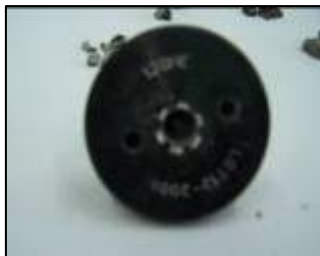
Часть хвоста минометного снаряда, выпущенного из сектора Газа