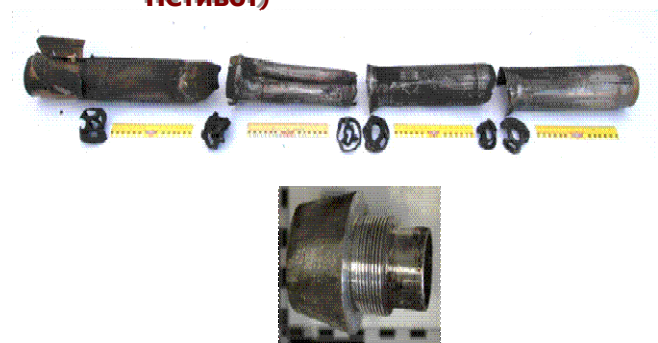
Модульная ракета 122 мм (мотор разбирается на части для облегчения контрабанды), максимальный радиус действия 20 км.