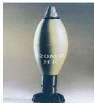
Иранский минометный снаряд 120мм с вспомогательным двигателем motors