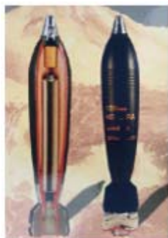
Иранский минометный снаряд 120мм

ii) 29 февраля 2008 года возле поста Армии обороны Израиля на юге сектора Газа упал минометный снаряд. Исследование его обломков показало, что этот штатный снаряд 120мм был изготовлен в Иране в 2006 году.