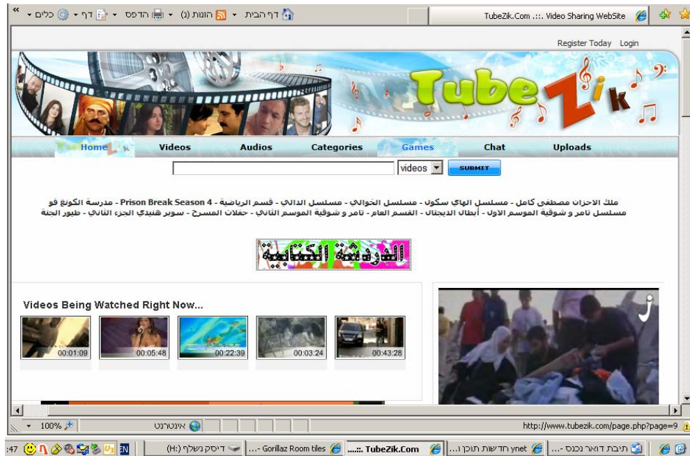
Page d'accueil d'Aqsa Tube nouvelle version (26 janvier 2009)