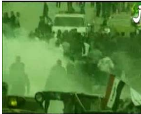
Image d'un clip de propagande du Hamas publié sur la page d'accueil de la nouvelle version d'Aqsa tube (26 janvier 2009)

4. Le site Internet TubeZik est en réalité le successeur du site Aqsa Tube du Hamas, qui a été retiré du réseau à deux reprises. Au premier coup d'œil, il peut ressembler à un innocent site Internet de divertissement qui propose de la musique et des vidéos ; cependant, il diffuse en continu une vidéo d'incitation à la haine et propose des archives sur les dirigeants du Hamas ainsi que des films qui encouragent le terrorisme.