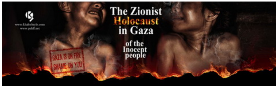
Exemple d'un poster du site sur les activités de Tsahal dans la bande de Gaza, qualifiées "d'holocauste" contre les civils innocents (16 janvier 2009)