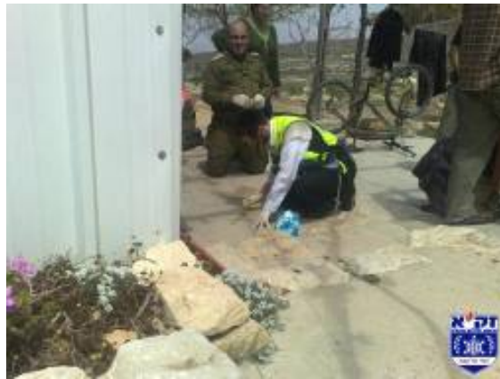
Gauche: Le terroriste palestinien soupçonné d'avoir poignardé à mort un adolescent dans la localité de Bat Ayn (Services de sécurité générale, 26 avril 2009). Droite: La scène du crime (photo publiée avec l'aimable autorisation de ZAKA, 2 avril 2009)