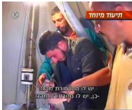
Les Egyptiens envoient du gaz dans les tunnels (Photo publié avec l'aimable autorisation de la 10 ème chaîne israélienne, 21 mars 2009)