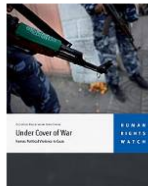
Le rapport de Human Rights Watch intitulé "Sous couvert de la guerre : La violence politique exercée par le Hamas à Gaza" (Site Internet de Human Rights Watch, 27 avril 2009)

■ Le 20 avril, l'ONG Human Rights Watch (Observatoire des droits de l'Homme) a publié un rapport à 26 pages sur la violence politique du Hamas dans la bande de Gaza. Le rapport critique sévèrement les activités du Hamas pendant et après l'Opération Plomb Durci. Il affirme que pendant l'opération, le Hamas a exécuté 18 Palestiniens soupçonnés de collaboration avec Israël , et que les membres du Hamas ont abattu de nombreux adversaires du mouvement, notamment des activistes du Fatah. De plus, selon le rapport, les exécutions se sont poursuivies après l'Opération Plomb Durci et de nombreux Palestiniens ont été torturés. Malgré les promesses du Hamas, à une exception, aucune enquête n'a été ouverte 3 (Rapport de Human Rights Watch, 27 avril 2009).