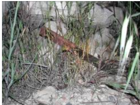
Gauche: Le suspect tenant son testament. Droite: Le couteau laissé sur le terrain après l'attaque (Service de sécurité générale, 26 avril 2009)