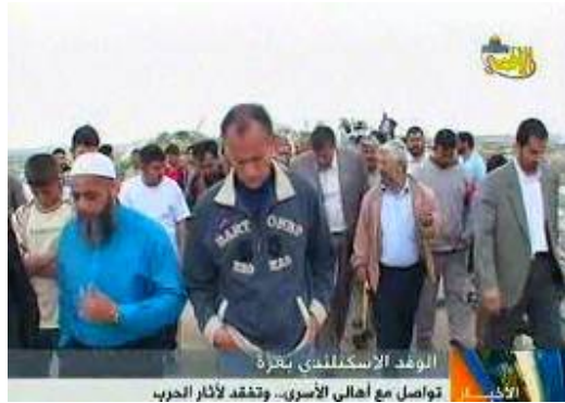
La délégation écossaise rencontre les familles des prisonniers dans la bande de Gaza (Télévision Al-Quds, 24 avril 2009)