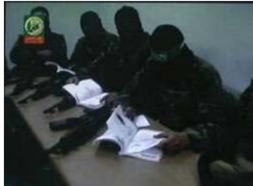
Izz al-Din al-Qassam Brigaden Aktivisten im Unterricht