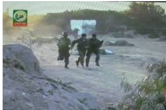
Simulierung der Entführung eines "israelischen Soldaten" (Mann Mitte rechts).