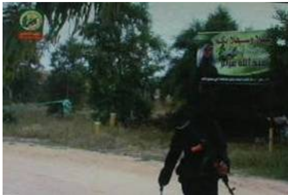
Schild am Eingang der Abdallah Azzam Akademie.

Während der Operation "Gegossenes Blei" wurde ein Werbefilm über eine von der Hamas eingerichtete und nach Dr. Abdallah Azzam, dem Ideologen von Osama Bin Laden benannte Militäarakademie beschlagnahmt. Die Hamas hat ihn zu einem Vorbild erhoben, obwohl die Bewegung eigentlich die Aktivitäten des globalen Dschihads im Gazastreifen ziemlich einschränkt.