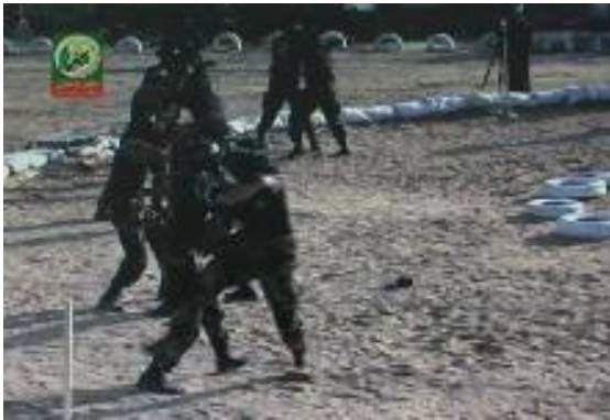
Selbstverteidigungsübungen auf dem Gelände der Akademie