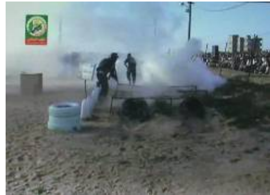
Übungen auf dem Gelände der Akademie