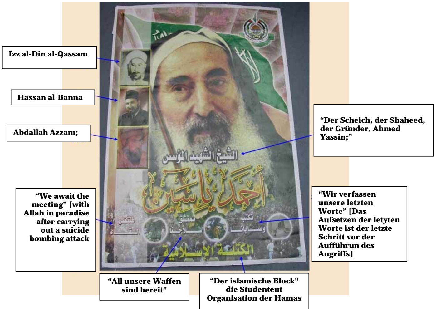
Hamas Poster von 2003 im Andenken an Sheikh Ahmed Yassin umgeben von anderen Figuren, die für die Hamas als Vorbilder gelten: Izz al-Din al-Qassam, Hassan al-Banna und Abdallah Azzam.