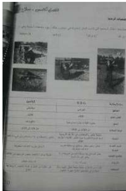
Hinweise über den Umgang mit Panzerfäusten in einem für die Studenten des ersten Kurses der Akademie aufgesetzten Handbuch.