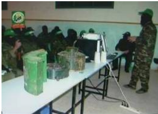
Unterricht über Bomben und