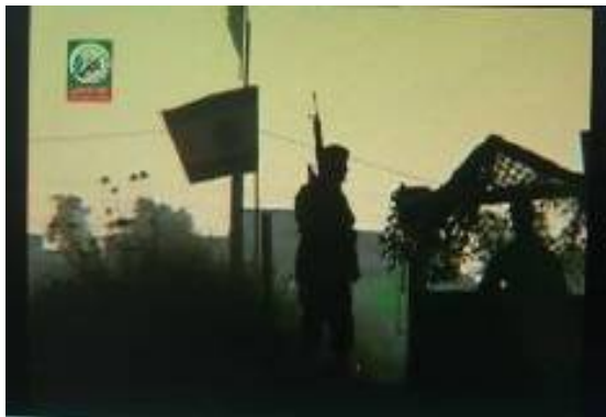
Modell eines "IDF Postens", in dem die Studenten das Entführen israelischer Soldaten