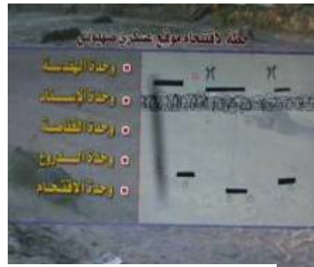
Eindringen in einen IDF Posten. Der gelben Aufschrift links nach zu urteilen bestehen die eindringenden Truppen aus Scharfschützen,