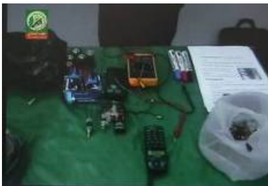
Unterricht im Einsatz von Handies zum Zünden von