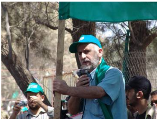
Sayid Siyam, der verstorbene Innenminister der de-facto Hamas Regierung in der Abdallah Azzam Akademie (Ein Hamas Poster, 6. Juni 2007). 4

und einer Militärparade, an der hochrangige Hamas Persönlichkeiten teilnahmen. Die Akademie setzte ihrer Aktivitäten offensichtlich auch im darauffolgenden Jahr fort, da Werbematerial für die Anmeldung zu diesem Kurs 2008 auf dem Internet-Forum der Hamas zu lesen war.