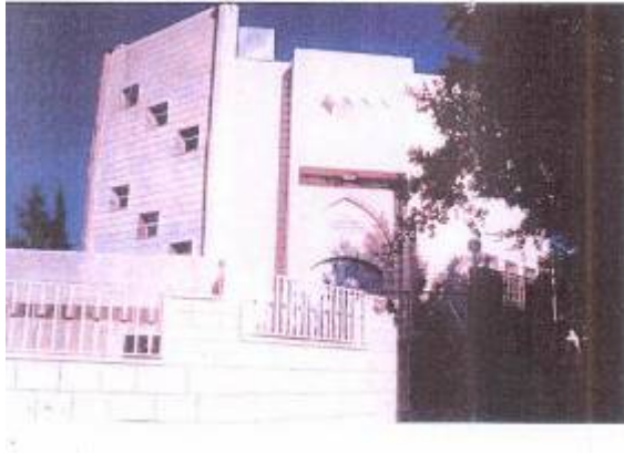
Die nach Abdallah Azzam benannte Moschee