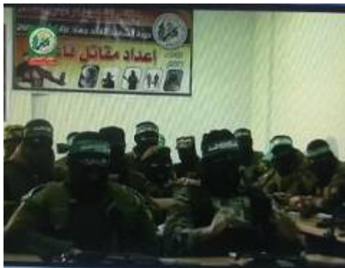
Studenten bei Unterricht. Die Überschrift des Posters lautet: "Die Ausbildung eines aktiven Kämpfers".