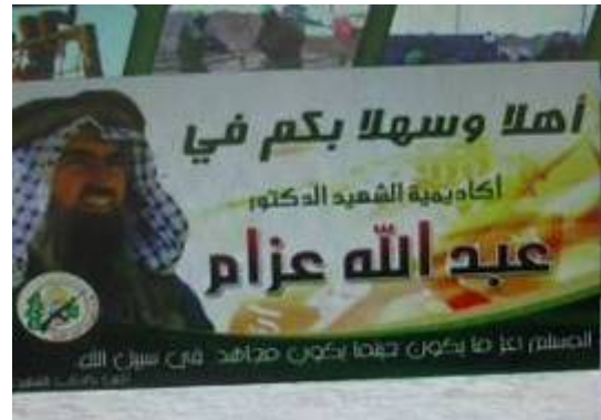
Poster am Eingang zur Akademie mit der Aufschrift "Willkommen in der Akademie des Shahid Dr. Abdallah Azzam." Die letzte Zeile lautet " Ein Muslim schmückt sich mit wahrem Ruhm wenn er zur Verherrlichung Allahs im Dschihad kämpft " [Zitat von Abdallah Azzam ]. Links ist das Abzeichen der Izz al-Din al-Qassam Brigaden zu sehen.