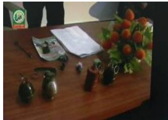
Unterricht im Umgang mit Handgranaten.