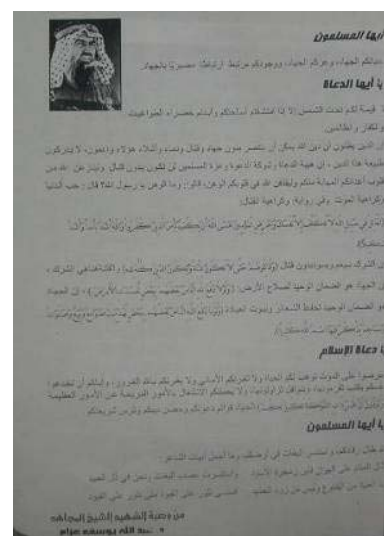
Die letzte Seite des Handbuchs mit der letzten Erklärung von Abdallah Azzam, in der er zum Dschihad gegen "Tyranen, Ungläubige und Unterdrücker" aufruft. Die Hamas hat Abdallah Azzams letzte Äusserungen in der Vergangenheit schon eingesetzt. Der Selbstmordattentäter, der den Anschlag auf den Dolphinarium Nacht Club in Tel Aviv verübt hatte, hatte auch Absätze über den Dschihad und Terror in seinen eigenen letzten Worten zitiert, (Siehe unten).