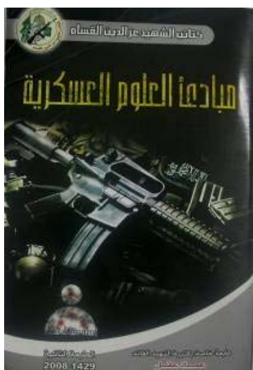
Das Titelblatt eines Izz al-Din al-Qassam Brigaden Ausbildungshandbuchs, das für die Akademie verfasst wurde; Auflage von 2008, während der Operation "Gegossenes Blei" beschlagnahmt.