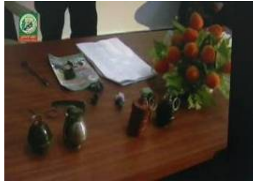
Cours d'utilisation des grenades.