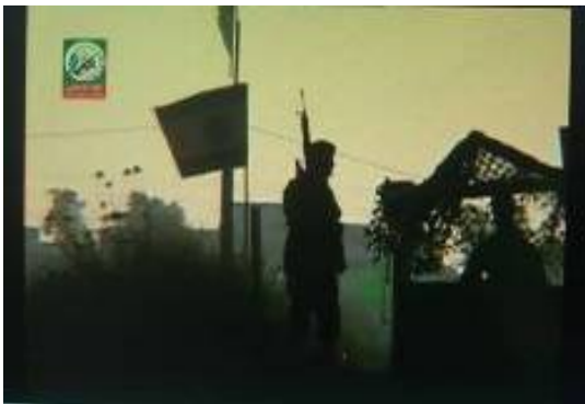
Modèle d'une "position de Tshal" où les étudiants reçoivent une formation pour enlever des soldats israéliens.