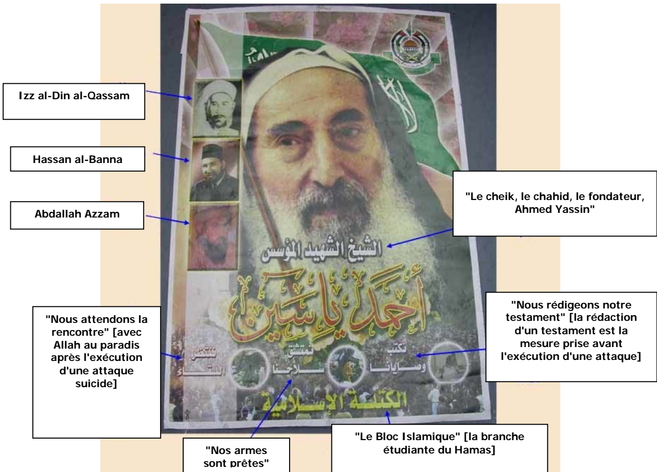
Affiche du Hamas publiée en 2003 en mémoire du cheik Ahmed Yassin et sur laquelle figurent d'autres modèles du Hamas: Izz al-Din al-Qassam, Hassan al-Banna et Abdallah Azzam.