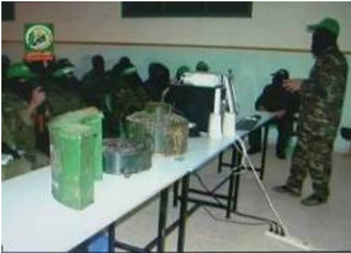
Cours sur la détonation de bombes dans l'une des classes.