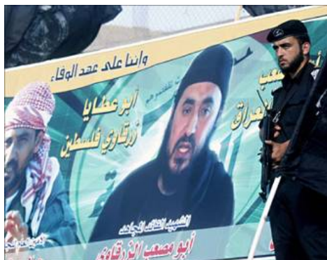
Poster d'Abu Musab al-Zarqawi, ancien responsable d'Al-Qaïda en Irak. Le Palestinien en uniforme appartient à la Force Exécutive du Hamas, qui a été intégrée à la police du Hamas dans la bande de Gaza. A la gauche d'al-Zarqawi figure le dirigeant des Comités de résistance populaire, Jemal Abu Samhadana, appelé "Zarqawi Palestine."