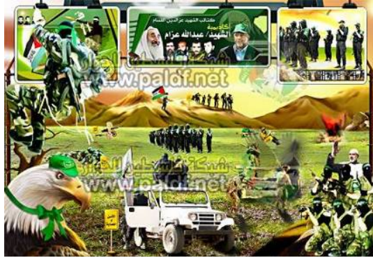
Affiche encourageant l'inscription à l'Académie du chahid Abdallah Azzam. En haut au centre on peut voir le cheik Ahmed Yassin et Abd al-Aziz Rantisi (Forum Internet du Hamas, le 7 mars 2008)