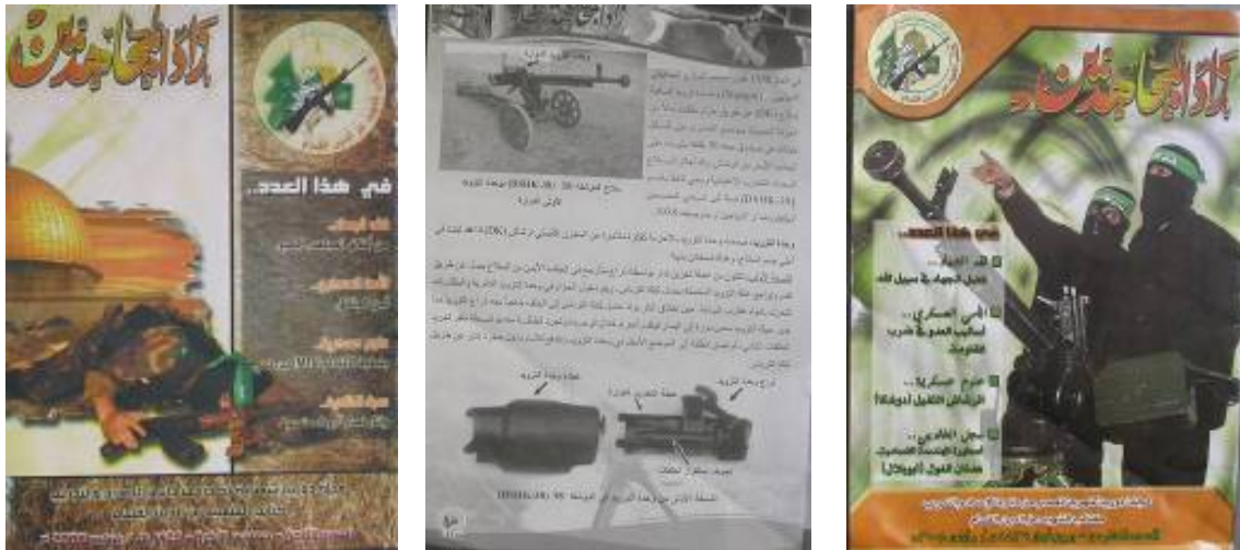
Exemplaires du magazine Zad al-Mujahideen, publié par les Brigades Izz al-Din al-Qassam en 2008 et saisis par Tsahal pendant l'Opération Plomb Durci. "Zad al-Mujahideen" signifie "l'équipement que le combattant du jihad prend avec lui," et est le nom d'un des livres écrits par Abdallah Azzam.