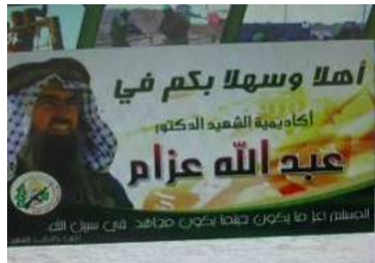
Affiche à l'entrée de l'académie "Bienvenue à l'académie au nom du chahid le Dr. Abdallah Azzam." En bas on peut lire "Un Musulman est plus glorieux quand il réalise le jihad pour Allah" [citation d'Abdallah Azzam]. A gauche, on peut voir l'insigne des Brigades Izz al-Din al-Qassam.