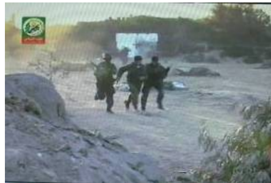
Simulation de l'enlèvement d'un "soldat israélien" (l'homme au centre-droit).