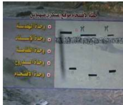
Invasion d'une position de Tshal. Selon les titres en jaune à gauche, la force d'invasion comprend des unités d'ingénierie, des unités auxiliaires, un tireur isolé et des unités d'anti-char.