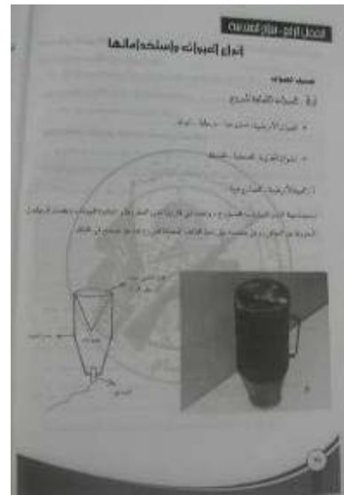
Cours théorique sur le sabotage : explications sur les bombes dans un manuel rédigé pour les étudiants de la première session de formation à l'académie. Le manuel est intitulé : "Principes de la recherche militaire - formation d'un combattant actif - le combattant du jihad, cours au nom du chahid Izzat Abu Sweirat."