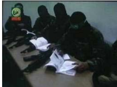
Membres des Brigades Izz al-Din al-Qassam en classe.