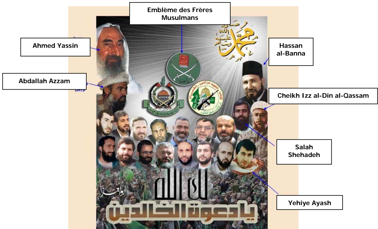
Affiche saisie par Tsahal à l'Université américaine de Jenine en 2003, montrant Abdallah Azzam aux côtés d'Ahmed Yassin et de Hassan Al-Banna, le fondateur des Frères Musulmans, ainsi que d'Yehiye Ayash, "l'ingénieur," et de Salah Shehadeh, qui a dirigé les Brigades Izz al-Din al-Qassam. Le titre de l'affiche est "Pour Toi, Ô Allah. Ô [grands sont] les prêches de l'Islam [da'wah] des hommes éternels [qui sont au paradis]."