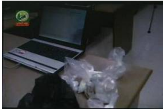
Matériels utilisés dans la fabrication d'explosifs et ordinateur portable dans une des salles de classe.