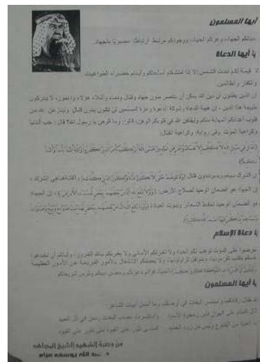
Dernière page du manuel, contenant la dernière déclaration d'Abdallah Azzam, appelant au jihad contre "les tyrans, les infidèles et les oppresseurs."