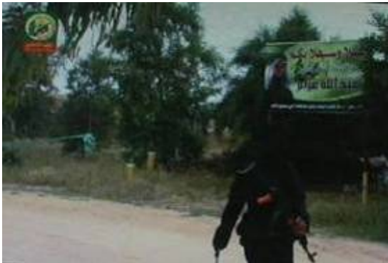
Pancarte à l'entrée de l'Académie Abdallah Azzam.

Pendant l'Opération Plomb Durci, Tsahal a saisi un court métrage sur une académie militaire établie par le Hamas au nom du Dr. Abdallah Azzam, l'idéologue d'Oussama ben Laden. Azzam a été érigé en modèle par le Hamas, bien qu'en pratique, le mouvement limite les activités des réseaux du jihad mondial dans la bande de Gaza.