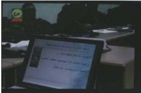
Ordinateur dans une salle de classe affichant des informations sur des armes.