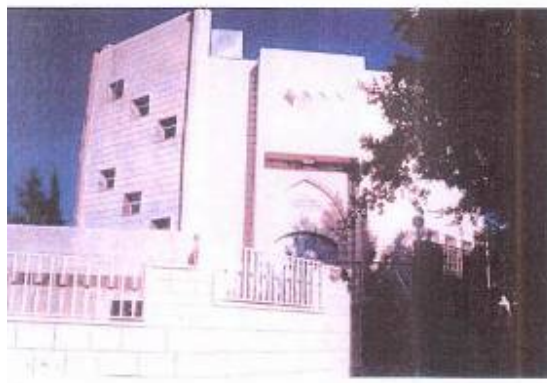
Mosquée au nom d'Abdallah Azzam à Jenine