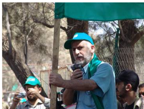
Sayid Siyam, ancien ministre de l'Intérieur de l'administration de facto du Hamas, à l'Académie Abdallah Azzam (Forum du Hamas, 6 juin 2007) 4

activités l'année suivante, puisque des appels encourageant l'inscription ont été publiés sur le forum Internet du Hamas en 2008.