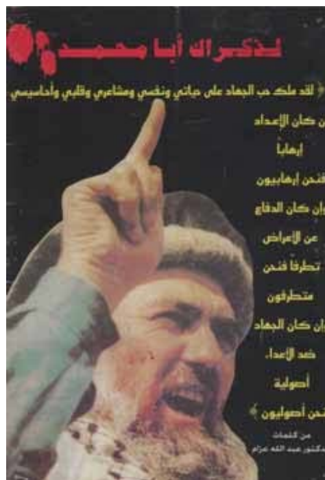
Poster trouvé en 2003 dans un organisme de charité du Hamas à Tulkarem. L'image est celle d'Abdallah Azzam, les inscriptions sont un éloge au jihad