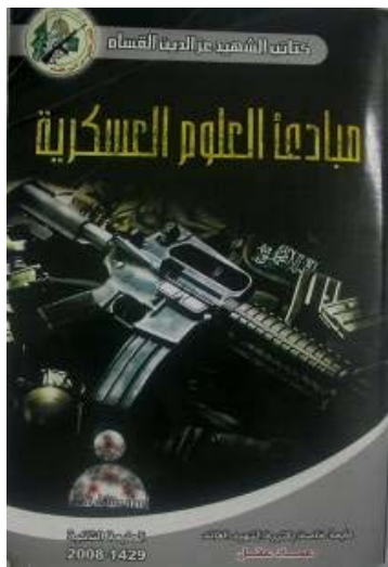
Couverture d'un manuel de formation des Brigades Izz al-Din al-Qassam rédigé pour l'académie, édition 2008, saisi pendant l'Opération Plomb Durci.