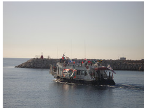
Gauche : Le "Spirit of Humanity." Droite : Départ du navire de Larnaka

■ La branche américaine de Viva Palestine a publié une invitation via son site Internet aux personnes désireuses de rejoindre le convoi d'aide humanitaire de l'organisation, qui quittera New York début Juillet pour arriver à Gaza via l'Egypte. Un convoi semblable quittera la Grande-Bretagne (Site Internet Viva Palestine, 24 juin 2009).