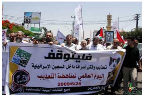
La bande de Gaza marque le troisième anniversaire de l'enlèvement de Gilad Shalit (Site Internet Palestine-Info du Hamas, 29 juin 2009)

● Le ministère des Affaires des prisonniers de l'administration de facto du Hamas a officiellement annoncé qu'il exigeait des médias d'arrêter de spéculer sur un échange de prisonniers qui, a-t-il affirmé, a une influence négative sur le moral des prisonniers palestiniens détenus dans les prisons israéliennes et sur leurs familles (Site Internet Qudsnet, 28 juin 2009). Des centaines de proches des Palestiniens détenus en Israël ont organisé une manifestation au terminal d'Erez, appelant à la levée de la fermeture de la bande de Gaza et à la libération de Gilad Shalit uniquement en échange de la libération de tous les prisonniers palestiniens incarcérés en Israël (Agence France Presse, 24 juin 2009).