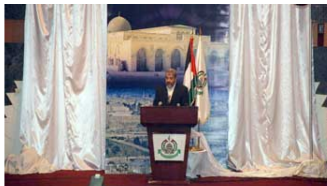
Khaled Mashaal prononce son discours (Site Internet Palestine-Info du Hamas, 29 juin 2009)