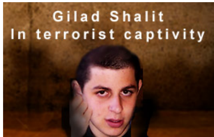
25 juin 2009 : Trois ans se sont écoulés depuis l'enlèvement de Gilad Shalit