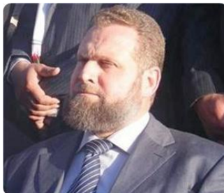
Osama al-Zeini (Site Internet Palestine-Info du Hamas, 29 juin 2009)

● Les hauts responsables du Hamas (Khaled Mashaal, Ismail Haniya, Osama al-Zeini) ont nié les informations se rapportant aux progrès des négociations. Osama al-Zeini a déclaré que depuis que Benjamin Netanyahu avait été élu Premier ministre, aucune nouvelle proposition n'avait été faite.