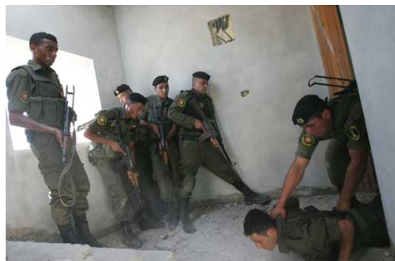
Entraînement des forces de l'Autorité Palestinienne dans les secteurs de Jenine et Tubas (Agence de presse Wafa, 23 juin 2009)