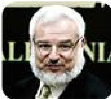
Aziz Dweik, membre du Hamas et président du Conseil Législatif Palestinien, libéré de prison

■ Le 23 juin, Israël a libéré le membre du Hamas Aziz Dweik, ancien président du Conseil Législatif Palestinien. Il avait purgé une peine de trois ans et une cour militaire a refusé de prolonger son emprisonnement. Dweik a été arrêté en Août 2006 par les forces de Tsahal à Ramallah. En Décembre 2008, il a été reconnu coupable d'appartenance à une organisation terroriste et condamné à trois années de prison. Il devrait apparemment retrouver ses fonctions de président du Conseil (Télévision Al-Quds, 23 juin 2009). La faction du Hamas au CLP a organisé une réunion dirigée par Ismail Haniya et l'un des sujets abordés portait sur le moyen de réactiver le Conseil en Judée-Samarie (Site Internet du Centre Al-Bayan, 29 juin 2009).